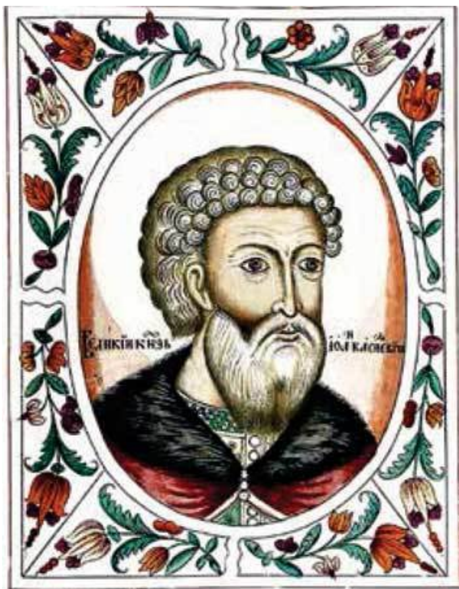
Великий князь Иван III Васильевич. Портрет из «Титулярника» 1672 г.

Отдельную и неоднородную по своему социальному составу группу образовывало духовенство. Его высшие иерархи (митрополит, епископы, игумены и др.), принадлежавшие к числу черного духовенства, принявшего монашеские обеты, располагали значительными земельными владениями, были тесно связаны с представителями московского правящего дома и знатью. Благодаря этому они имели возможность оказывать влияние на внутреннюю политику государства, в том числе и для защиты собственных корпоративных интересов. Белое духовенство (священники) и обычные монахи не обладали значительными привилегиями и по своему экономическому положению недалеко ушли от крестьян и посадских людей.