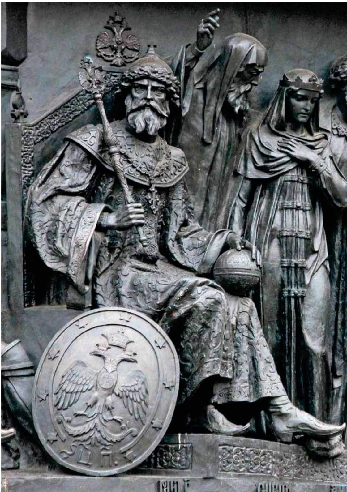
Великий князь Иван III на памятнике «Тысячелетие России». Великий Новгород. Скульптор М. О. Микешин. 1862 г.

Сословные группы, составлявшие русское общество, к тому времени находились в стадии формирования. Ближе всего к великому князю, обладавшему всей властью, были зависимые от Москвы, но еще сохранившие некоторую самостоятельность удельные и служилые князья. За ними шла княжеско-боярская знать, обладавшая правом на занятие важнейших