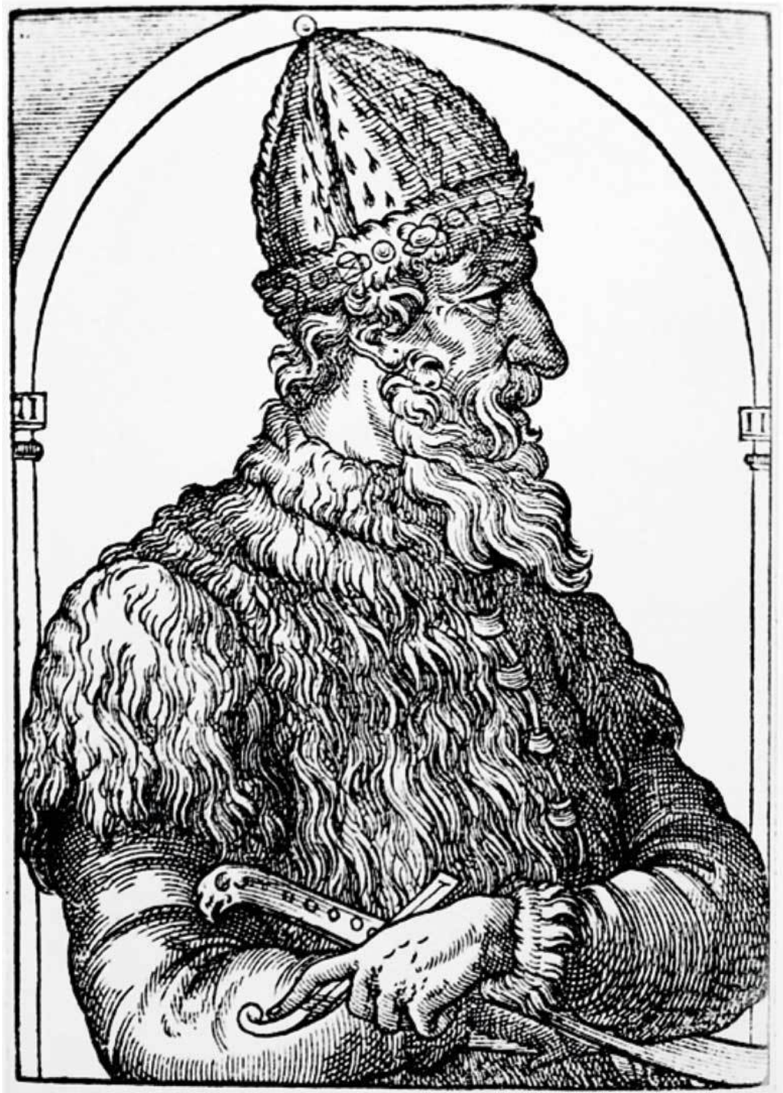
Великий князь Иван III. Гравюра из «Космографии» А. Теве. 1575 г.

В государстве, двигавшемся по пути централизации, появилась новая армия, пришедшая на смену разрозненным дружинам русских княжеств. Иван III и его преемники из военачальников, лично ведущих в бой ратников, становятся главнокомандующими и успешно руководят действиями воевод. Подобная перемена открыла перед великим князем пространство страте-