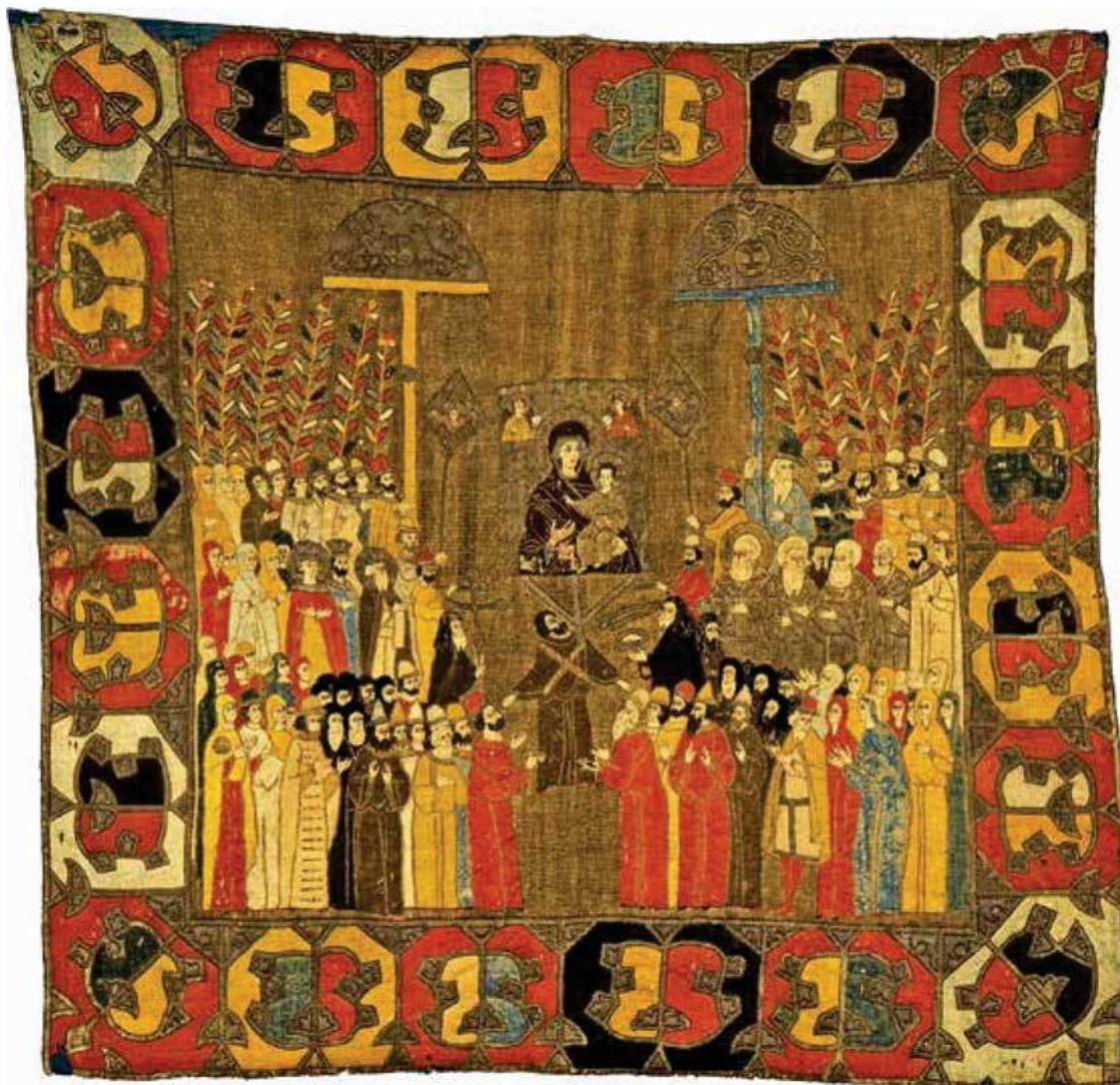
Семья великого князя Ивана III на пелене из мастерской великой Елены Волошанки

Великое княжество Московское и другие русские земли были тогда недостаточно известны в международной политике. Золотая Орда и ее ханы, почтительно именуемые в русских источниках царями, продолжали оказывать колоссальное влияние на политическую жизнь Руси, поскольку именно ордынский правитель давал ярлык на великое княжение, фактически решая, кому достанется пальма первенства среди русских князей. Продолжались и выплаты выхода (дани) татарам, а суверенитет хана считался непоколебимым. До княжения Ивана III осознанного стремления к независимости не прослеживается: все конфликты касались либо отдельных представителей власти Золотой Орды, либо тех, кто узурпировал власть, и их легитимность не признавалась (например, Мамай).