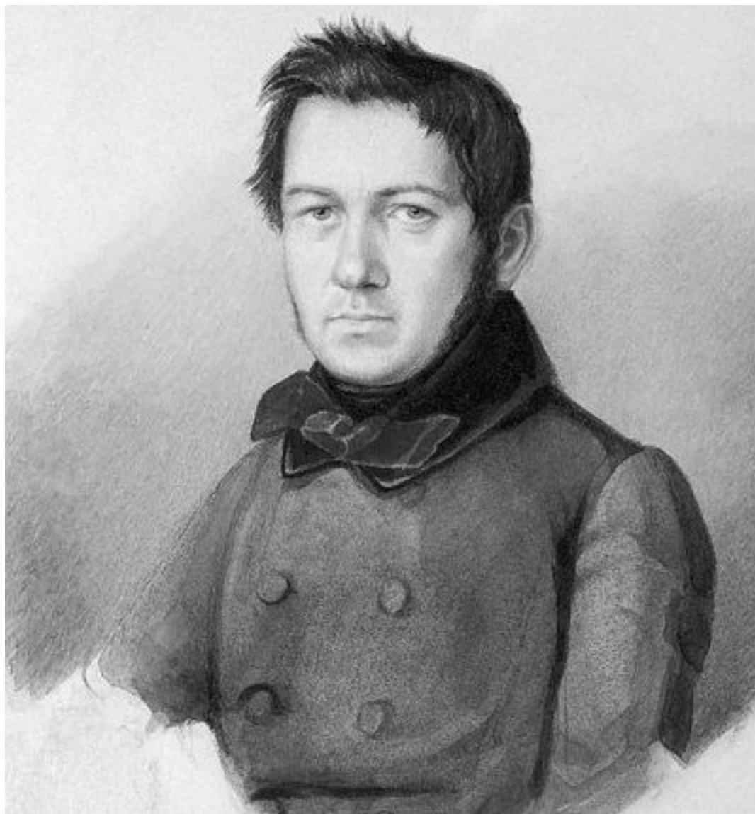
Композитор М.И. Глинка. Портрет работы К.П. Брюллова. 1840 г.(?)