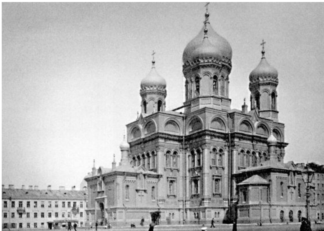
Церковь во имя Воскресения Христова на Воскресенской площади. Фото Н.Г. Матвеева. 1900-е гг.

Трехпрестольная церковь Воскресения Христова имела два этажа, три придела: главный, во имя Воскресения Христова, и названные боковые устроили в верхнем этаже. В нижнем располагались вертеп Рождества Христова по образцу Вифлеемского и еще два боковых придела. Интерьеры нижней церкви выполнили в 1870-е годы по проекту архитектора С.В. Садовникова.