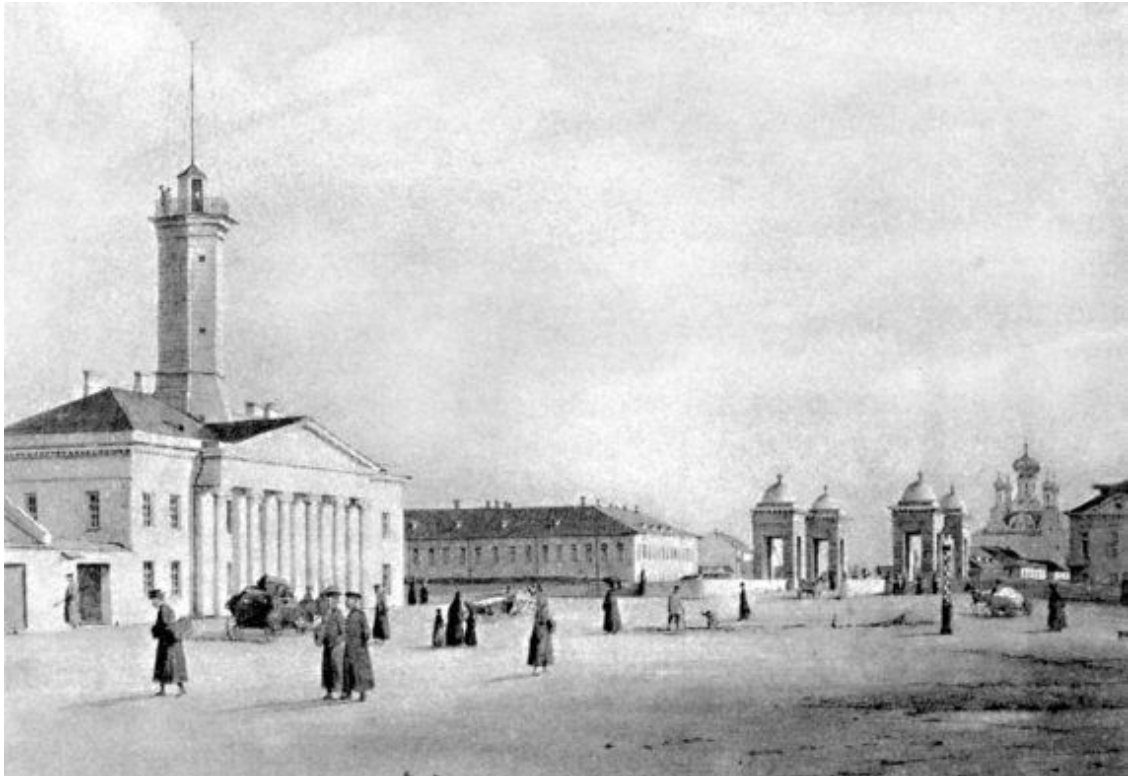
Площадь у Старо-Калинкина моста. Литография Ф.-В. Перро. Около 1840 г.

А.С. Пушкин первым воспел Коломну. 11 июня 1817 года, окончив лицей, он поселился у родителей, снимавших квартиру в доме члена Адмиралтейств-коллегии, адмирала Алексея Федотовича Клокачева, на набережной реки Фонтанки в доме № 185, рядом с Калинкиным мостом. Неширокие улицы с низенькими деревянными домами, церковью, пожарной каланчой и вылинявшими под дождем и ветром полосатыми полицейскими будками придавали тогда Коломне вид городской окраины. Фонтанка, с облицованными гранитом берегами, окаймленная кружевами чугунных решеток, несла свои воды в Балтийское море. Двухэтажный на полуподвале дом вице-адмирала А.Ф. Клокачева, лишенный всяких украшений, кроме фигурных оконных наличников, сдавался чиновникам и обедневшим дворянам, к числу которых принадлежала семья поэта. В первом этаже снимали квартиру родители его однокашника – лицеиста Модиньки Корфа.