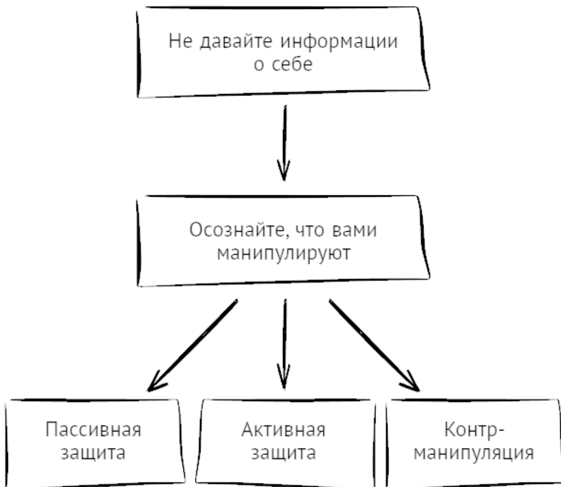
Рис. 3. Блок-схема противодействия манипулированию

При всем громадном многообразии манипуляций они строятся по одной универсальной модели, представленной в разделе «Скрытое управление: сущность, виды, модель». Знание этой модели позволяет выстроить надежную защиту от любой манипуляции. Осуществить защиту можно, следуя приводимой ниже универсальной блок-схеме (рис. 3).