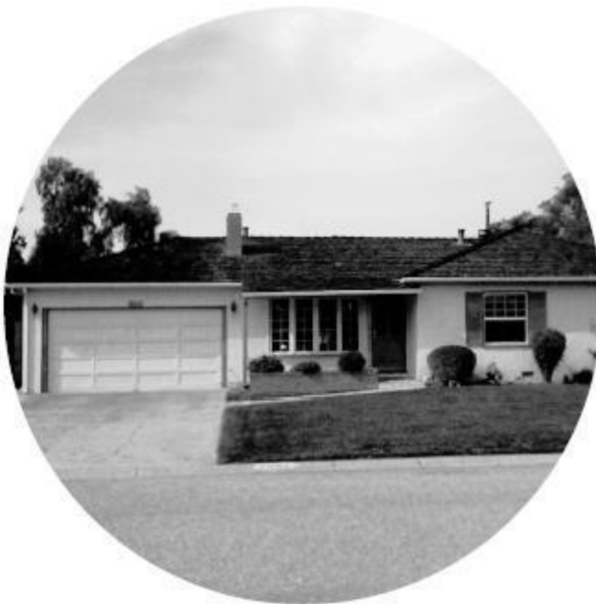
Дом в Саннивейле и гараж, где начиналась компания Apple