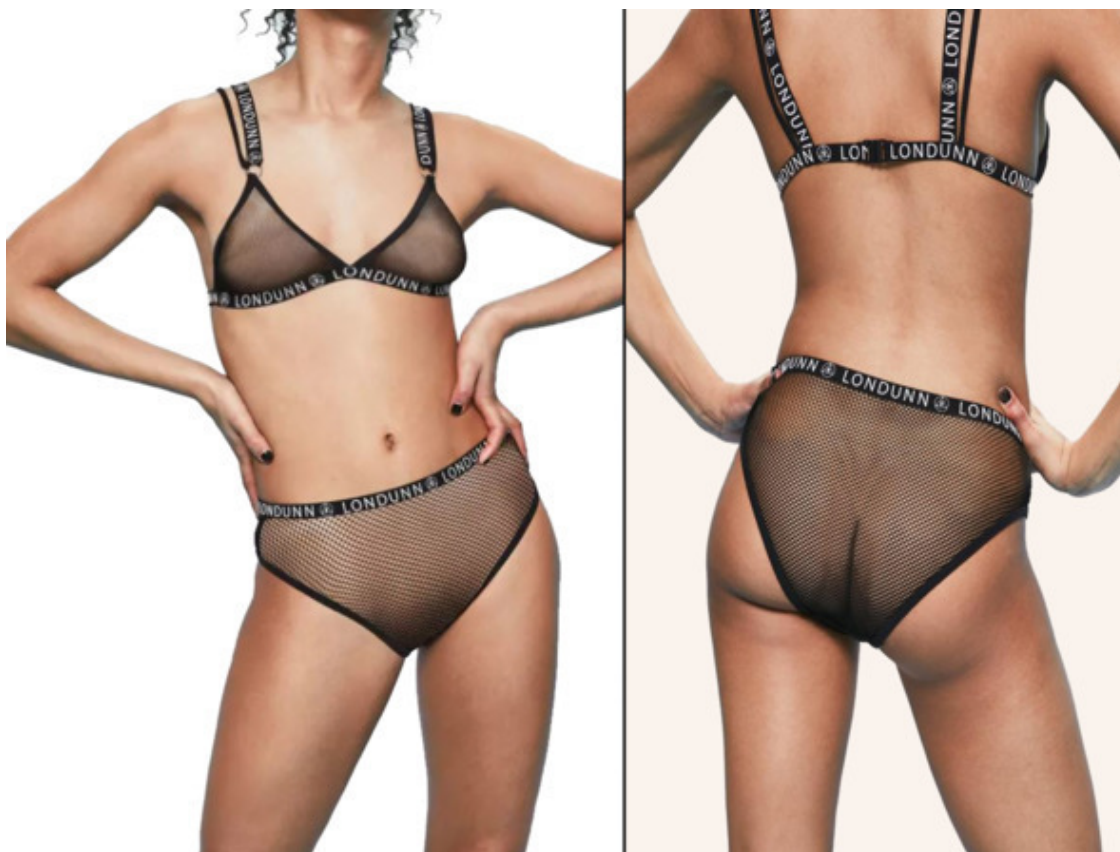
Сбитое телосложение и короткое туловище Стройной колонны.