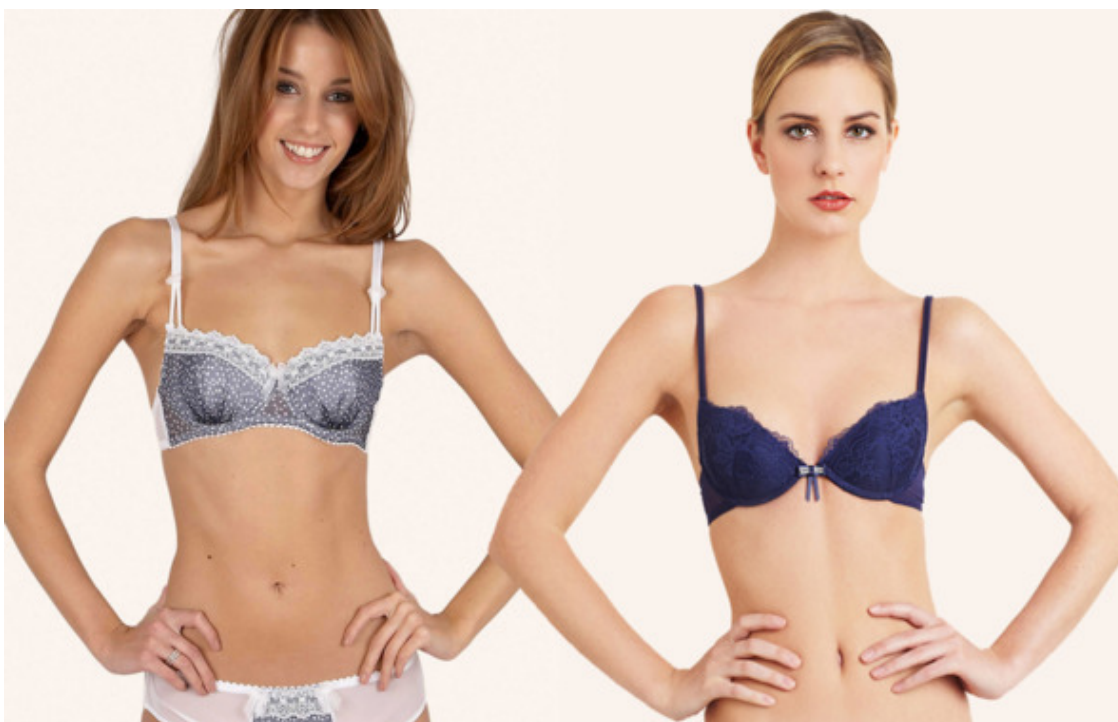
Маленькая грудь Стройной колонны.

Величина груди у Стройной колонны не корректируется при помощи push-up лифчиков. При подборе формы груди на имплантации необходимо подбирать грудь покато́й формы, характерную для фигуры Прямоугольник. Жировые отложения не образуют кожных складок и надутого живота.