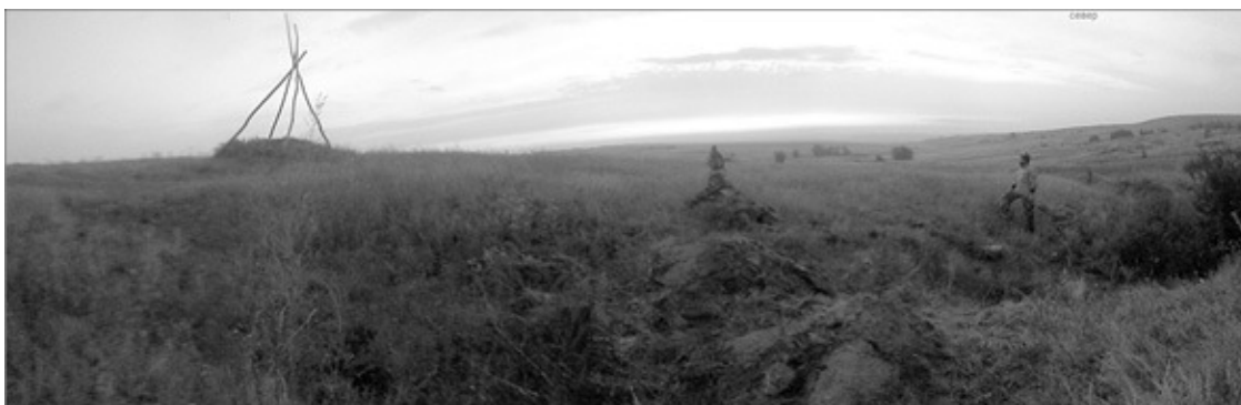
Медведицкая гряда. Панорама степи

Что еще мне на это сказать? Видел ли мираж – нет, абсолютно точно, нет, я ведь стучал в окно, открывал и закрывал за собой дверь, чувствовал прохладу дома и запах печи, я разве что воды там не напился. Может, это был особый мираж? Такой, о которых мне приходилось только читать, образно назвал бы их миражами из Прошлого или хрономиражами! А может, я просто заблудился тогда и случайно или «с чьей-то помощью» попал в какую-то иную деревню? Тоже маловероятно. Одно дело – объяснять, что видели другие, другое дело – понять и поверить в то, что видел сам. Не знаю, не знаю... История эта закончилась ровно ничем.