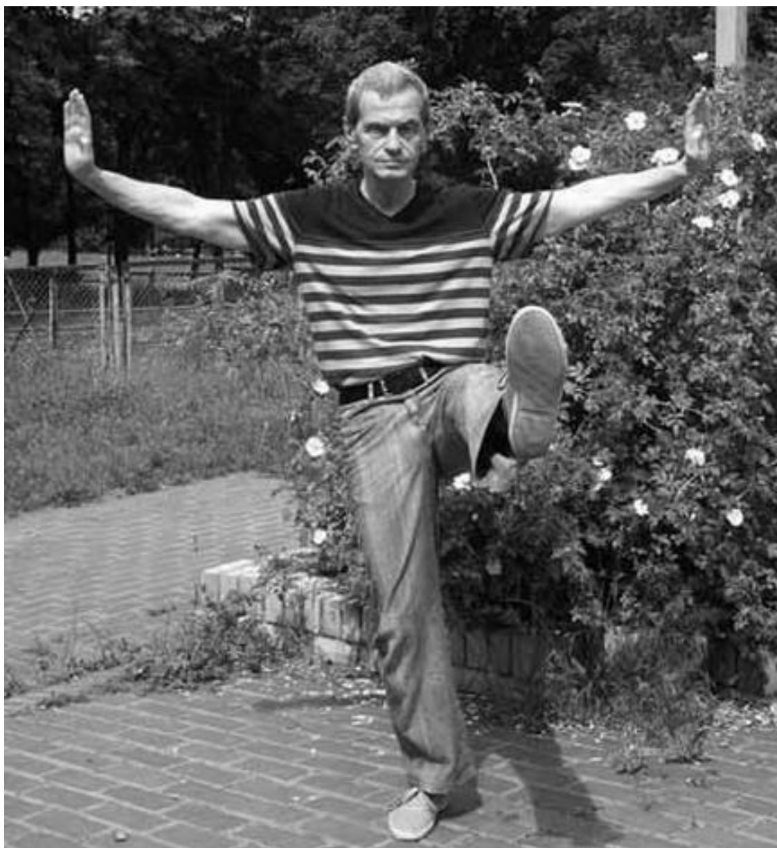
Подъем ноги вперед (вид спереди)