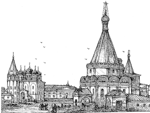
Михайло-Архангельский и Спасо-Преображенский соборы в кремле.

В ночь с пятницы на Родительскую субботу Лыков с тремя опытными агентами сыскной полиции сидел в засаде в помещении Николаевского городского общественного банка. На другой стороне Рождественской улицы, в корпусе общественных лавок прятались Каргер, Благово и десять вооруженных городских. Еще четверо агентов во главе с Титусом скрывались во флигеле, в квартире, соседней с той, что снимали поляки. Лыков со своими людьми проникли в банк тайно, поодиночке, через общий зал и кабинет директора, под видом посетителей.