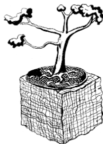
Рис. Композиция в стиле бансай.

В японском языке слово «бонсай» обозначает весь процесс выведения на подносе или в неглубоком горшке определенного вида или группы растений. Очевидно, что если дерево может быть выращено на подносе, то должен существовать метод культивирования миниатюрных образцов того или иного вида. Бонсай в классическом варианте можно представить как дерево или ландшафтную композицию, уменьшенную в десятки раз. Основные элементы бонсай – растения, грунт и горшок. Все это вместе создает прекрасную живую картину, которая долгое время тешит глаз своего творца.