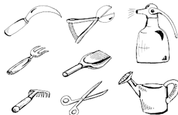
Рис. Инвентарь для ухода за комнатными растениями.

Приобретение этого нехитрого инвентаря не представляет никаких трудностей. А для хранения всех этих принадлежностей лучше выделить ящичек на кухне или на балконе.