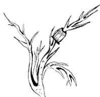
Рис. Выбор ветки для бонсай и отделение отводка.

Второй способ – выращивание бонсай из черенков и отводков, в том числе и из воздушных отводков. Особенно хорош этот способ для вьющихся растений – кустарников и некоторых видов деревьев. Нужно выбрать ветку, в которой уже проглядывался бы будущий бонсай.