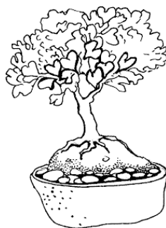
Рис. Композиция с бансай.

Практика создания композиций из растений, которыми можно заменить бонсаи, даст вам опыт в создании композиций из более ценных экземпляров, которые к тому моменту, как вы немного научитесь составлять такие уголки природы, уже немного подрастут и сформируются.