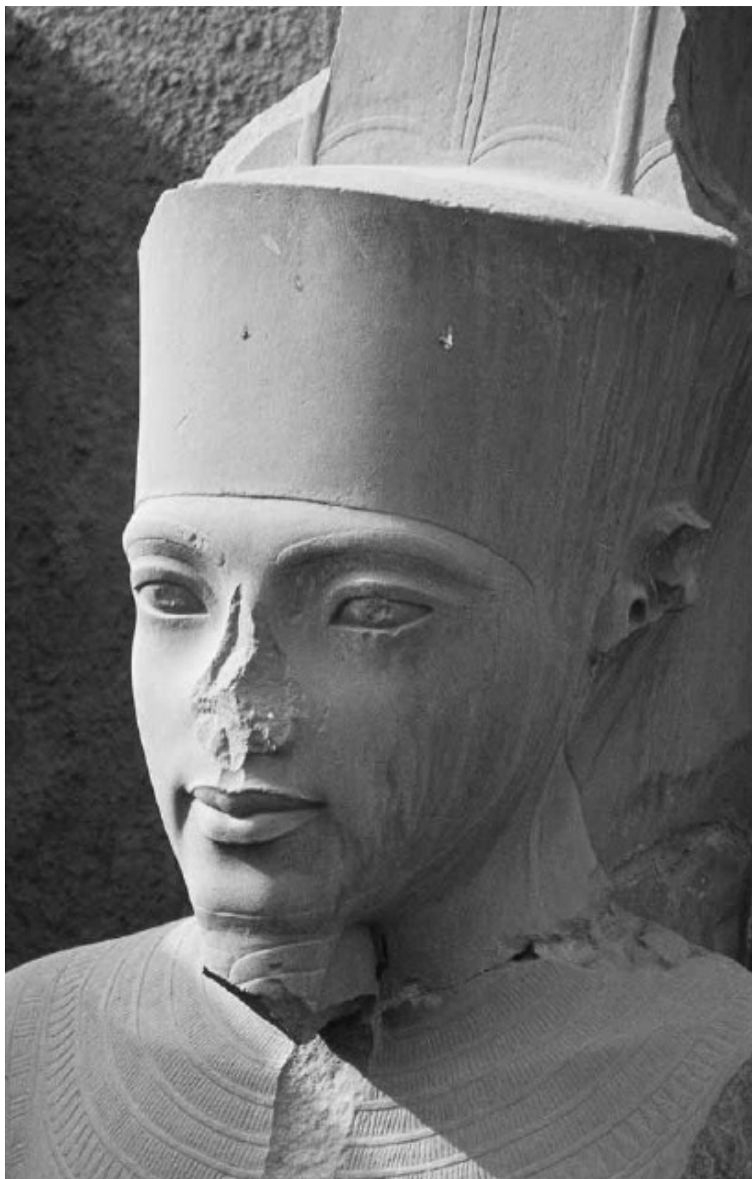
Тутанхамон в образе бога Амона. Храм Амона-Ра в Карнаке

На протяжении многих исторических циклов, длящихся сотни тысяч лет, и в разные периоды резких перемен человек старался более или менее логически объяснить эту инстинк-