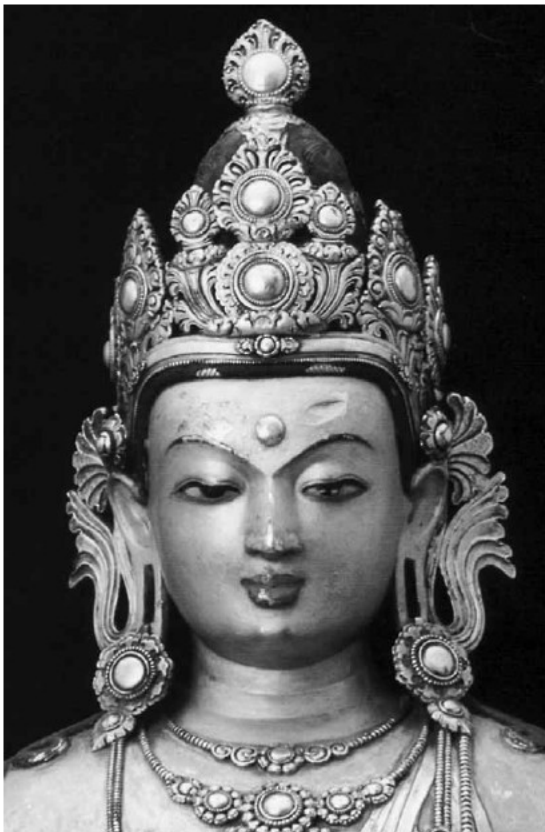
Будда. XVII в. Улан-Батор, Музей изобразительных искусств

Но почему мы говорим о «мнимых атеистах»?