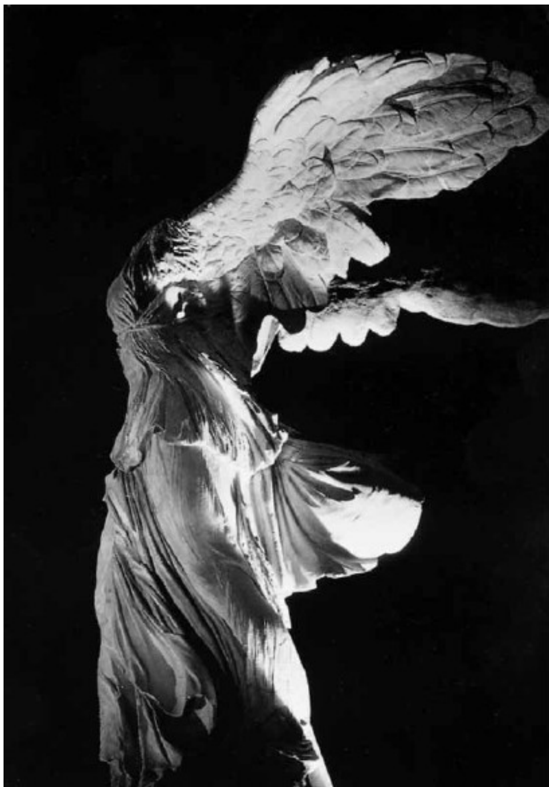
Ника Самофракийская. Ок. 190 г. до н. э. Париж, Лувр

Мы нуждаемся в новой науке, которая не будет служить искусственно созданным интересам и оправдывать насилие. Нам нужно новое искусство, которое даст нам возможность снова соединиться с Прекрасным, искусство, основанное не на тоске и беспокойстве, а на подлинном исследовании. Нам нужна новая политика, которая приведет людей к сосуществованию и благородству, а не к столкновениям и безответственному сожительству. И нам нужен новый мир. Но этот мир уже существует – это все та же Вселенная. Это природа. Главное, что нам