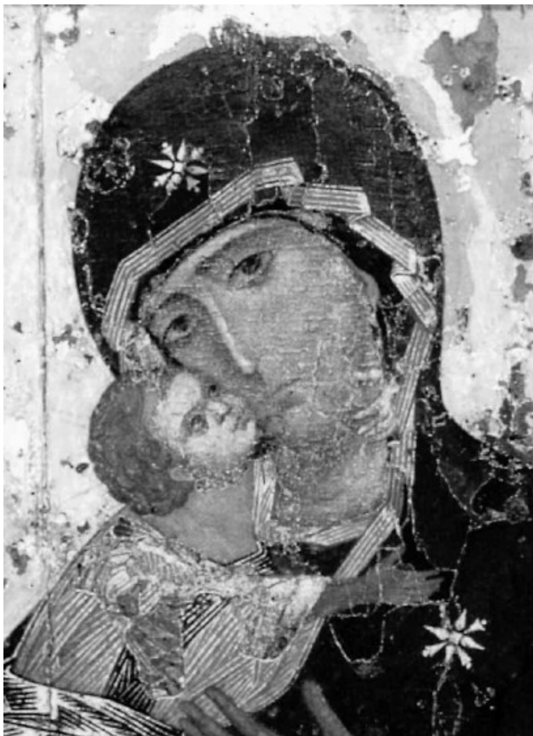
Икона «Богоматерь Владимирская». XII в. Москва, Третьяковская галерея