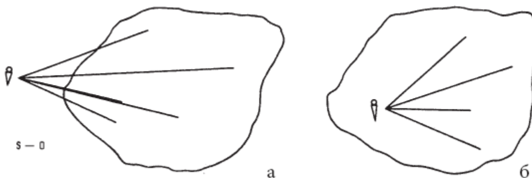
Рис. 1. Схематическое изображение «онтологии изолированного индивида» (а) и «онтологии жизненного мира» (б)

Итак, в «онтологии жизненного мира» отношения, связывающие субъекта с миром, наделяются статусом особой реальности, первичной по отношению к характеристикам субъекта, формирующимся в процессе реализации этих отношений (в частности, приобретаемым психологическим, в том числе личностным характеристикам). Схематически соотношение двух обозначенных онтологических картин представлено на рисунке 1. Опираясь на эту общую онтологическую модель, мы можем попытаться задать основания логики жизни человека в мире, описав через систему специальных понятий реальность практических взаимоотношений человека с миром.