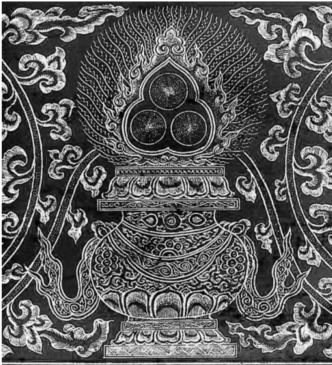
Илл. 5. Триратна Джины

ной неканонической «Книге Товита», где Товит, дядя Ахикара, внушает своему сыну Товию: «...будь благоразумен во всем поведении твоём. Что ненавистно тебе самому, того не делай никому» (Тов. 4:15).