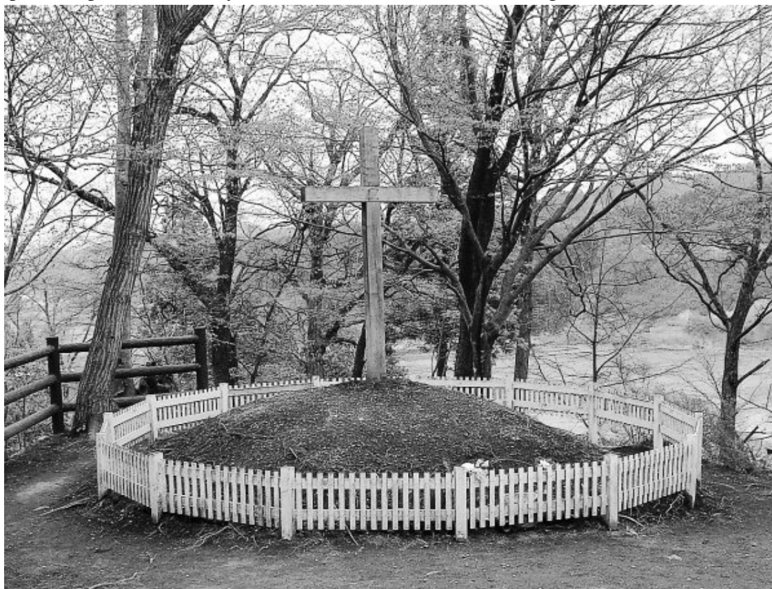
Илл. 9. «Могила Иисуса» в Шинго, Япония

Согласно «японской» версии, на Голгофу взойшел не Иисус, а его младший брат. Эта подмена позволила самому Иисусу и нескольким его ученикам ускользнуть от мучителей и через Сибирь добраться до Японии. Беглецы нашли приют в маленькой горной деревушке Хэрай (как объясняют, это искаженное в соответствии с особенностями японского произношения слово hebrew , т. е. «иудей»), В этой деревне Иисус взял себе в жены японку Миюко, которая родила ему трех дочерей. А сам Иисус дожил до вполне почтенного возраста и скончался в 106 лет.