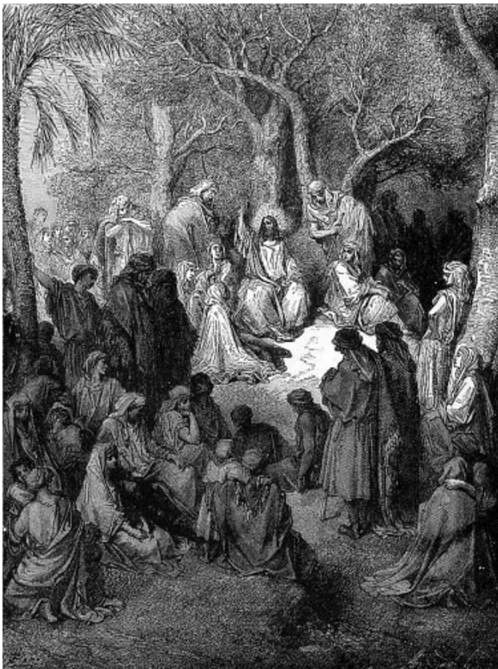
Илл. 4. Нагорная проповедь Иисуса

И еще дальше на Востоке, уже на самом краю Ойкумены, в трактатах мудрецов Древнего Китая мы обнаружим те же слова. «Мудрый человек действует без насилия и никому ничем не вредит», 8 – записал Лао-цзы (предположит. 604–517 гг. до н. э.) в «Книге о Дао и дэ». А в трактате Конфуция (551–479 гг. до н. э.) встречается уже совершенно идентичная формулировка: «Цзы Гун спросил: как в немногих словах выразить принцип, которым можно руководствоваться всю жизнь? Учитель ответил: „Не делай другим того, чего не пожелаешь себе“» 9 .