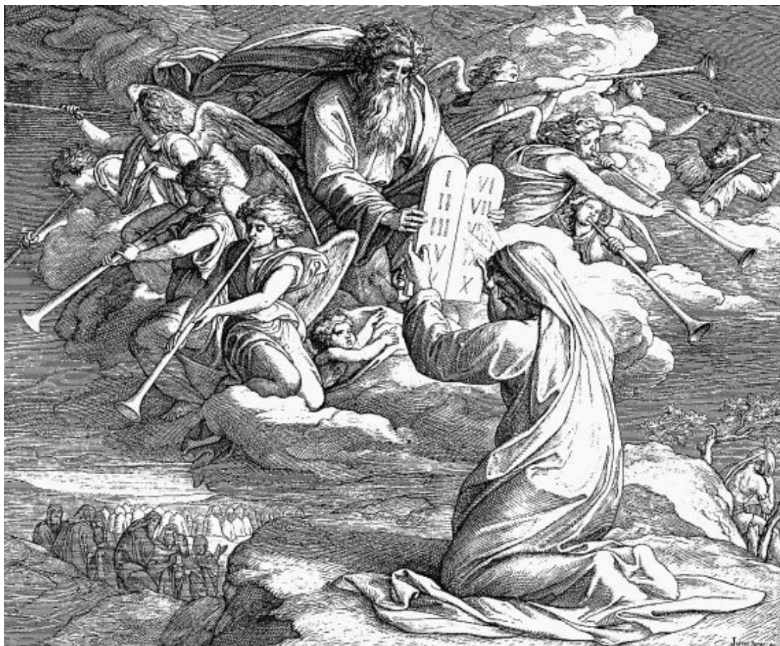
Илл. 10. Моисей получает скрижали на вершине горы Синай

«Помимо непосредственной генетической связи, история культуры отметила ряд фактов соответствий между некоторыми явлениями в развитии античной философии и аналогичных явлений в развитии философии весьма отдаленных от Греции, Древнего Китая и Древней Индии», – отмечал В. Ф. Асмус в предисловии к книге «История античной философии». «Является ли преемственность культур или связи между ними единственным объяснением, единственной причиной сходства философских систем и открытий (откровений. – Авт.)? Такое сходство, наблюдаемое у отдаленных культур (Греция – Индия, Китай – Америка) – свидетельство противного . Даже и без непосредственного контакта люди в разных углах Земли пришли бы к одним выводам и открытиям, ибо причина, приводящая к ним, – одна и та же . Вот правило; контакты же – исключение, хотя (в европейском ареале особенно) на них следует делать серьезную поправку» 26 .