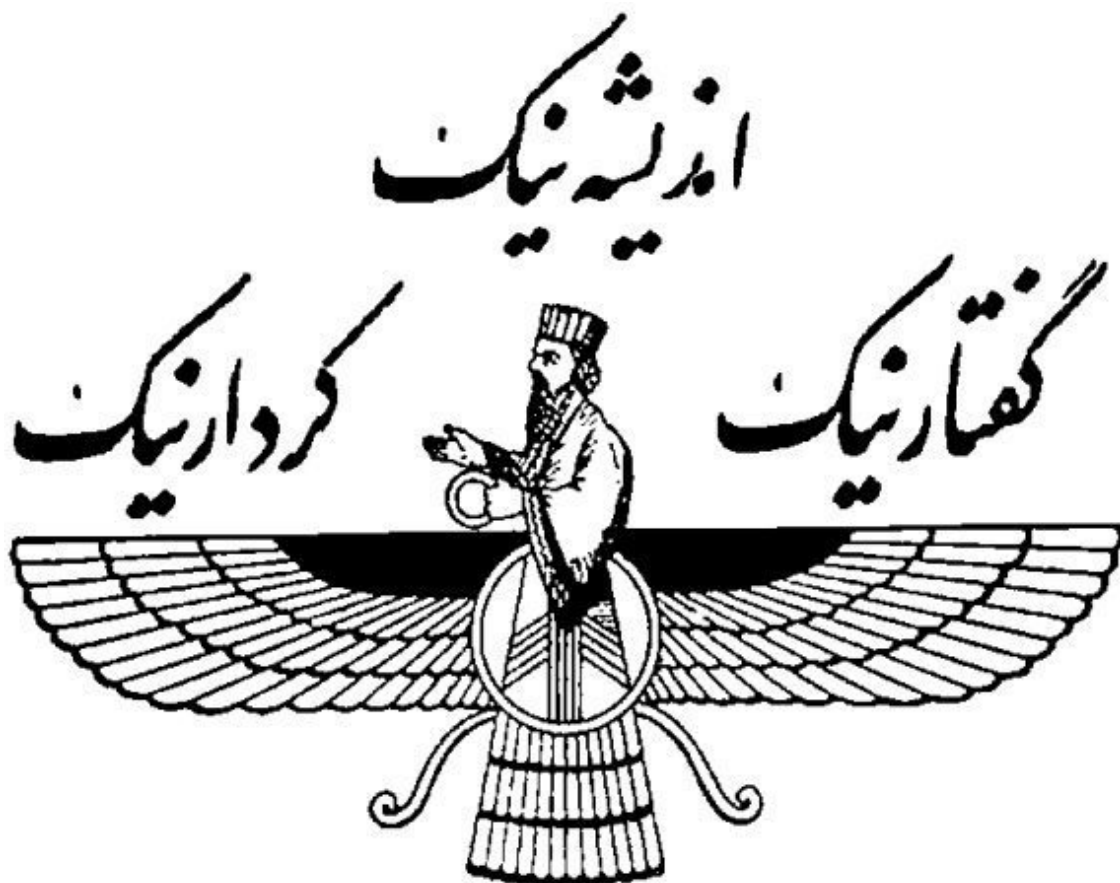
Илл. 7. Три принципа благой жизни зороастризма

Тот факт, что в разных культурах, связь между которыми на том этапе маловероятна и во всяком случае никак не удостоверена не ведавшими друг о друге мыслителями, один и тот же принцип формулируется схожим, практически одинаковым образом, не может не вызывать удивления!