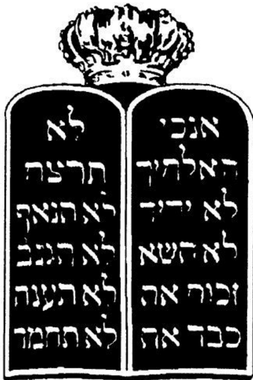
Илл. 6. Скрижали с десятью заповедями Яхве