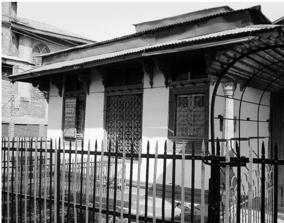
Илл. 8. Розабал – «могила Иисуса» в Шринагаре, Индия

Что доказывает эта гипотеза? Ровным счетом ничего. Индийская цивилизация гораздо древнее европейской. Веды написаны задолго до рождения Иисуса. Буддизм моложе Вед, но и его возникновение отделено от христианства пятью столетиями. То же можно сказать о религии Зороастра, который умер не менее чем шестью веками раньше, чем родился Иисус (некоторые источники говорят даже о десяти веках). Иисус никак не мог оказать влияние ни на ведийский брахманизм, ни на буддизм, ни на зороастризм. Тогда, может быть, наоборот, он почерпнул свое учение из этих древних источников? Этого тоже быть не могло, ведь он выступил со своей проповедью до, а не после того, как (следуя рассматриваемой гипотезе) оказался на Востоке. То есть, создавая свое учение, он еще не был знаком с религиями Индии и Ирана.