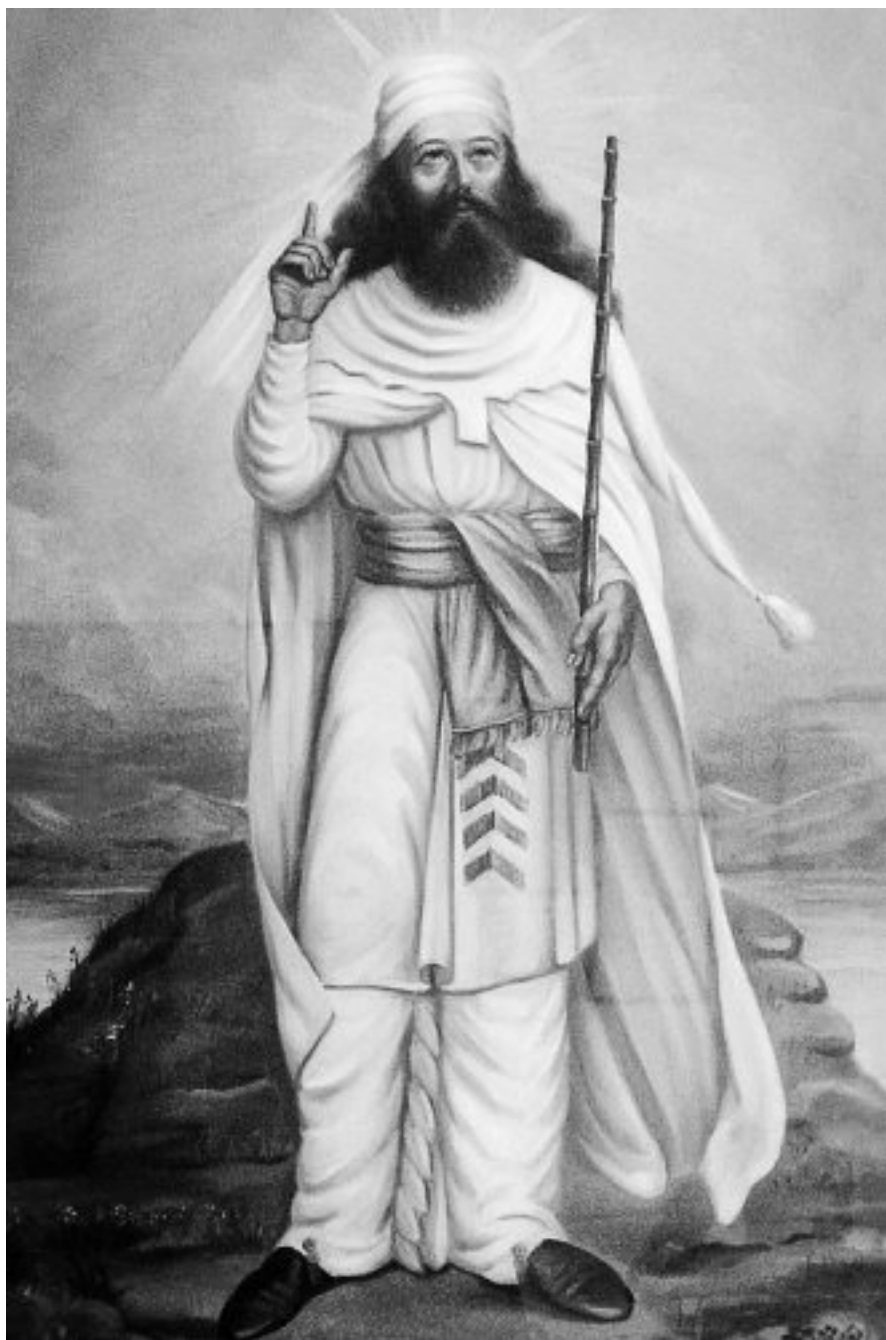
Илл. 3. Заратуштра провозглашает принципы благой жизни

Если из средиземноморского ареала мы двинемся на Восток, к иным культурам и иным религиям, то и здесь обнаружим ту же формулу. В Дхаммападе, сборнике буддийских изречений, есть такая рекомендация: «Как он поучает другого, так пусть поступает и сам» 6 . А в еще более древнем источнике – «Махабхарате» можно отыскать такое наставление: «Те поступки других, которые человек для себя не желает, что самому неприятно, пусть не делает другим людям» 7 .