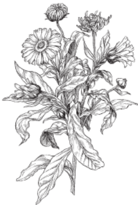
Ноготки лекарственные (календула)

Ноготки лекарственные относятся к семейству сложноцветных – Compositae . Поскольку растение является однолетним, каждый год оно отмирает к зиме и размножается посевом семян весной. Высота его не превышает 70 см, но, как правило, средний размер меньше – 20–50 см.