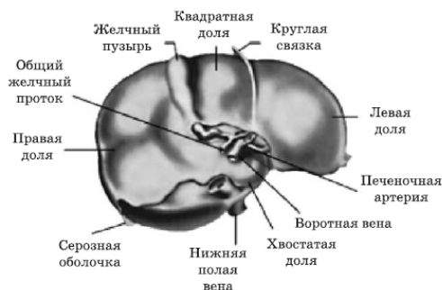
Рис. 2. Печень в разрезе

Учитывая, что множество неприятностей с работой печени кроется в нарушении проходимости желчных протоков, уделим немного времени особенностям их анатомического строения. Попробуем ответить на простой вопрос: зачем печени желчный пузырь?