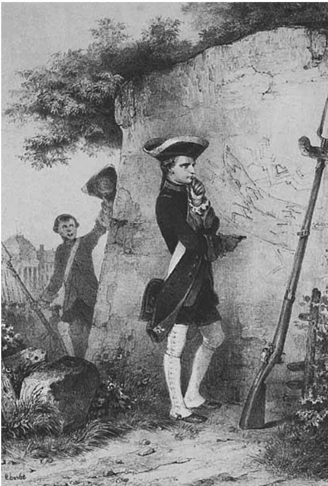
Юный Бонапарт рисует на стене план битвы

Никола Туссен Шарле. «Бонапарт рисует на стене план сражения»