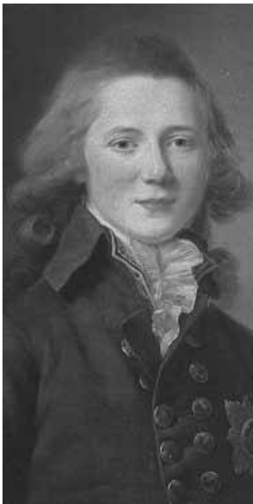
Жан-Луи Вюаль. «Великий князь Александр Павлович»

Летиция Буонапарте кормила грудью сына Жозефа (пятерых детей она потеряла в младенчестве) и вынашивала следующего в военном лагере корсиканских патриотов, пытавшихся вернуть свободу своему родному острову. Летиция вспоминала: «Частенько я выбиралась из нашего укрытия в горах, чтобы только узнать новости, и слышала, как свистели вокруг пули, но я верила, что Мадонна спасёт меня». Мадонна спасла. И её, и будущего сына.