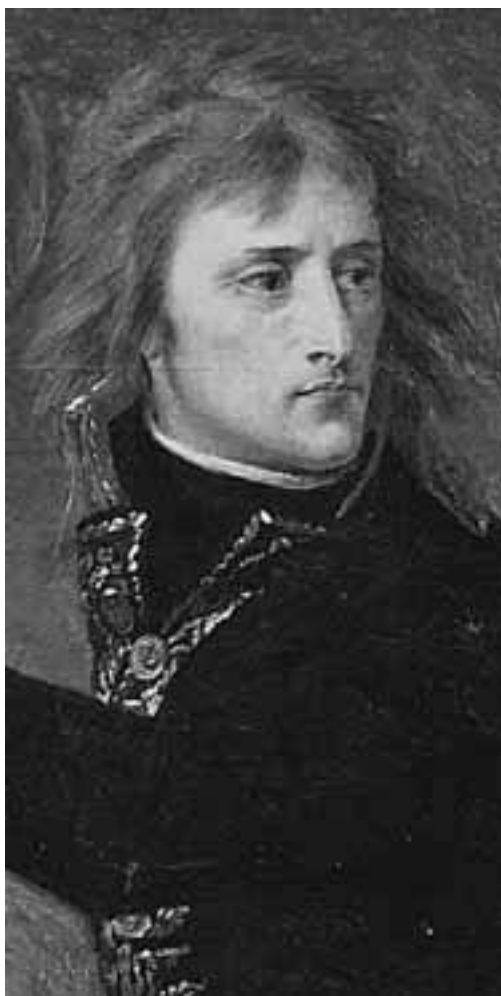
Антуан Гро. «Бонапарт на Аркольском мосту»

Чтобы родить ребёнка, здорового физически и душевно, будущая мать должна смотреть на красивые вещи, на мирные пейзажи, слушать прекрасную музыку, её должны окружать покой, любовь и забота. Такое поверье существует почти у всех народов земли. А что нужно, чтобы родить гения?