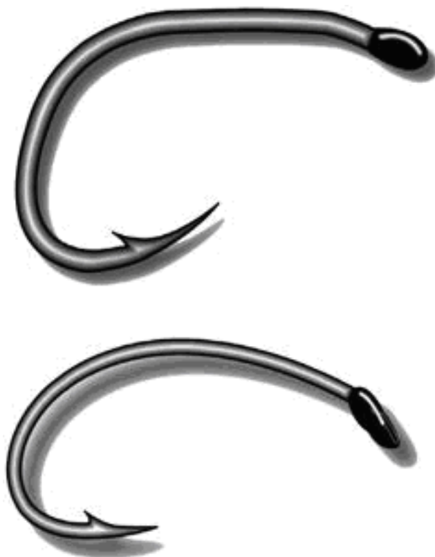
Рис. 4. Нахлыстовые крючки