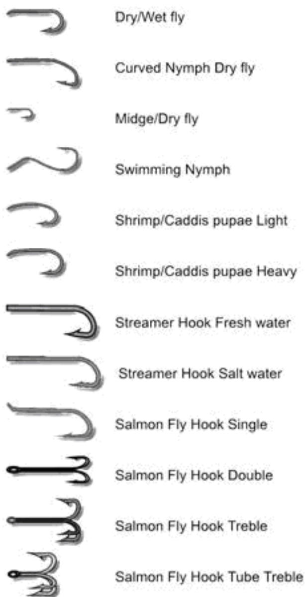
Рис. 5. Карповые

К слову, с этой же целью можно применять и похожие по форме карповые крючки (рис.5). Существуют модели с горизонтально ориентированным колечком (в на хлыстовой ловле употребляются редко), а также с колечком, направленным вниз (их большинство) и вверх.