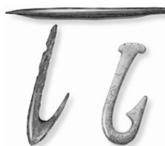
Рис. 3. Крючки, обнаруженные при раскопках

Между тем, как конструкция, рыболовный крючок не всегда был именно крючком, хотя, как приспособление для ловли рыбы, он известен с доисторического периода. Первые его «модели», обнаруженные при раскопках, представляют собой заостренный с двух сторон обломок кости с выточенной поперек канавкой для того, чтобы его можно было к чему-то привязать, и по форме ничего общего с крючком не имели (рис. 3). Прошло не одно тысячелетие, прежде чем это примитивное изделие приобрело привычные очертания. На самом деле достоверно не выяснено, когда рыболовный крючок был изобретен, во всяком случае, в эпоху неолита он уже был и изготавливался из костей, раковин и других подручных материалов.