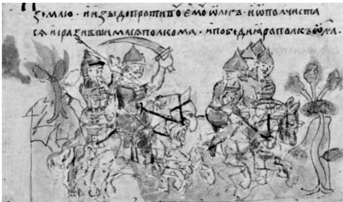
Бегство древлянского князя Олега Святославича. Миниатюра Радзивилловской летописи