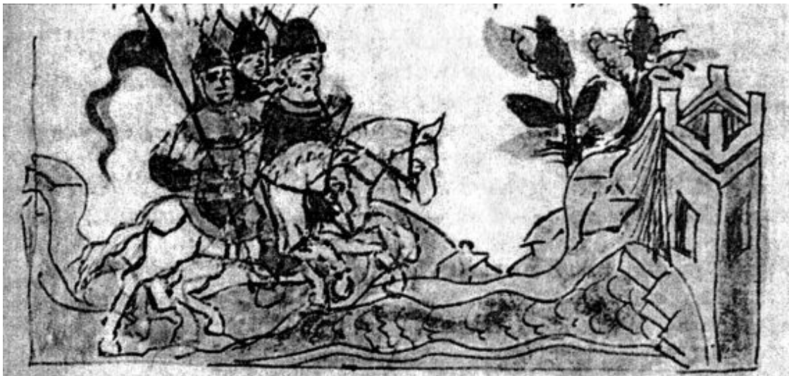
Подступ князя Владимира к Киеву. Миниатюра Радзивилловской летописи

Блуду, и тот, по словам Повести временных лет, «мысля убить Ярополка; гражаны же не бе лзе убить его», то есть киевский «полк» (ополчение рядовых горожан) служил Ярополку надежной защитой от любых покушений на его жизнь. Расстановка сил в осажденном городе, вероятно, была такова, что проязычески настроенной дружинной верхушке, желавшей сдачи Киева Владимиру, противостояла городская христианская община, по археологическим данным весьма многочисленная.