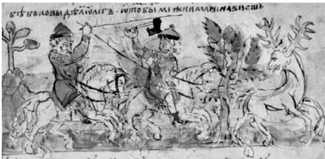
Убийство Люта древлянским князем Олегом Святославичем. Миниатюра Радзивилловской летописи

Свенгельд добивался правды в полном соответствии с законом русским: «Убьеть муж мужа, то мьститъ брату брата, или сынови отца, любо отцю сына... » Видимо, поэтому речи воеводы в конце концов были услышаны: «Поиди Ярополк на Олга, брата своего, на Деревьску землю. И изиде противу его Олег, и ополчистася». Однако в бою Олег не устоял и побежал «с вой своими в град, рекомый Вручий [Овруч]». Путь к городским воротам лежал через мост, перекинутый надо рвом. Преследуемые беглецы ринулись по нему всем скопом, тесня и сбрасывая друг друга в ров. Вместе со многими простыми воинами спихнули вниз и Олега. Под тяжестью придавивших его людей и лошадей князь задохнулся (по сведениям Иакова Мниха, мост, не выдержав тяжести, рухнул и придавил Олега во рву).