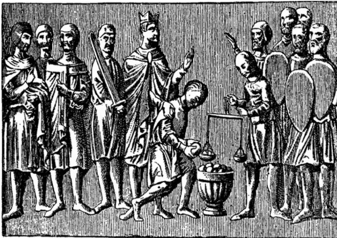
Болеслав I Храбрый выкупает у пруссов останки святого Адальберта-Войтеха. Бронзовый барельеф на дверях собора в Гнезно

Однако точно ли матерью Вышеслава была «чехиня»? Формальным поводом для сомнений на этот счет служит то обстоятельство, что во второй половине X в. Чехия имела официальный статус христианской державы. Между тем Владимир в середине 70-х гг. X в. не только оставался язычником, но и был уже женат на Рогнеде. Как же мог состояться брак между язычником-многоженцем и христианкой? Тем не менее такая возможность совсем не исключена.