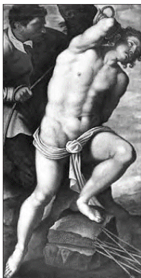
Иоанн Кантарини. Святой Себастьян. Картина исчезла в конце войны из хранилищ Потсдамского музея, но недавно была продана на аукционе Сотбис за 600 000 фунтов

Герр Вермуш поинтересовался, сколько всего картин о святом Себастьяне написал Кантарини. Оказалось, две – одна из них в Венеции. Две фотографии. На одной – картина из Бременского музея, якобы сгоревшая. На другой – проданная через аукцион Сотбис. Хорошо видно, что отличаются они только повязкой на бедре фигуры святого, и вполне очевидно – дорисованной позже, для маскировки. Имя покупателя аукцион сообщить отказался.