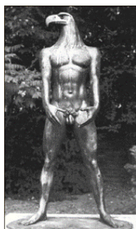
Образец нового арийского искусства. «Настоящий ариец»

31 марта 1936 года эти конфискованные произведения искусства были представлены на специальной выставке «дегенеративного искусства» в Мюнхене. Эффект оказался обратным: огромные толпы народа стекались, чтобы полюбоваться на творения, отвергнутые Гитлером. Проходившая одновременно по соседству «Великая германская художественная выставка», на которой было выставлено около 900 работ, одобренных Гитлером, привлекла куда меньшее внимание публики. Чтобы поощрить «истинных германских художников», Гитлер учредил несколько сотен премий.