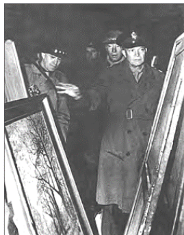
Генералу Эйзенхауэру показали, что было спрятано в соляной шахте Меркерс