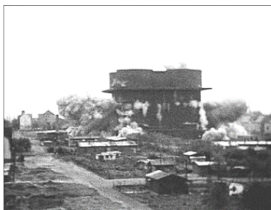
Берлин, 1945 год. Подрыв башни Фридрихсхалле, после которого исчезла ценнейшая коллекция из 400 картин