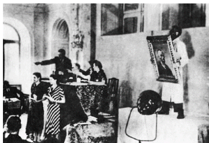
Один из аукционов по продаже картин «дегенеративного искусства» в Швейцарии. Выставлен автопортрет Ван Гога

силу законов. Любой мог быть исключен за «политическую неблагонадежность». Для художников существовал целый ряд ограничений: лишение права на преподавательскую деятельность, права выставаться и права заниматься живописью. Агенты гестапо совершали молниеносные рейды по студиям художников. Владельцам художественных салонов и магазинов раздавали списки опальных художников и запрещенных к продаже произведений искусства. Многие известные германские художники оказались в изгнании. Пауль Клее вернулся в Швейцарию, Кандинский уехал в Париж и стал французским подданным, Оскар Кокошка, чей неистовый экспрессионизм особенно раздражал Гитлера, перебрался в Англию и принял британское гражданство, Георг Гросс эмигрировал в США, Макс Бекман обосновался в Амстердаме.