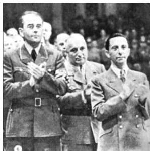
Альберт Шпеер (слева) и Йозеф Геббельс (справа) возмущались варварством гауляйтера Польши и Украины Эриха Коха