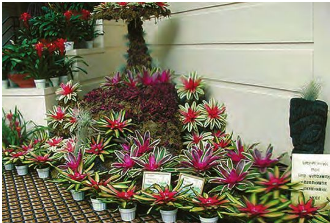
Композиция из бромелий с яркими листьями

В то же время среди их близких родственников криптантусов и тилландсий есть виды, имеющие размер, измеряемый считанными сантиметрами. Самые миниатюрные растения – из рода Тилландсия. У некоторых тилландсий розетки настолько малы (в диаметре всего несколько миллиметров), что растения могут быть приняты за мхи.