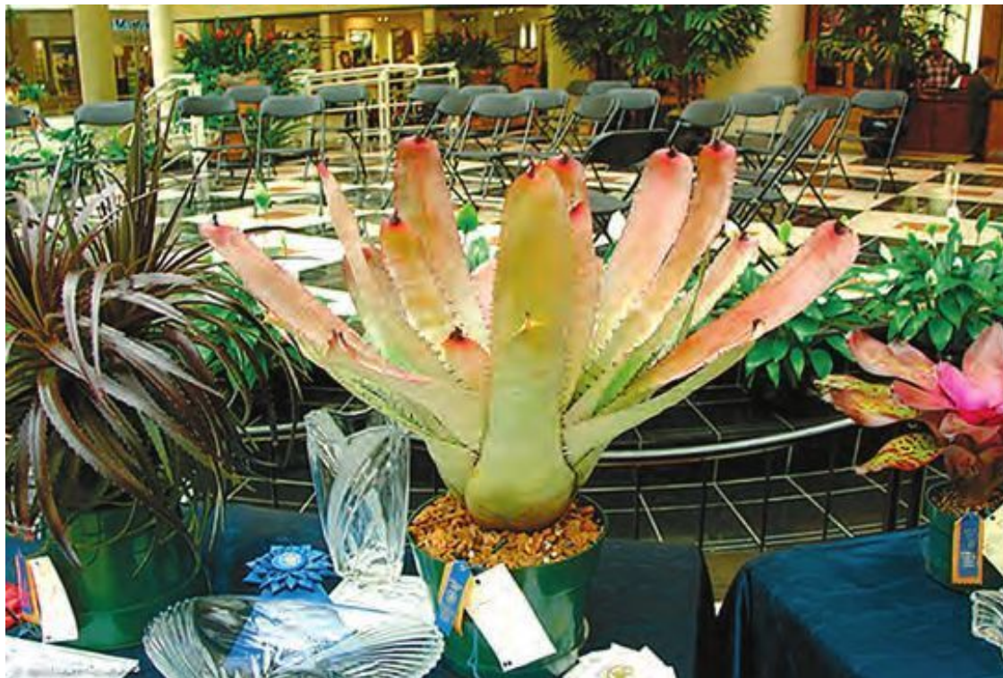
Эпифитные бромелии на выставке

Родина бромелиевых – тропики, и именно оттуда они приносят нам частицу вечного лета. А когда за окном мрачный осенний или зимний пейзаж, особенно приятно, если дома вас встречают сочная зелень и яркие соцветия любимых комнатных растений.