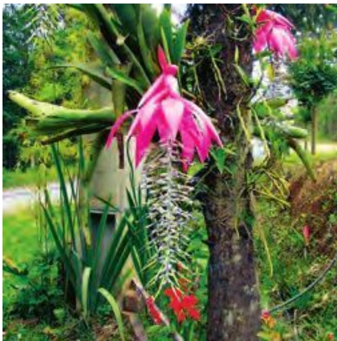
Эпифитные бромелии в природе