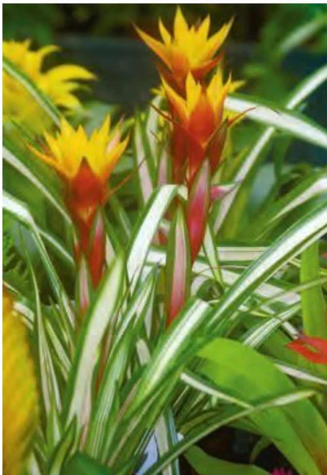
Яркие прицветники. Цветущая гусмания

Естественно, что любитель комнатных цветов ищет в них совсем другое. В бромелиевых для него привлекательна их декоративная роль. Бромелиевые относятся к самым красивым декоративным растениям. Их интересная листва и прежде всего яркая, иногда даже «кричащая», окраска цветков и листьев делают их чрезвычайно привлекательными для любителей декоративного цветоводства.