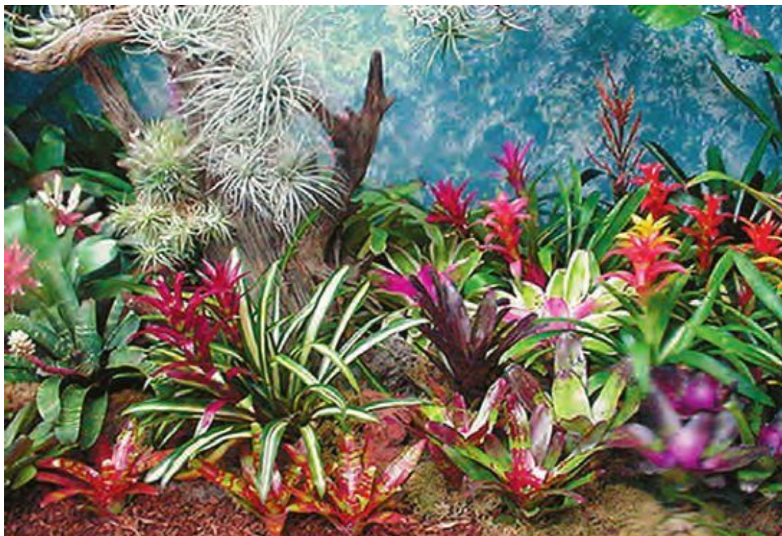
Бромелии в оранжерее

Выдающимся событием этого времени стало появление книги Д. Бэкера (Baker J.G., Handbook of the Bromeliaceae , 1889). В этом фундаментальном издании автор дал подробное описание около 800 видов бромелиевых, однако большинство из них составили бразильские, так как эта страна посещалась ботаниками наиболее часто. В Германии в 1896 году была опубликована монография известного ботаника К. Меца, где описано 997, а во втором издании (1935 года) – 1615 видов ( Bromeliaceae . In: Engler A. Das Pflanzenreich . Leipzig).