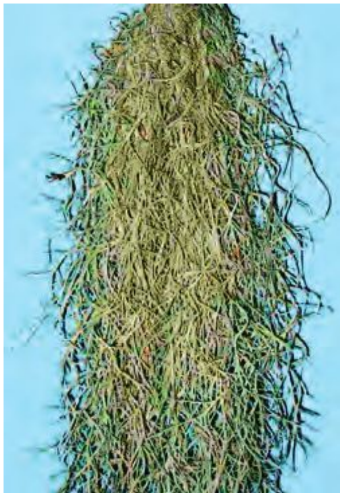
Тилландсия уснеевидная (испанский мох)

Но если корневая система работает слабо, за счет чего развивается вегетативная масса эпифитных бромелий?