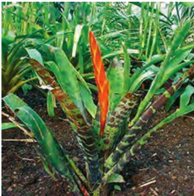
Наземные бромелии в природе

Корневая система наземных бромелиевых поглощает воду и питательные вещества и закрепляет растения в почве. К наземным относятся многие популярные комнатные и оранжерейные растения: ананас крупнохохолковый ( Ananas comosus ), криптантус ( Cryptanthus ), диккия ( Dyckia ) и гехтия ( Hechtia ). Они имеют хорошо развитую корневую систему, толстые мясистые листья, служащие хранилищами воды в период засухи, и произрастают на достаточно богатых гумусом почвах.