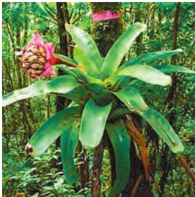
Эпифитные бромелии в тропическом лесу

Но все вопросы – ответы в порядке поступления. Тема требует нескольких слов общей информации, без которой не обойтись. Что же такое – бромелиевые, чем они так знамениты и почему заставляют неровно биться сердца цветоводов?