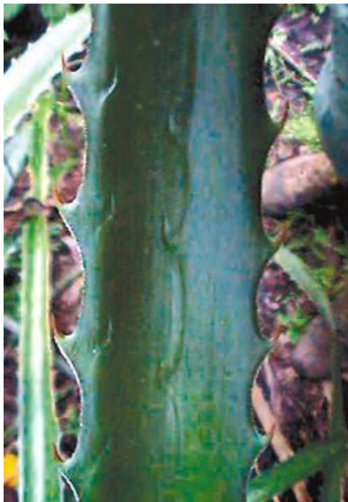
Лист бромелии имеет шипы по краям