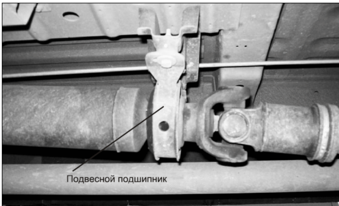
Рис. 1.3. Длинный карданный вал с подвесным подшипником

На большинстве современных автомобилей применяется переднеприводная схема установки агрегатов и узлов: двигатель расположен спереди поперек автомобиля, агрегаты и трансмиссия также расположены спереди. В этом случае трансмиссия передает крутящий момент передним колесам, которые одновременно являются ведущими и управляемыми. В результате такого расположения агрегатов можно существенно уменьшить их массу и высоту центра тяжести. Такими же преимуществами обладают автомобили с задним расположением двигателя и агрегатов трансмиссии, передающих крутящий момент задним ведущим колесам.