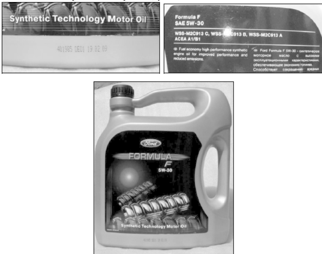
Рис. 1.4. Примеры маркировки и тары для масел

На этикетке моторного масла (рис. 1.4) указываются: