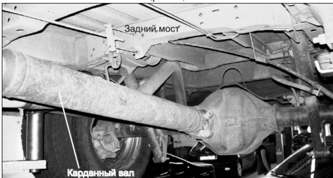
Рис. 1.2. Короткий карданный вал

Двигатель расположен спереди, вдоль оси автомобиля, ведущими колесами являются задние, для передачи крутящего момента к заднему ведущему мосту устанавливают карданный вал. Карданный вал может быть коротким, непосредственно соединяющим коробку перемены передач с задним мостом (рис. 1.2), либо длинным, имеющим промежуточный карданный вал, установленный на подвесном подшипнике (рис. 1.3).