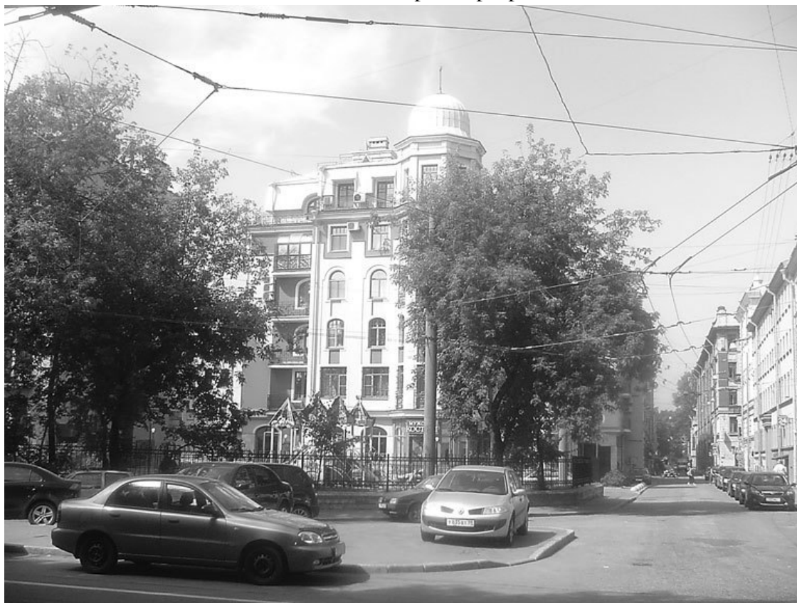
Бармалеева ул., 2

В 1880 г. на участке № 35, на углу Геслеровского переулка, по проекту архитектора И.Н. Иориса осуществлено строительство четырех каменных построек Дома милосердия. Он предназначался «для приучения к труду впавших в порок несовершеннолетних девушек и взрослых, изъявивших желание исправиться». В марте 1895 г. открылся приют для несовершеннолетних, рассчитанный на 50 девочек в возрасте от 10 до 18 лет. В нем было 10 комнат, домовая церковь, прачечная. Воспитанницы приюта получали религиозно-нравственное воспитание. Они стирали белье, готовили пищу, занимались огородничеством, всем тем, чтобы «из них получилась хорошая прислуга или хозяйка в сельском быту». Это был единственный приют в России подобного типа. В 1899 г. в Доме милосердия призрелись 53 девочки и 42 женщины.