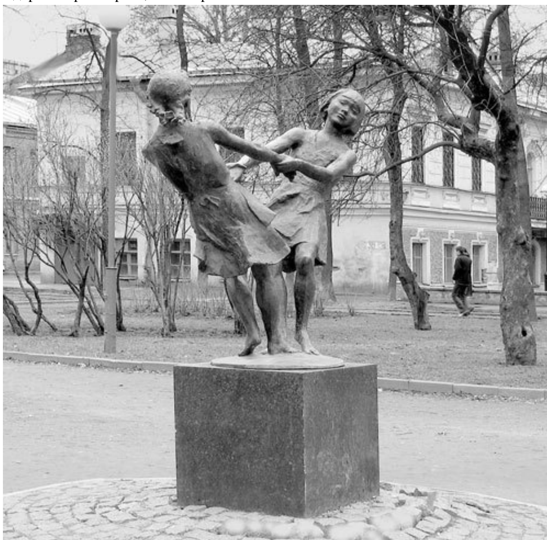
Скульптура «Танцующие девочки» в Аникушинском сквере