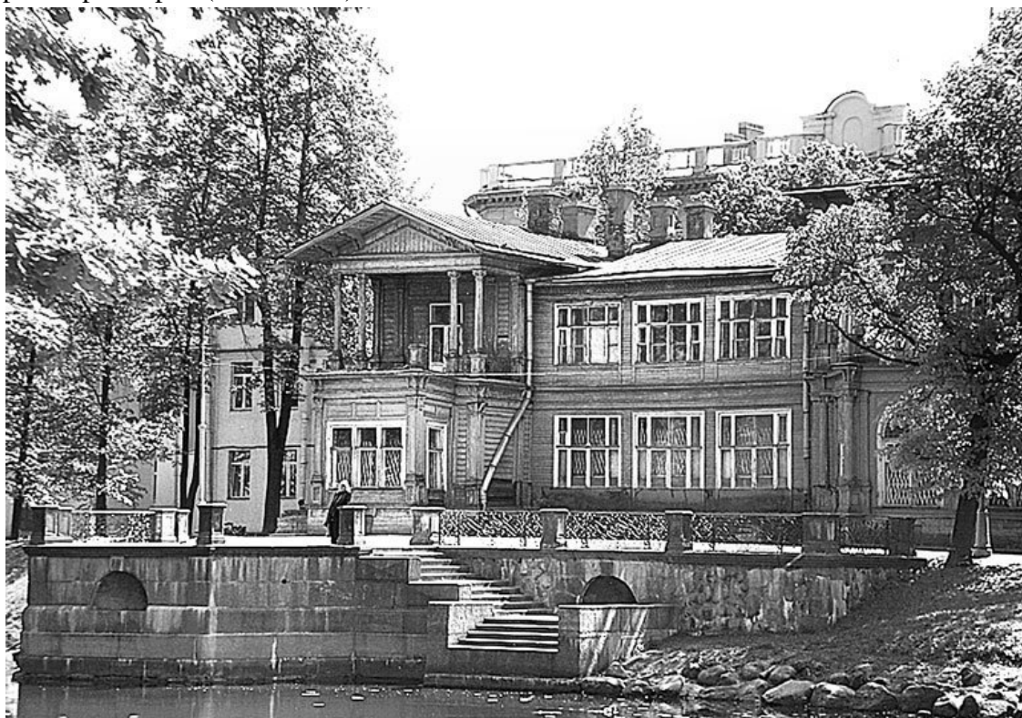
Дача Громова в Лопухинском саду

Для него построили сохранившуюся до нас двухэтажную зимнюю дачу (дом № 13), бревенчатую, обшитую вагонкой, на каменном подвале. Она возведена в 1850-х гг. по проекту академика архитектуры Е.И. Винтергальтера. Другой академик архитектуры А.М. Горностаев построил оранжерею (дом № 13а).