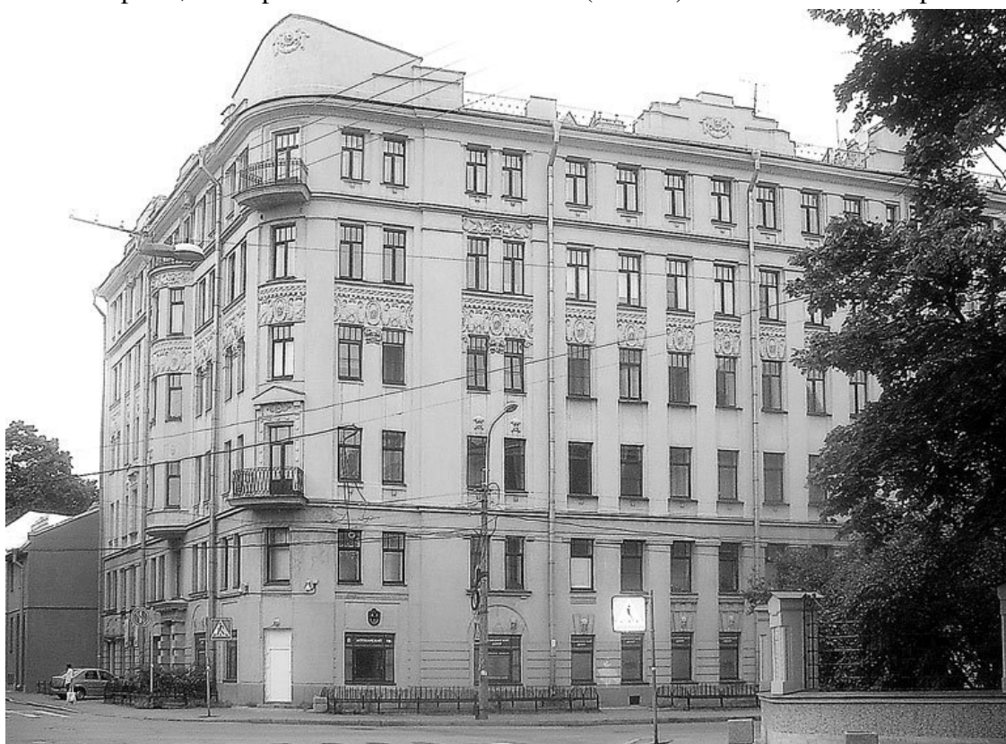
Аптекарский пр., 8

В этом же доме в 1912 г. жил профессор Электротехнического института (1911–1917 гг.) С.П. Тимошенко, специалист в области механики твердых деформируемых сред. Он – автор 35 книг (учебников, монографий, мемуаров). С.П. Тимошенко являлся членом многих академий Европы и Америки, иностранным членом АН СССР (1928 г.). С 1962 г. жил в Германии.