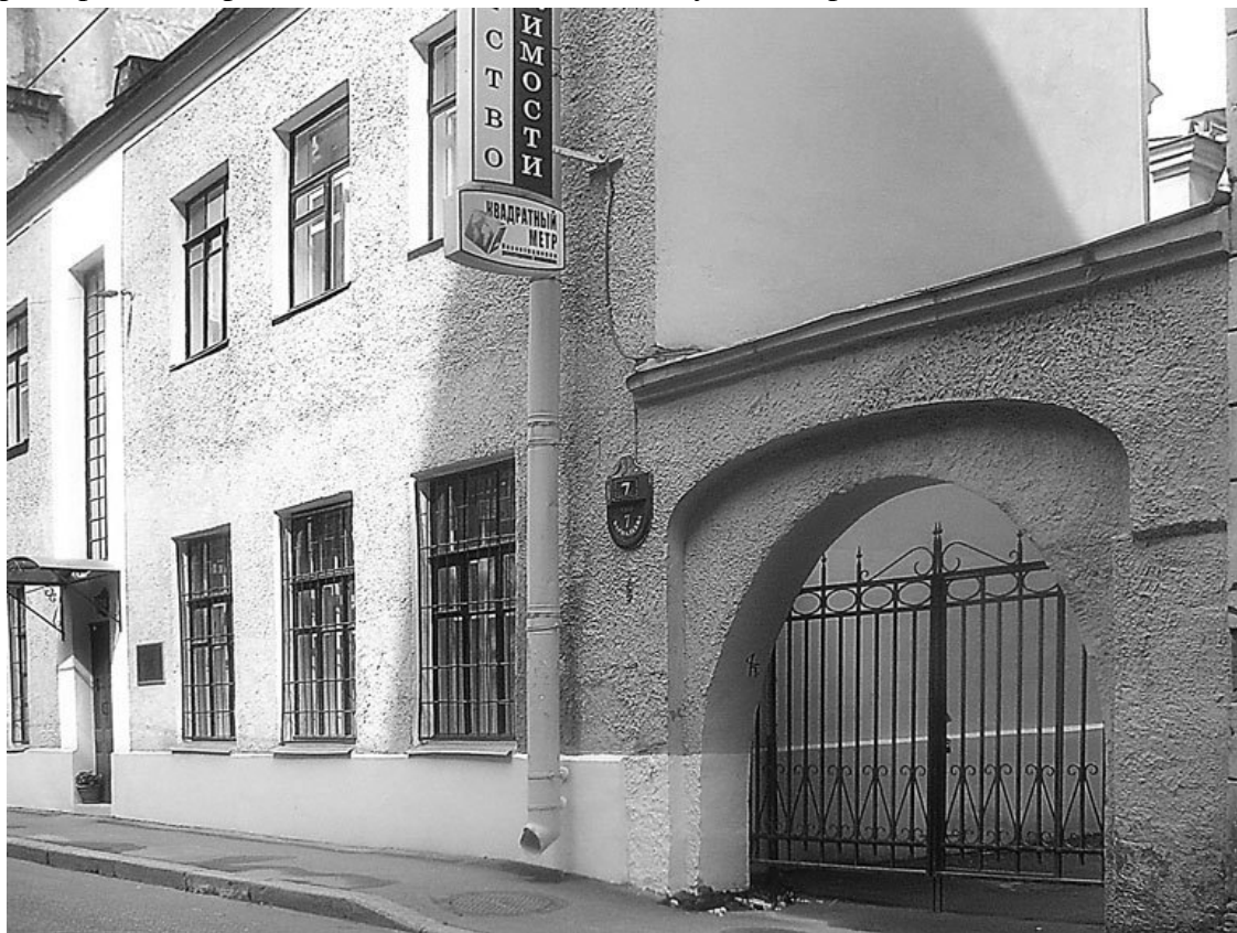
Бармалеева ул., 7