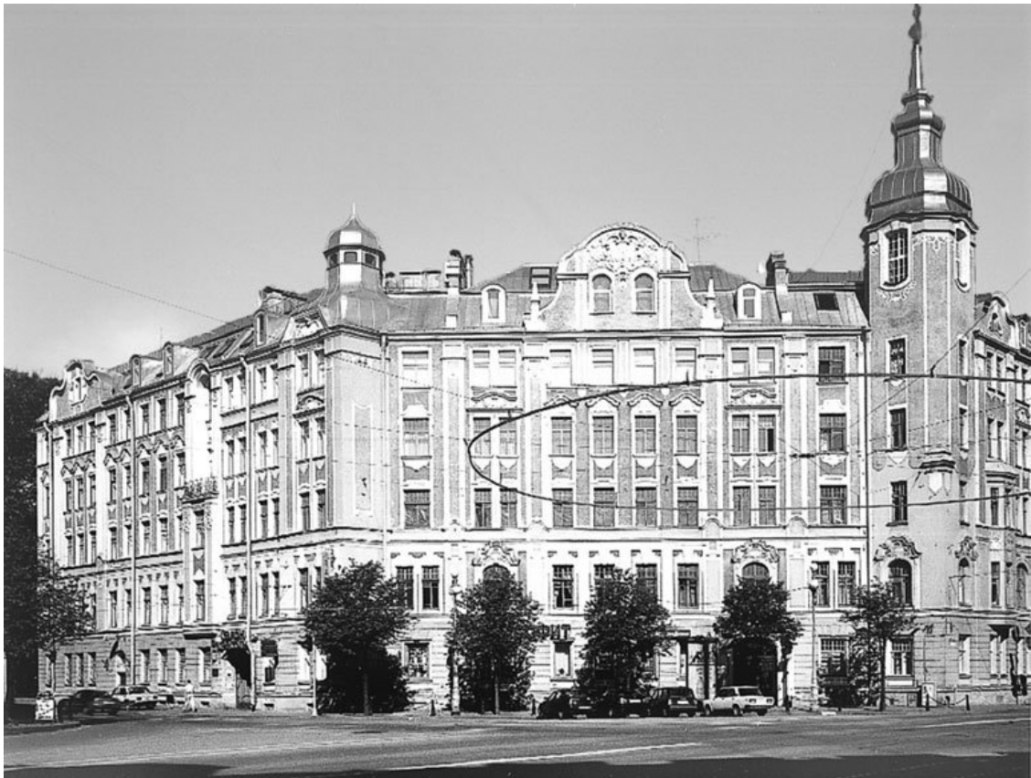
Один из домов на Австрийской площади (Каменноостровский пр., 20)

Первоначально площадь имела дугообразные очертания угловых участков. Планом Петербурга 1880 г. были определены «красные линии» примыкающих зданий, фактически урегулированные в конце 1890-х гг. Тогда же она стала многогранной. Площадь оставалась безымянной.