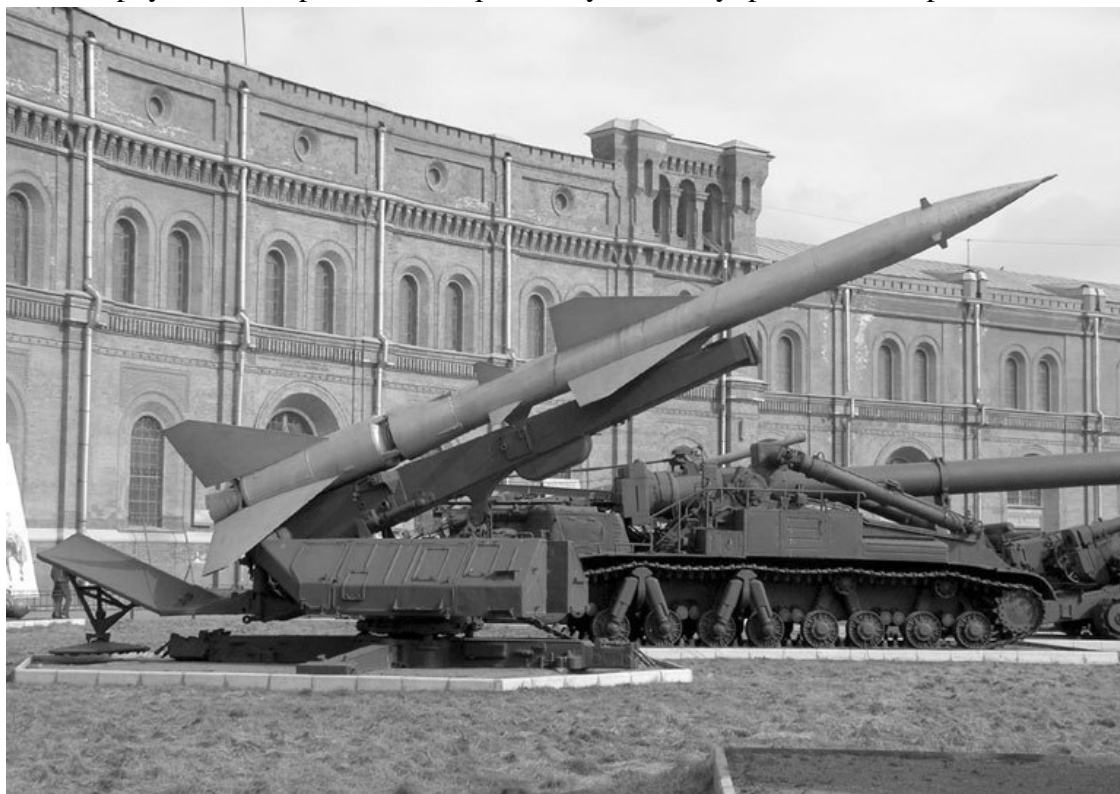
Около Музея артиллерии

В 1920-е гг. музею переданы фонды 27 полковых музеев русской армии, содержавшие свыше 5 тысяч знамен, 700 единиц холодного и огнестрельного оружия, 12 тысяч акварельных рисунков. Вернулись и сохранившиеся фонды музея, эвакуированные в Ярославль.