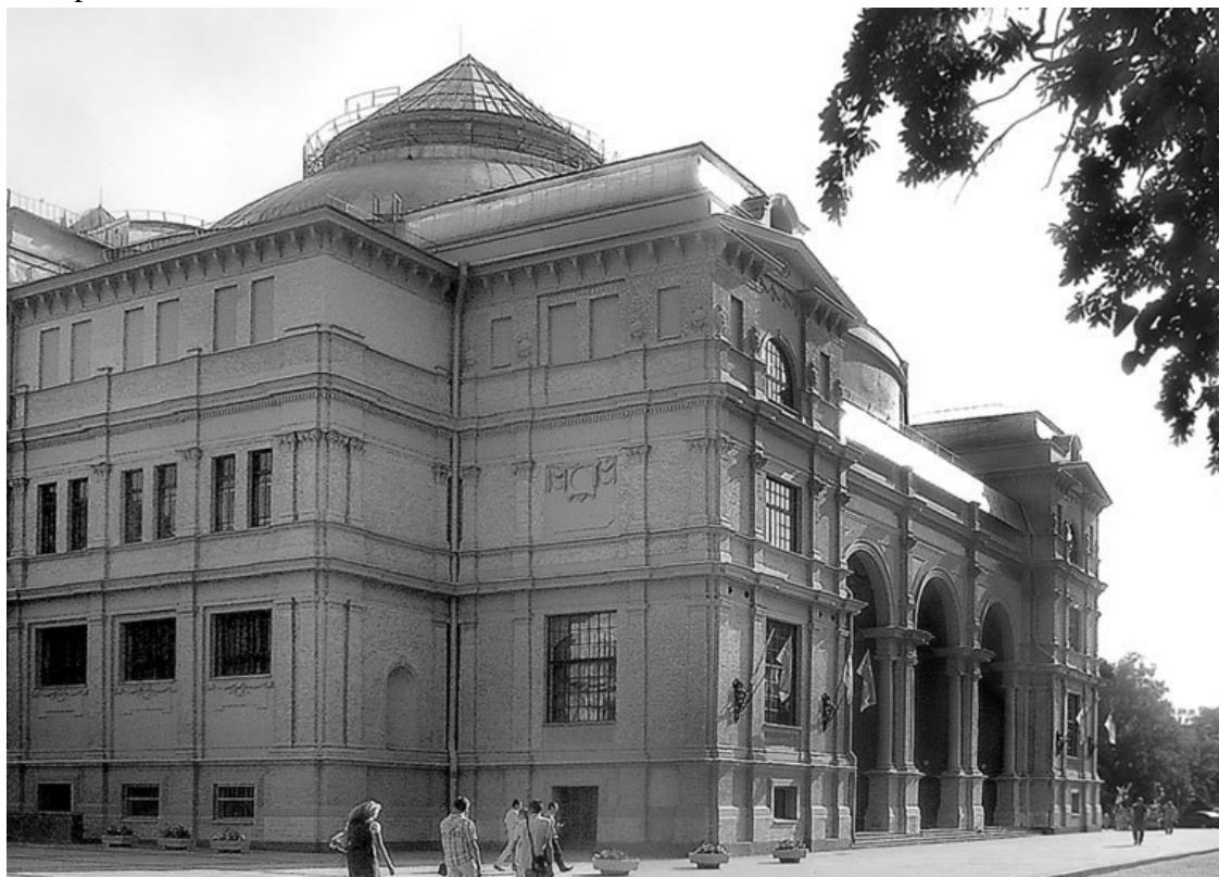
Бывший Народный дом императора Николая II

шла вдоль Кронверкского канала до Мытнинской набережной. Небольшой паровоз мощностью 12 лошадиных сил тащил за собой по рельсам три вагона, в каждом из которых ехали 18 детей или 12 взрослых.