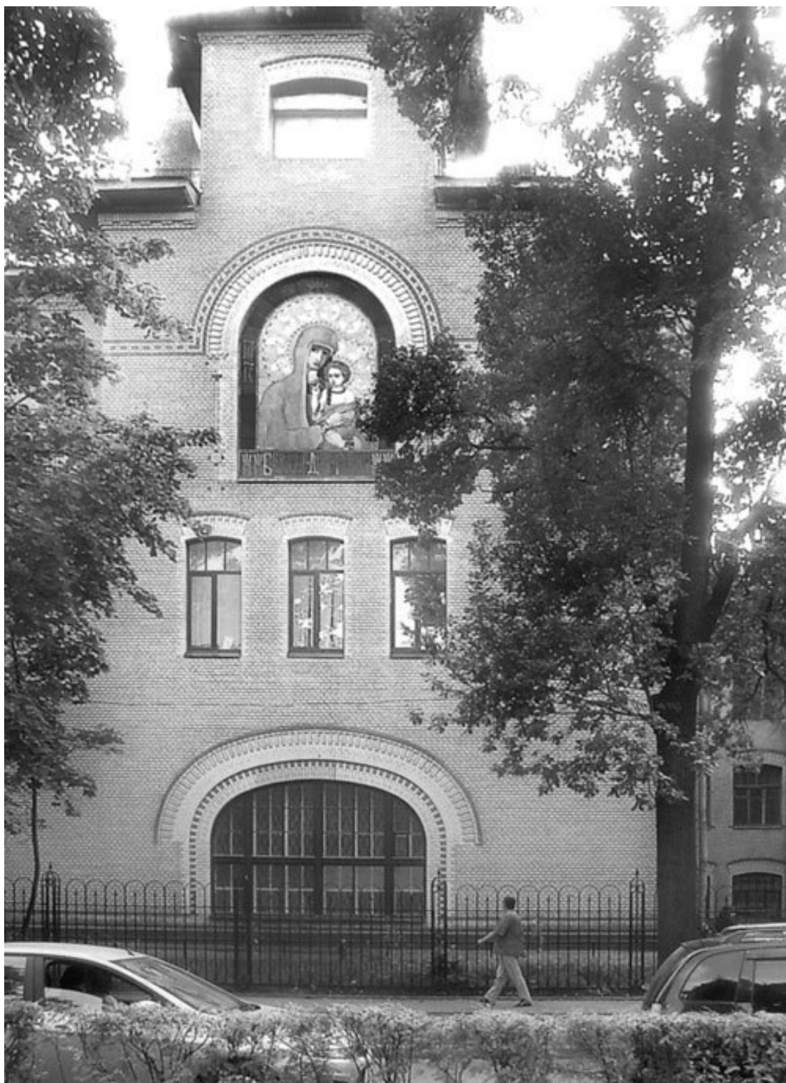
Центральная часть фасада здания Ортопедического института с майоликой К.С. Петрова-Водкина

Устройство больницы отличалось высоким уровнем комфорта, соблюдением всех гигиенических требований. Уровень земли под постройку для защиты от наводнений был повышен на полтора метра. Здание облицовано долговечными прочными материалами Цоколь выполнен из серого сердобольского гранита. Стены выложены белым матовым кирпичом.