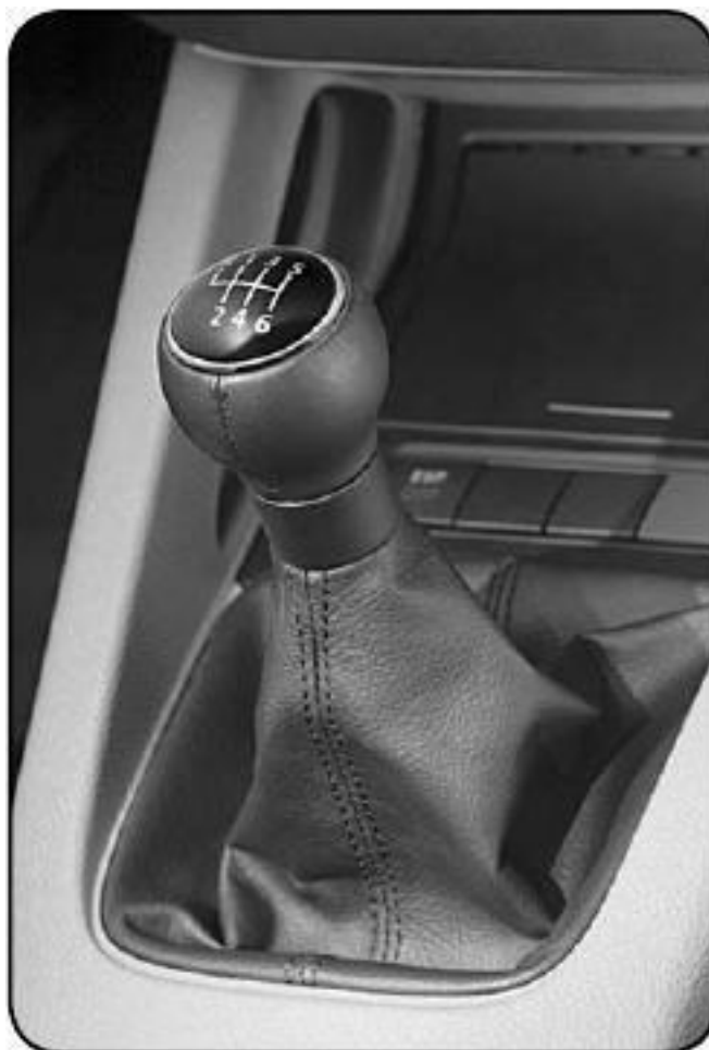
Рис. 1.1. Сегодня уже выпускаются автомобили с 6-ступенчатой коробкой передач

Напомним, что с помощью педали сцепления осуществляется включение и выключение сцепления. Данный механизм представляет собой устройство, которое с помощью силы трения осуществляет передачу крутящего момента от двигателя автомобиля через коробку передач к ведущим колесам (рис. 1.2). Главной задачей сцепления является кратковременное отключение двигателя от коробки переключения передач, а также плавное соединение этих агрегатов при работающем двигателе.