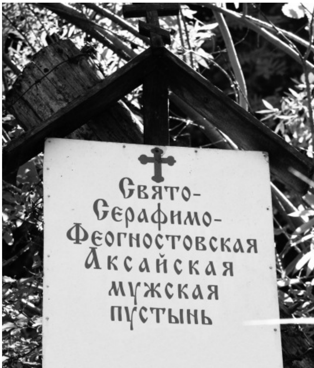
У входа в Свято-Серафимо-Феогностовскую Аксайскую мужскую пустынь.