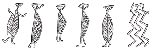
Рис. 4. Фигурки, вырезанные на кости из Рюемаркгорда, о. Зеландия, Дания. Высота – около 2,6 см. Хранятся в Национальном музее Копенгагена

людей с капюшонами, а на обрыве в Рёдее был найден рисунок, на котором изображен мужчина в рогатом головном уборе, стоящий на лыжах. Это вполне могло быть изображение шамана, отправившегося в сверхъестественное путешествие.