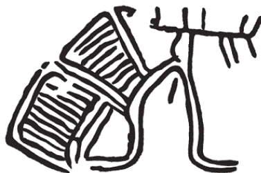
Рис. 3. Чертеж, изображенный на скале в Аусевике, Норвегия (по Хагену)

Шмидт считал, что на второй стадии религиозного развития основную роль играют организованные церемониальные действия, которые характерны для более крупных социальных образований. На этом этапе члены каждой семьи уже не отправляют ритуалы – этим занимаются выделившиеся в отдельный слой населения шаманы и их помощники. Шаман был больше магом, чем жрецом, он должен был обладать определенным даром и проводить время в совершенствовании своего мастерства и медитации. Только таким образом он мог стать посредником между людьми и сверхъестественными силами. Он мог входить в транс, заставляя свой дух открывать сокровища, лечить больных, вступать в мир мертвых и возвращаться обратно к людям, сражаться со злыми силами и смягчать гнев духов. Одной из наиболее явных особенностей шаманов по всему миру является их тесная связь с миром животных, выраженная в одежде, ритуалах и вере в то, что духи животных могут помогать или мешать им.