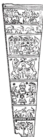
Рис. 5. Колчан с рельефом. Кух-и-Дашт. Метрополитен-музей, Нью-Йорк. Высота – 21 дюйм.

Как свидетельствуют дошедшие до нас немногочисленные литературные произведения касситов, дополненные массой теофорических имен собственных, они поклонялись богам солнца и войны «Ригведы», Сурье и Маруте, Бурье, богу бури, и, возможно, ведийскому Индре, также упоминаемому в митаннийских текстах. Они разделяли тройную иерархию божеств ранней ведийской религии (подразделявшихся на богов неба, воздуха и земли), которую позднее одухотворил зороастризм. Луристанская бронзовая пластина с колчана из Кух-и-Дашта с ее тремя полосами, изображающими божественные фигуры, очевидно, должна иллюстрировать эту концепцию (рис. 5). Боги-близнецы на верхней полосе (небо) – вероятно Митра (Митрас) и Варуна, тесно связанные верховные боги мирового устройства. Митра изображен со своим космическим быком, Варуна – с небольшим квадратным алтарем огня. Под ними на центральной полосе (воздух) находится Индра, глава ведийских марут, богов силы, бури и войны. Индру, как и в «Ригведе», здесь тоже сопровождают львы и хищная птица ( сенъя ), и, поскольку Индра равносителен богу войны и охоты Нинурте из аккадских текстов, чтобы продемонстрировать свою второстепенную роль бога охоты, он держит двух убитых козлов. На нижнем элементе композиции (земля) показаны близнецы-Насатьи, целители, восстановители здоровья и боги плодородия. Здесь они изображены в процессе омоложения старика Чьяваны, держащего свою новую, хорошо причесанную голову и собирающегося поместить ее на место.