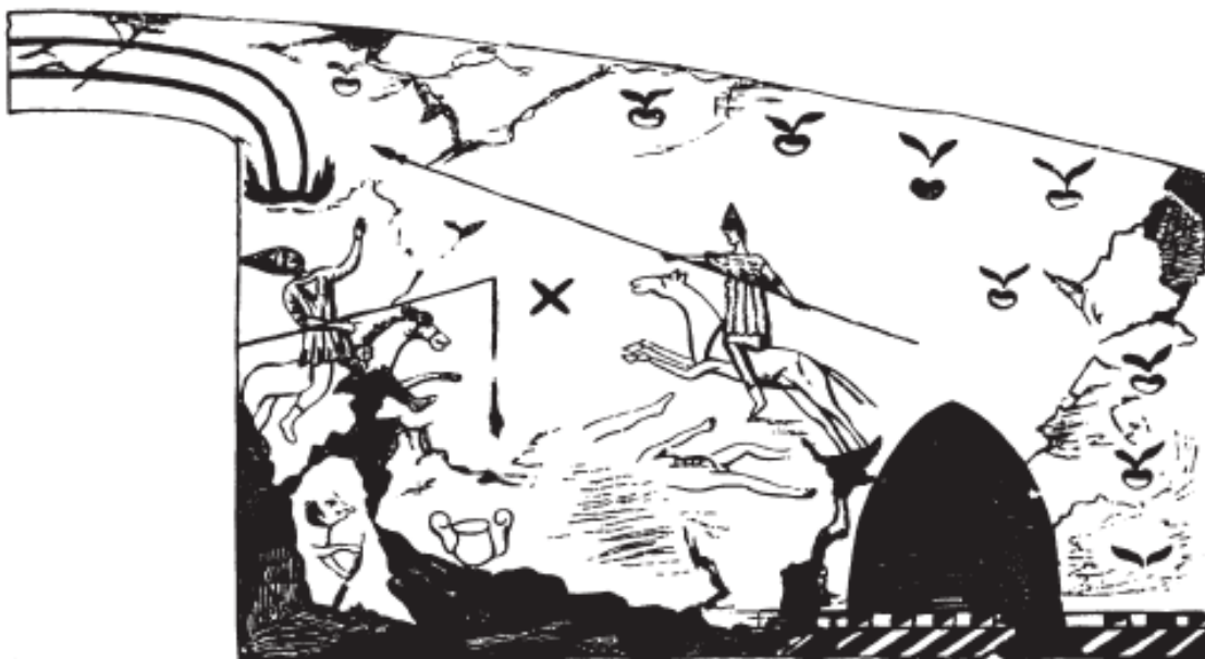
Рис. 5. Настенная роспись в катакомбном захоронении в Керчи (Пантикапее), изображающая сцену сражения

использовали шлемы и латы из сыромятной бычьей кожи, носили плетеные щиты, а в качестве оружия использовали копья, лук и меч». Также у них в ходу были лассо и пращи.