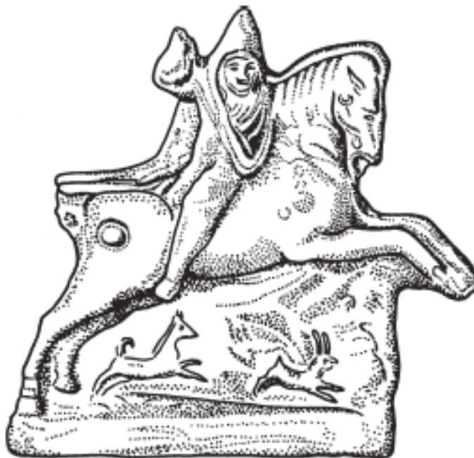
Рис. 2. Терракотовая фигурка из Керчи (Пантикапея), изображающая сармата верхом на коне, охотящегося на зайцев

Сарматы были жителями степей; большинство из них вело кочевой образ жизни, а их экономика основывалась на разведении скота. Страбон утверждает, что страна, где они обитали, была бедной и холодной: «Выдерживать такие суровые условия может лишь местное население, привыкшее на кочевой манер жить на мясе и молоке, но для людей из других племен это невыносимо». В некоторых местах, в окрестностях рек, сарматы занимались и возделыванием земли, но в значительно меньшей степени. Они также охотились на диких зверей и птиц.