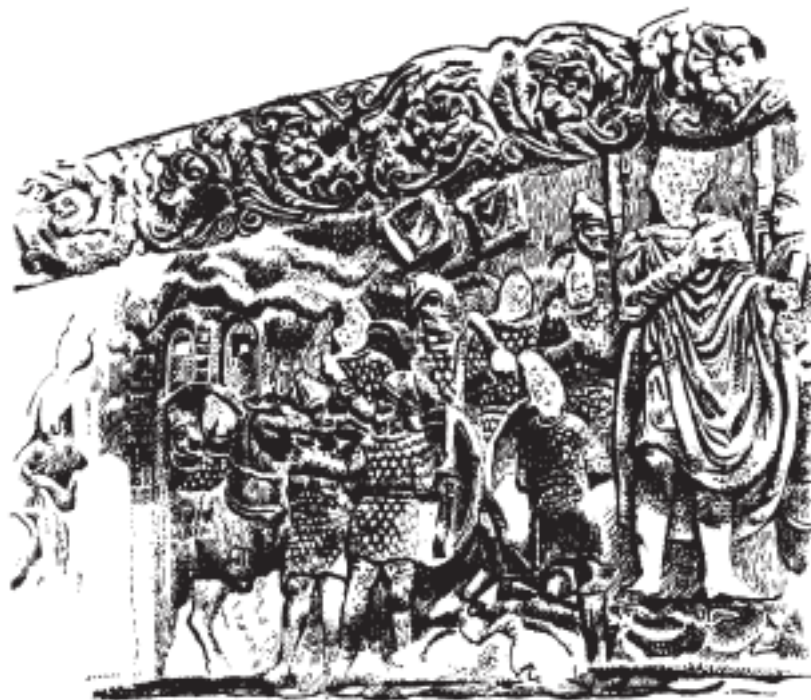
Рис. 6. Сарматы (роксоланы?) в чешуйчатых доспехах на барельефе арки Галерия в Салониках

Вооруженная кавалерия была известна ассирийцам, позднее ее переняли персы и скифы, а вслед за ними сарматы низовьев Волги. Ее распространение в Центральную Азию имело гораздо большее значение: к концу IV века до н. э. массагеты и хорезмийцы формировали специальные отряды тяжелой кавалерии и разработали тактику их использования в бою. Кавалерия сражалась в сомкнутом строю, и никто не мог ей противостоять. Освоение этой новой тактики полностью изменило способ ведения войны на востоке: легко вооруженные лучники были отчасти заменены бронированной кавалерией. Китайцы взяли эту новую тактику на вооружение, как и сарматы, в особенности роксоланы, за исключением, правда, языгов. В сарматский период формировались особые отряды тяжелой кавалерии, состоящие преимущественно из племенной знати. Облаченные в кольчуги сарматские воины, отступающие под натиском римлян, изображены на колонне Траяна. Сарматы на службе в римской армии, одетые в чешуйчатые доспехи, изображены на барельефе арки Галерия в Салониках. Благодаря сарматам подобная тактика получила распространение в Восточной и Центральной Европе, и даже римляне вынуждены были оснастить некоторые части подобным образом.