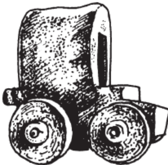
Рис. 3. Скифо-сарматская глиняная модель повозки кочевников, найденная в Керчи (Пантикапее)

Сарматы были жителями степей; большинство из них вело кочевой образ жизни, а их экономика основывалась на разведении скота. Страбон утверждает, что страна, где они обитали, была бедной и холодной: «Выдерживать такие суровые условия может лишь местное население, привыкшее на кочевой манер жить на мясе и молоке, но для людей из других племен это невыносимо». В некоторых местах, в окрестностях рек, сарматы занимались и возделыванием земли, но в значительно меньшей степени. Они также охотились на диких зверей и птиц.