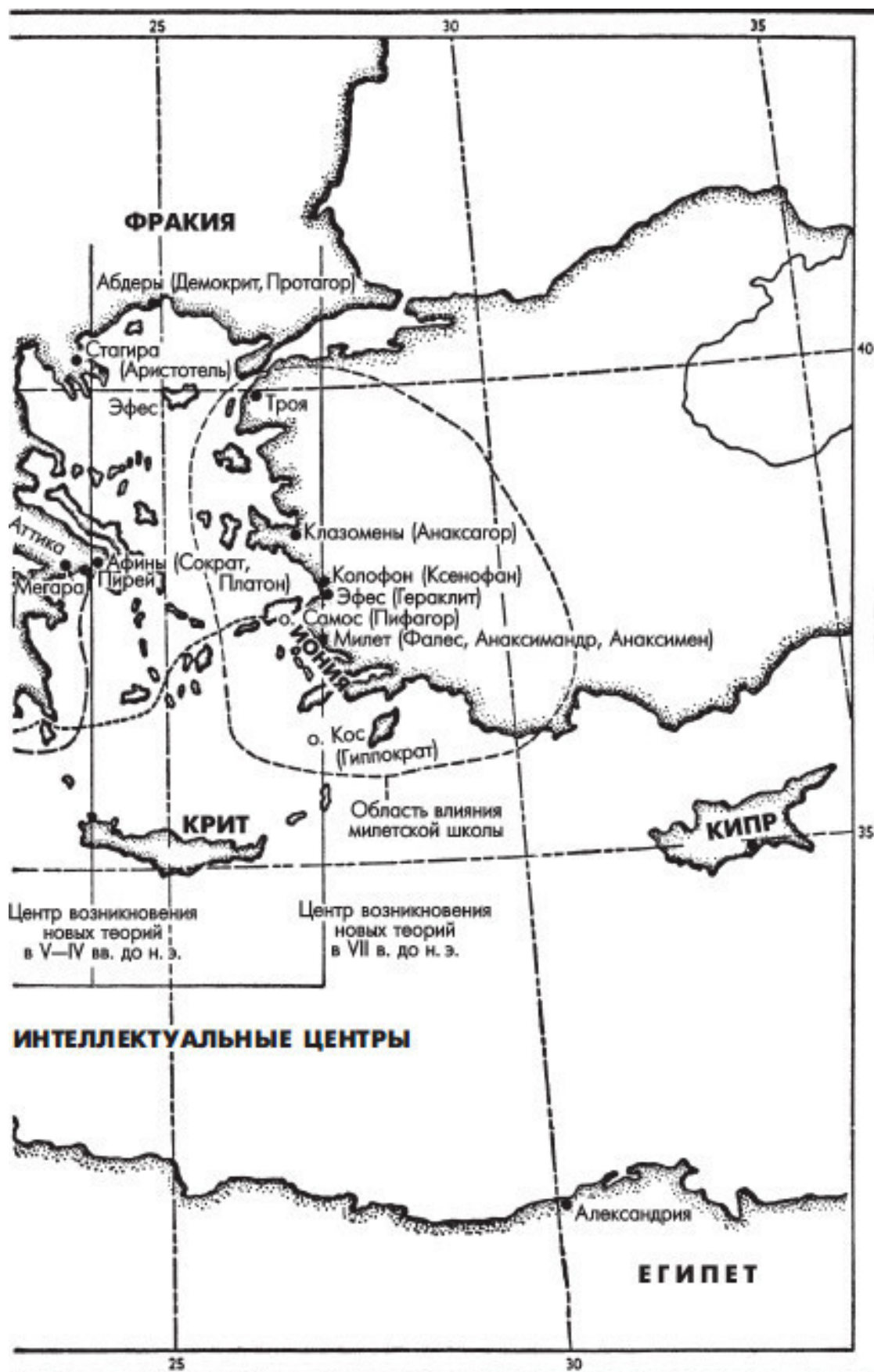
Центры греческой философии: Иония, Италия, Аттика