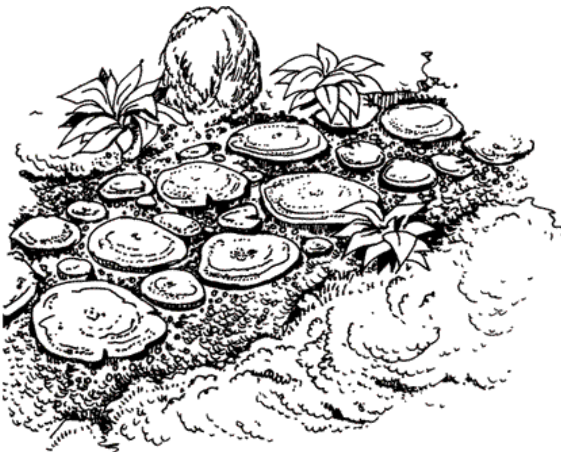
Рисунок 1. Деревянная дорожка

Часто встречаются на садовых участках и деревянные дорожки . Как правило, они сооружаются из стволов старых спиленных деревьев. Сначала для сооружения такой дорожки следует подготовить основу: выкопать канаву глубиной 20 см, насыпать в нее слой смеси гравия и песка толщиной 5 см, а затем выровнять его. После этого поверх подготовленной основы можно укладывать поперечные спилы стволов. Спилы должны иметь толщину примерно 15 см (рис. 1). Поверхность спилов нужно обработать наждачной бумагой с крупным зернением, затем уложить их на подготовленное основание. Спилы вдавливают в смесь песка и гравия, а пространство между ними засыпают этой же смесью до верха спилов, а затем выравнивают при помощи веника. Если некоторые спилы выступают, то нужно кувалдой заглубить их.