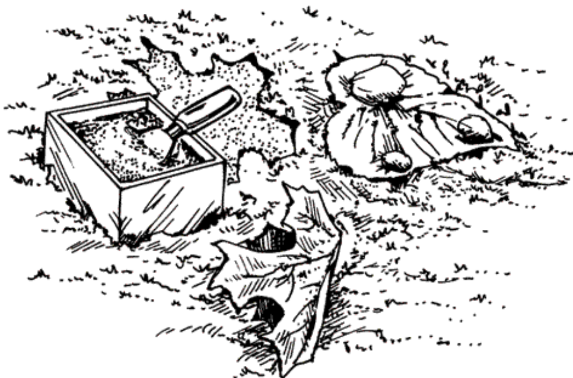
Рисунок 6. «Печать» листьев

Из чего только не делают дорожки садоводы с фантазией! Даже из подручного материала можно создать уникальный декор – например, садовую дорожку из пластиковых бутылок. Для этого бутылку обрезают наполовину и вкапывают дном вверх в землю на уровне поверхности земли.