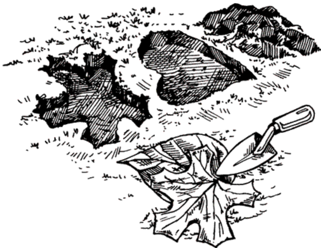
Рисунок 5. Подготовка поверхности почвы

Далее выложить в подготовленные углубления при помощи шпателя бетонную смесь, после чего к ней надо аккуратно приложить лист растения рельефной стороной вниз. Необходимо выбирать листья, несколько большие по размеру, чем подготовленные углубления. Для того чтобы узор прожилок лучше отпечатался на бетоне, можно поверх листьев положить какой-либо груз – например, камень или кирпич. Делать это нужно осторожно, так как груз может оставить отпечаток на еще не застывшем бетоне (рис. 6).