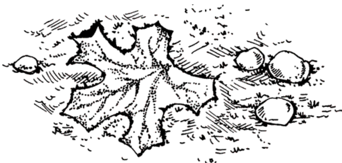
Рисунок 7. Отпечаток листа

После этого нужно дать бетонной смеси высохнуть, но следить за тем, чтобы бетон не высыхал слишком быстро, иначе он потрескается. Если стоит сухая и жаркая погода, пространство вокруг листьев надо время от времени поливать водой. Через 2–3 дня листья растений можно убрать (рис. 7).