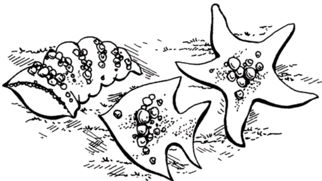
Рисунок 8. Подготовка шаблонов для «морской» дорожки

Перед тем как приступить к работе, следует приготовить шаблоны из картона нужной формы. Положитесь на свою фантазию – это могут быть морские звезды, ракушки, крабы и т. п. Далее к готовым шаблонам можно прикрепить при помощи двустороннего скотча морскую гальку или декоративные камешки, создав узор (рис. 8).