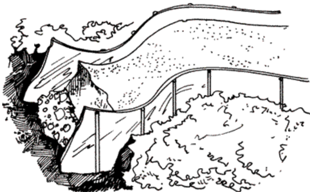
Рисунок 3. Металлическая опалубка

Вместо деревянной опалубки можно соорудить металлическую. Она состоит из пластин с присоединенными к ним кольщиками. Такие пластины гибкие и хорошо держат форму, они могут использоваться не только для создания изгибов дорожки, но и для сооружения прямых участков. Опалубку удаляют сразу после того, как затвердеет бетон (рис. 3).