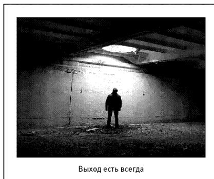
Выход есть всегда

Читай не торопясь и не стесняйся задавать вопросы: внимательный и мудрый учитель ответит тебе на них и поможет разобраться в самых сложных выводах.