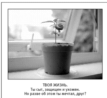
ТВОЯ ЖИЗНЬ. Ты сыт, защищен и ухожен. Но разве об этом ты мечтал, друг?

Почему мы никогда не удовлетворимся тем, что имеем, и нам всегда хочется еще и еще? Но, даже получив горячо и страстно желаемое, мы испытываем чувство неудовлетворенности. Хочется большего. Отчего так?