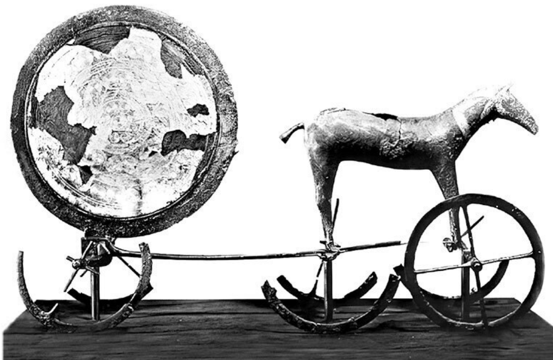
Колесница с солнечным диском из Трундхольма в Дании.

Правда, у германцев это была поначалу странная, на современный взгляд, алчность. Археологи находят драгоценную римскую посуду... в погребениях германских вождей. Золото и серебро ценится в загробном мире больше, чем при жизни (если верить Тациту). В последующие века богатства приносятся в жертву в традиционных германских и скандинавских святилищах – убивают людей (пленных?), скот, массу ремесленных изделий, оружия, украшений из золота и серебра, культовых (вотивных) изображений бросают в озера (ставшие болотами). Оружие найдено намеренно поврежденным – поломанным на куски или изогнутым (об этой порче жертвенных предметов рассказывал Орозий).