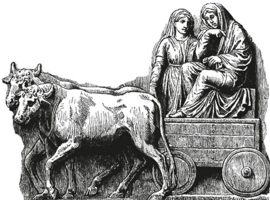
Германцы. Римский рельеф. На римском рельефе изображена кочующая германская семья

Младший современник Цезаря и Августа великий античный географ Страбон дает сходное описание быта германских племен, многие из которых он уже знает по именам – ведь столкнувшись с римлянами, они стали вести с ними непрерывные войны. Военский обычай германского племени кимбров Страбон посчитал достойным описания в своей «Географии» (Книга VII. II. 3). «Передают, что у кимбров существует такой обычай: женщин, которые участвовали с ними в походе, сопровождали седовласые жрицы-прорицательницы, одетые в белые льняные одежды, прикрепленные (на плечах) застёжками, подпоясанные бронзовым поясом и босые. С обнаженными мечами эти жрицы бежали через лагерь к пленникам, увенчивали их венками и затем подводили к медному жертвенному сосуду вместимостью около 20 амфор; здесь находился помост, на который восходила жрица и, наклонившись над котлом, перерезала каждому поднятому туда пленнику. По сливаемой в сосуд крови одни жрицы совершали гадания, а другие, разрезав трупы, рассматривали внутренности жертвы и по ним предсказывали своему племени победу.»