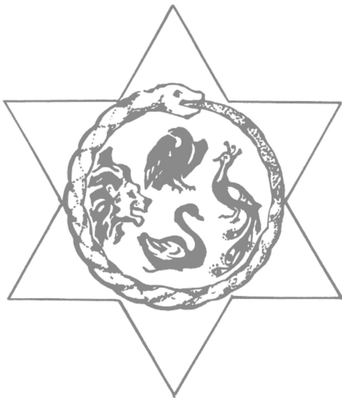
Рисунок 4. Гексаграмма с четырьмя зверями

В шестиконечной звезде расположен кольцом поедающий себя змей, а в этом кольце орел, павлин, лебедь и лев. Поедающий себя змей – это «солнечное колесо», олицетворяющее непреходящую жизненную силу. Птицы символизируют связь небесного и земного, в то же время каждая из птиц имеет свое значение: лебедь – честное богатство; орел – отвага, сила, богатство, величие; павлин – гордость и процветание. Лев – символ энергии, силы и упорства (рис. 4).