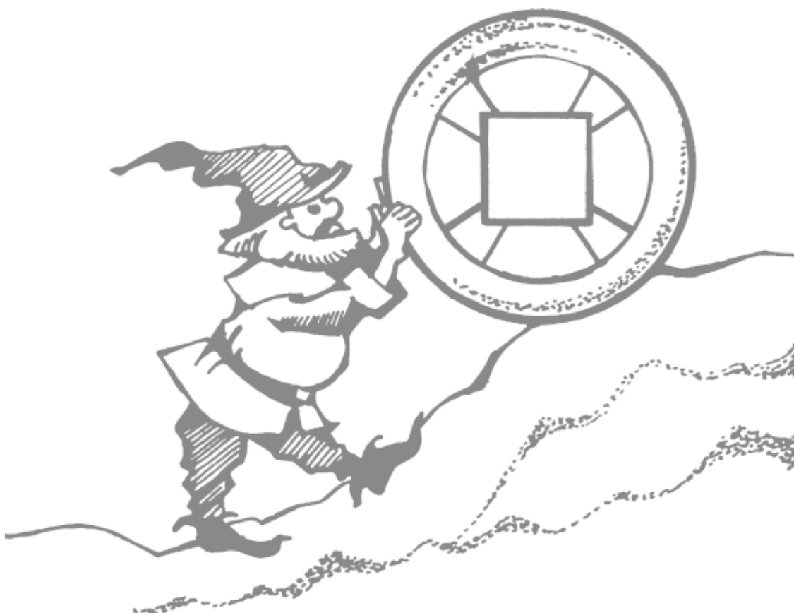
Рисунок 5. Гном, катящий колесо

Применять и усиливать энергию символа можно с помощью следующих аффирмаций: