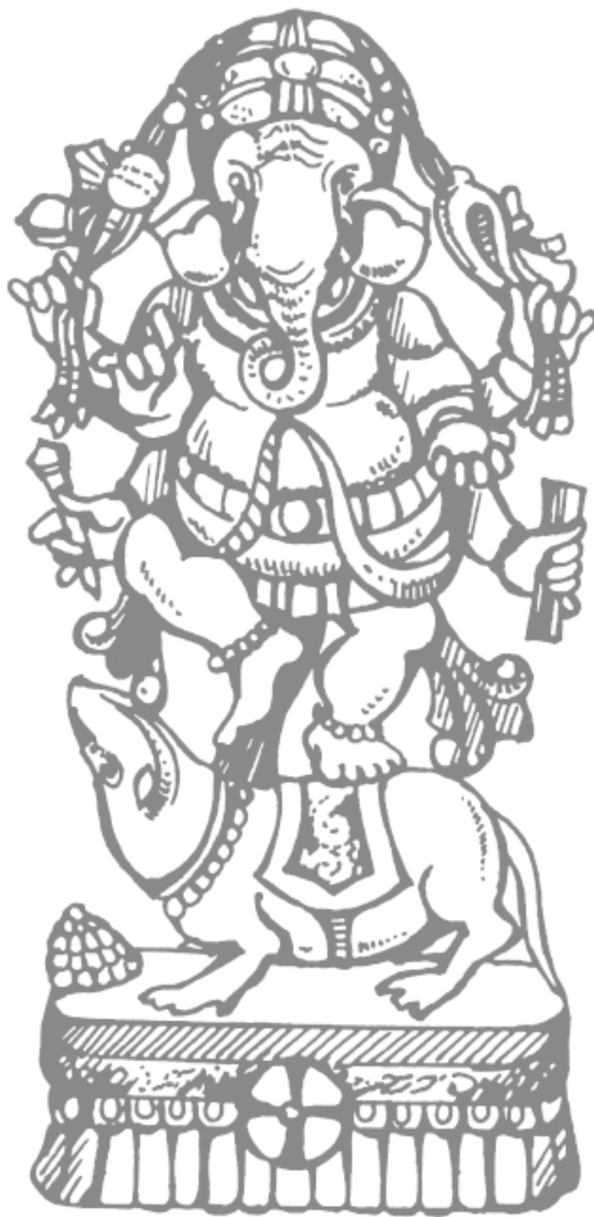
Рисунок 3. Ганеша