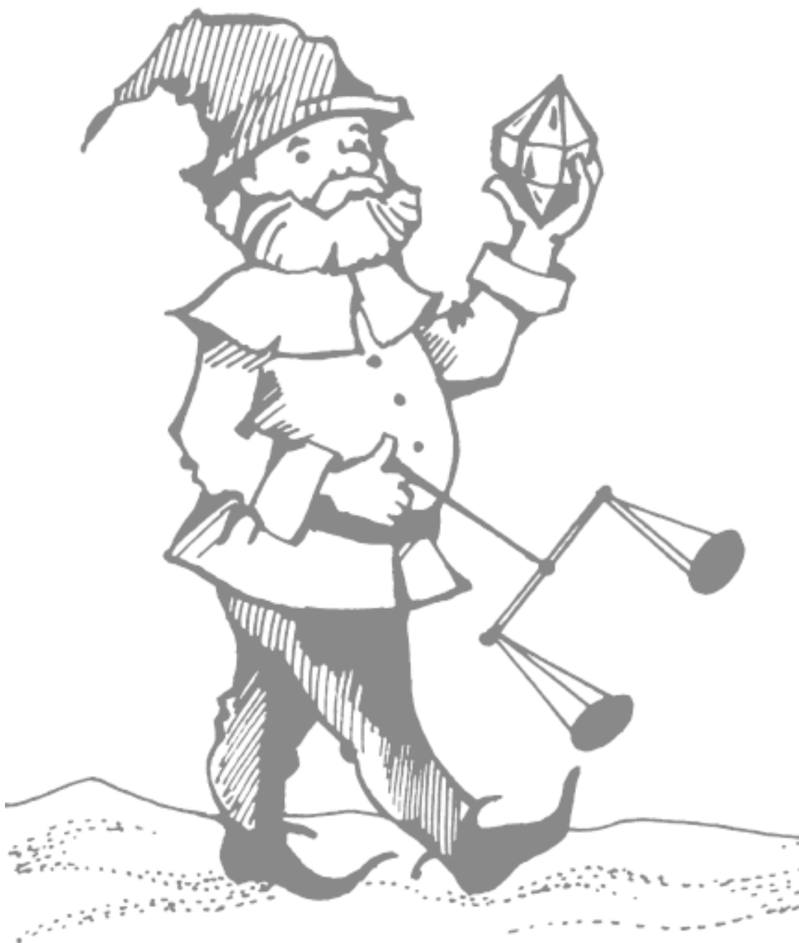
Рисунок 6. Гном с весами и алмазом

Упражнения для высвобождения энергии символа помогают настроиться на получение финансовых благ, развитие материальной сферы жизни. Это своего рода медитация, не имеющая ничего общего с колдовством.