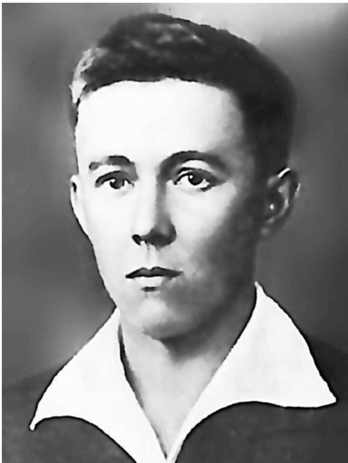
Студент заочного отделения Московского института истории, философии и литературы Александр Солженицын. 1939 г.

«Что дороже всего в мире? Оказывается: сознавать, что ты не участвуешь в несправедливостях. Они сильнее тебя, они были и будут, но пусть – не через тебя» (Александр Солженицын)