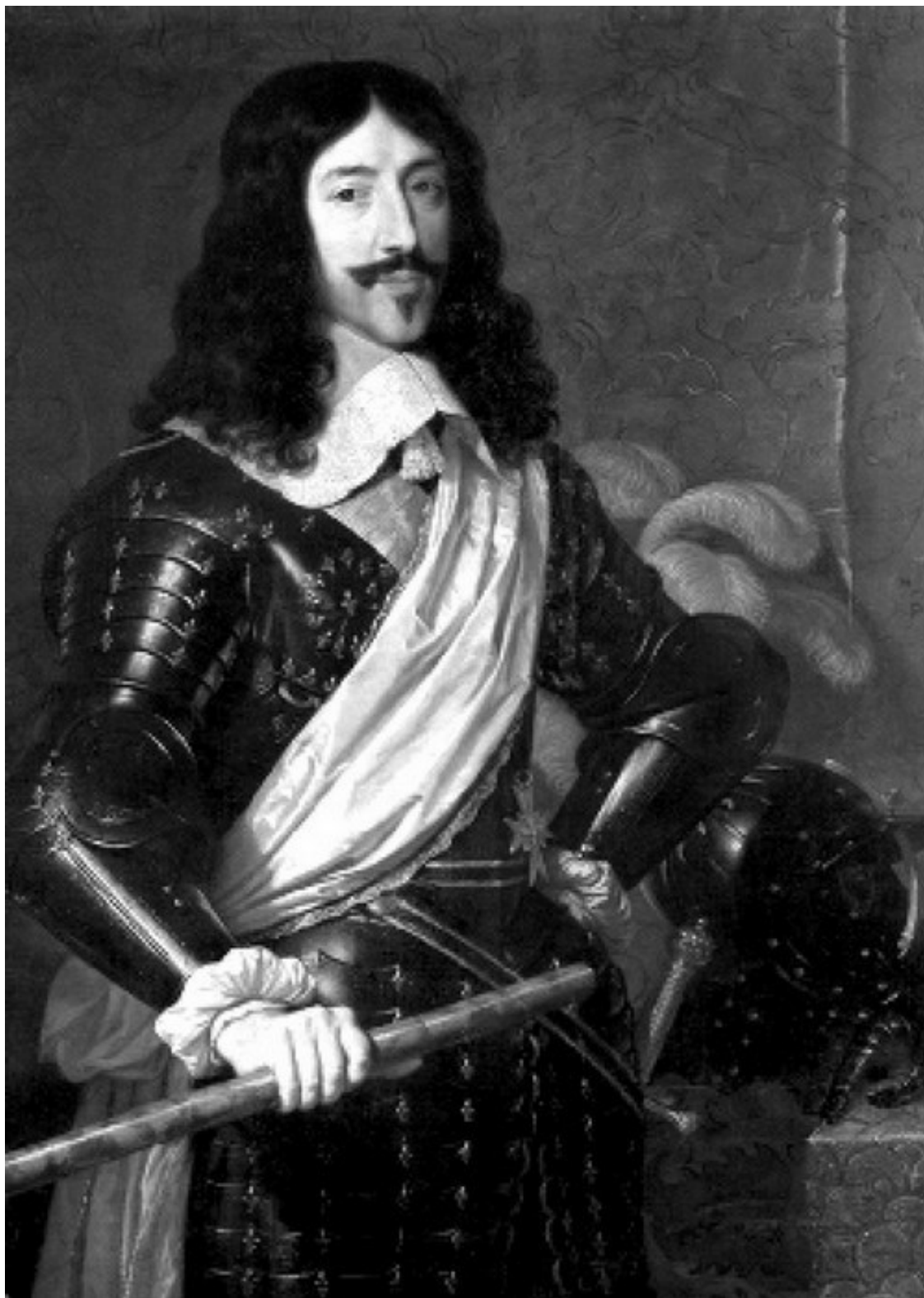
Король Людовик XIII

Всегда вольные в речах, парижане стали без стеснения говорить, что «каждый раз, когда Мазарини пускает в ход свою «пипку», он потрясает устои государства».