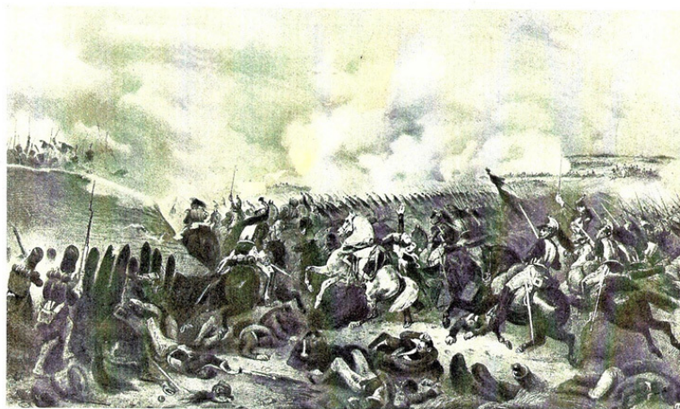
Bataille de la Moskowa.