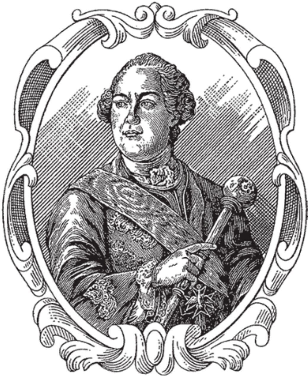
Гетьман Кирило Григорович Розумовський.

Ххха!.. А танцювати й фехтувати навчений?! Авжеж!!! Який же це, даруйте, граф з нього виходить, якщо без танців та фехтування?! Як же інакше на балах або, скажімо, на дуелях поводитися, що робити накажете, якщо танці та двобої не опанувати?! Так, він – кращий!!! І недарма через нових своїх знайомих до самої мадемуазель Фіфі в її модний салон потрапив!!! Ах, мадемуазель Фіфі – це... Це щось!.. Зате як запалює, як кров у жилах після цього грає!.. Вона – вища будь-яких похвал, от що вона таке, ця сама мадемуазель!!! Тим паче, за просто так до неї не потрапиш, тільки по знайомству, та й то дуже, ду-у-уже гарному знайомству!..