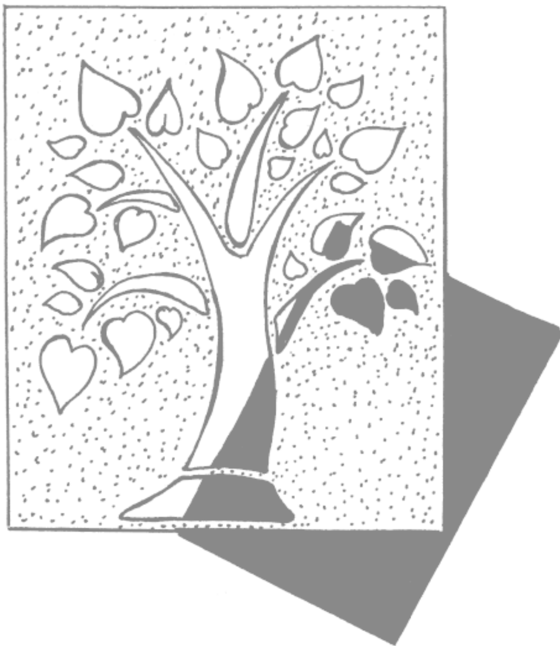
Рисунок 1. Трафарет для декора

Клеевые трафареты очень легки в применении. Верхнюю часть с рисунком нужно осторожно отклеить от основы и прижать к ткани. Убедившись, что рисунок плотно прижат к основанию, при помощи кисти или поролонового тампона нанесите краску. Еще до высыхания рисунка трафарет нужно аккуратно отклеить от ткани, протереть влажной тряпочкой и приклеить к основе до следующего использования. Несомненным плюсом трафаретов становится абсолютная идентичность получаемых рисунков, что, в случае с валенками весьма кстати, ведь требуется декорировать каждый валенок из пары.