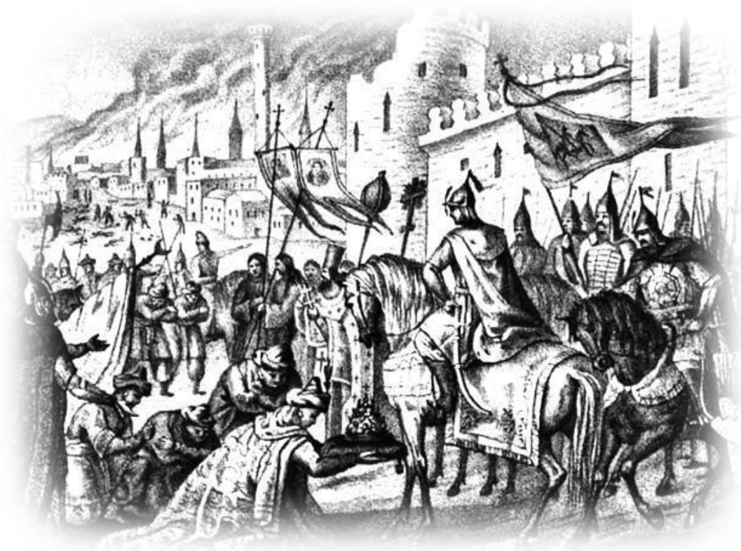
Взятие Казани войсками Ивана Грозного

В дореволюционных и советских трудах были распространены взгляды, будто казачество составилось из беглых крепостных и раскольников [47, 56]. Или из разбойников. Ни малейшей критики подобные версии не выдерживают. На Руси крепостного права не существовало до 1593 г. А церковный раскол случился только в середине XVII в. Казачество возникло гораздо раньше. Да и куда стал бы бежать крестьянин? В татарский плен? Без умения владеть оружием, без организации и навыков выжить в Диком Поле было невозможно. Даже в Литве, во владениях пограничных магнатов, куда действительно бежали крепостные, «оказывалась» лишь часть из них, большинство оставалось крестьянами, заводило привычные им хозяйства – под защитой казаков.