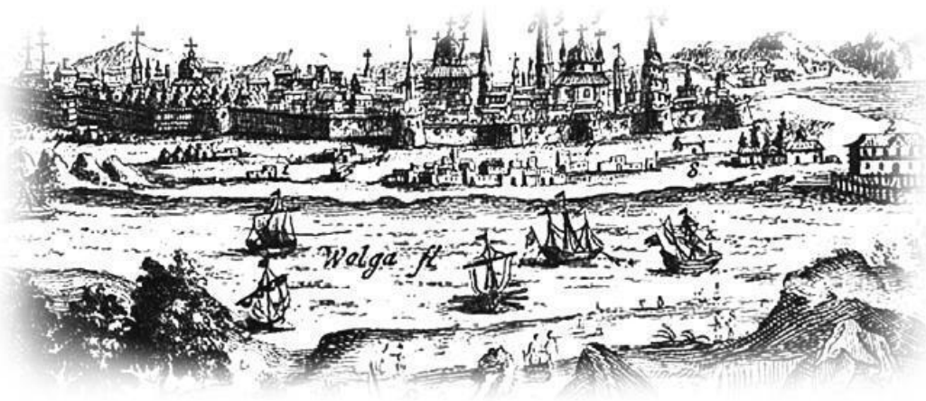
Астрахань середины XVI в.

Взятие Казани стало важной вехой в истории России – для нее открылись дороги на Урал, по Волге. Башкиры добровольно приняли подданство Ивану Грозному, на его сторону перешла Большая Ногайская орда, кочевавшая между Волгой и Яиком. Но война еще продолжалась, осколки Казанского ханства сопротивлялись. Поддерживал их астраханский хан Ямгурчей. В 1554 г. русская рать во главе с Юрием Пронским-Шемякой была направлена на Астрахань. На соединение к ней выступили донские и волжские казаки, которыми командовал атаман Федец Павлов . Но они обнаружили, что и астраханское войско выдвигается навстречу русским. Сами, не дожидаясь государевых полков, неожиданно налетели на врага возле Черного острова и разбили его. Ямгурчей бежал. Павлов на лодках преследовал его, захватил суда с пушками и ханский гарем. Астрахань сдалась без боя. На ее престол посадили сына ногайского хана Дервиш-Али.