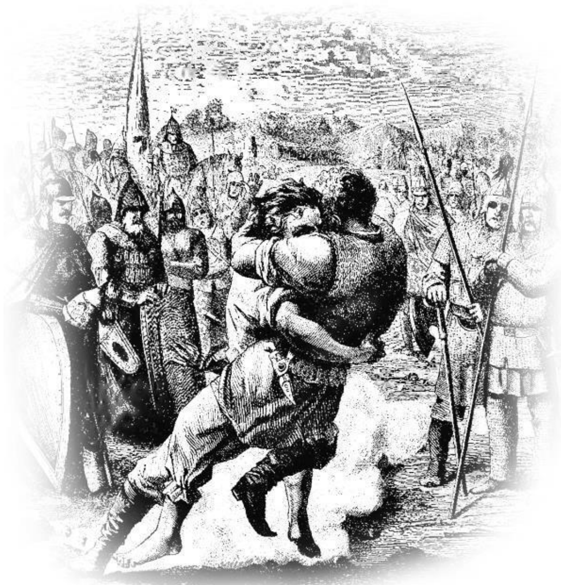
Поединок князей Мстислава Владимировича с Редедей

Откуда взялось само слово «казак»? Обычно считают, что оно тюркское и употреблялось в значениях «вольный воин», «бродяга», а то и «разбойник». Однако в тюркских языках нет близких корней, от которых можно было бы произвести «казак». Следовательно, в лексикон тюркских народов оно попало уже «готовым», извне. Происхождение слова «казак» надо искать не в тюркских, а древнеиранских языках, на которых говорили скифы и сарматы. От них нам достались и названия многих гор, морей, рек – Дон, Дунай, Днестр, Днепр («дан» в древнеиранских языках означало «вода», «река» – кстати, отсюда и русское слово «дно»). А корень «ас» или «аз» (в зависимости от произношения и передачи способный трансформироваться в «яс», «яз») встречается во многих скифо-сарматских этнонимах и топонимах: асии,