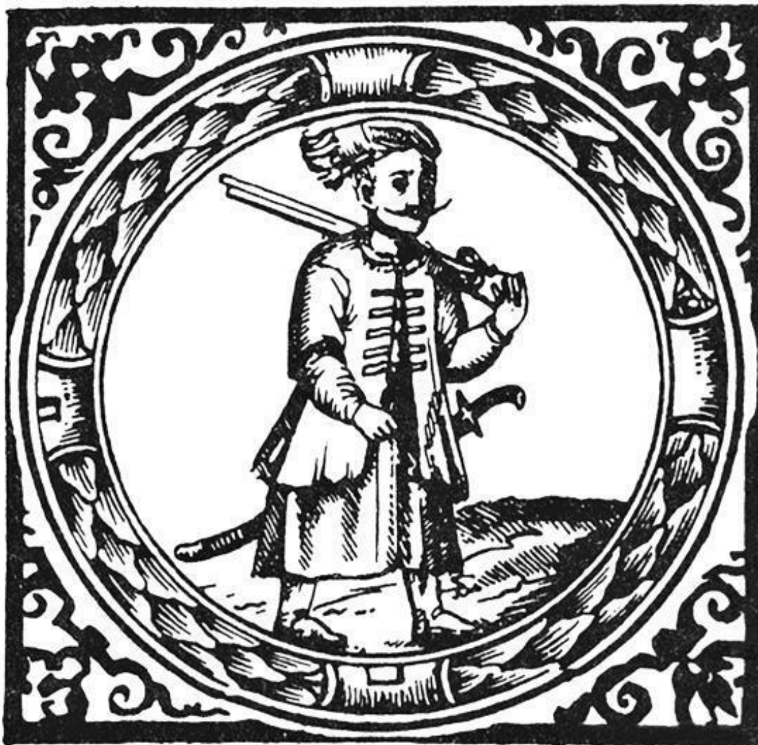
Герб войска Запорожского в начале XVII века. Гравюра из книги «Верши»

Речь Посполитая воевала с Россией, но, невзирая на это, большинство днепровских казаков по-прежнему служили Царю и выполняли его приказы тревожить южных врагов. Хан слал жалобы польскому королю, что «из года в год зимой и летом» они нападают на татар и турок, побивают их, угоняют коней, скот, громят купцов и даже послов, возвращающихся из Польши. Что окрестности Очакова, Бендер, Аккермана, Ислам-Кермена по 4–5 раз за год подвергаются казачьим набегам, а в Киеве, Черкассах, Каневе и Брацлаве содержится не менее тысячи мусульманских женщин и детей.