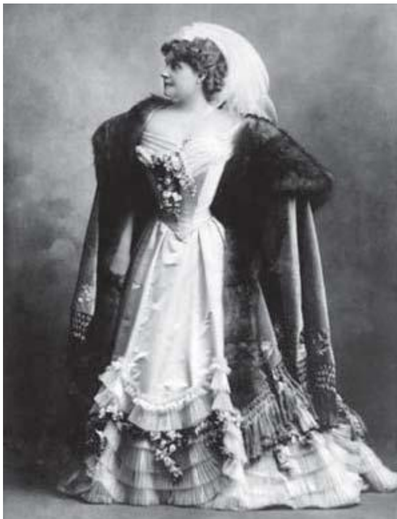
Актриса Габриель Режан в вечернем платье работы Дома моды «Жак Дусе», Париж, 1900-е гг.

Я стал регулярно предлагать свои работы знаменитым модным домам, таким как Дусе 52 , Ворт 53 , Руфф 54 , Пакен 55 , Редферн 56 . Получить туда доступ было нелегко, ведь я конечно же сильно отличался от служащих этих домов. С первого взгляда становилось ясно, что я не из этой среды, но когда меня узнали получше, стали охотно принимать повсюду. Я чувствовал, как у заказчиков пробуждаются уважение и интерес ко мне.