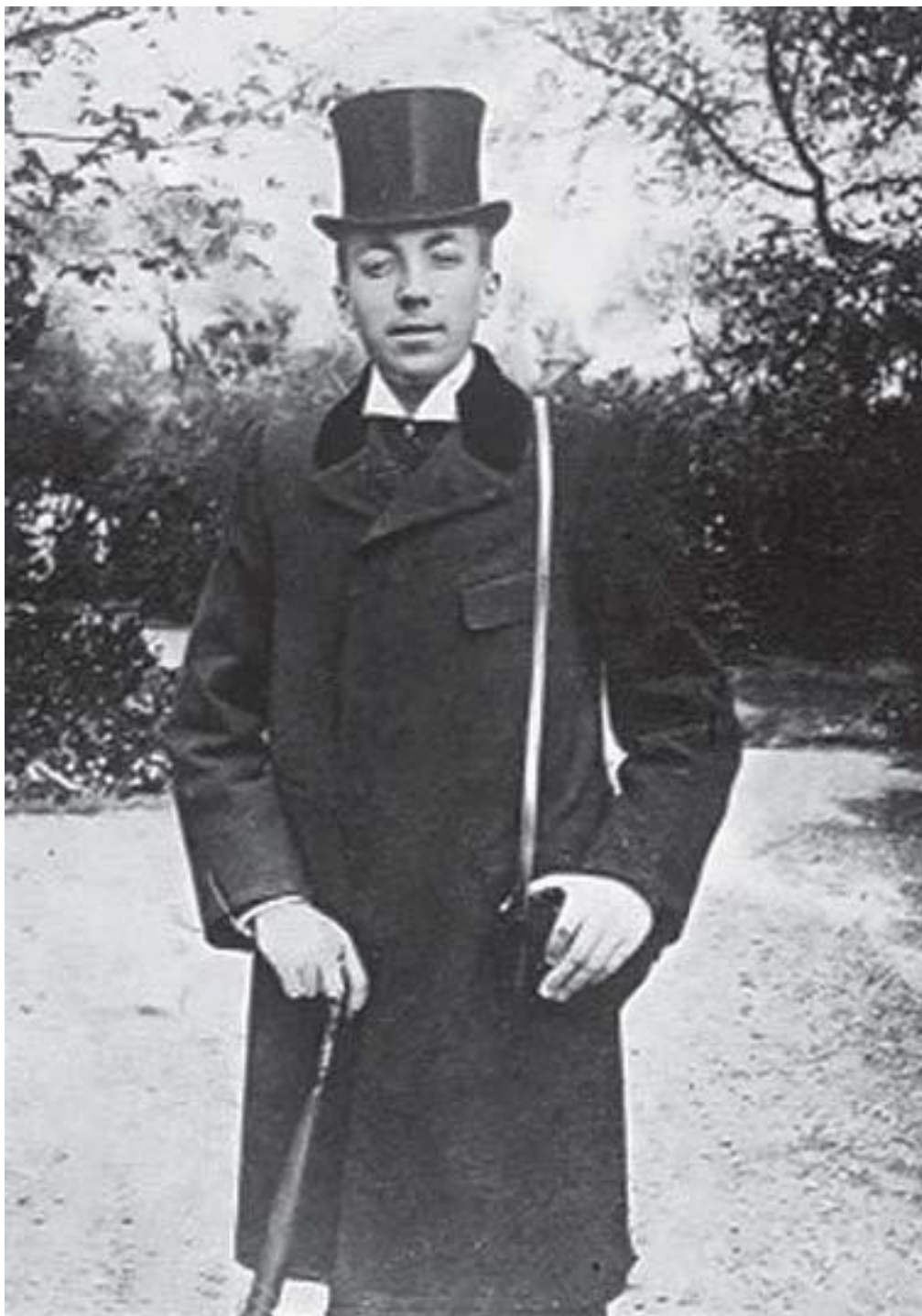
Поль Пуаре, 1898