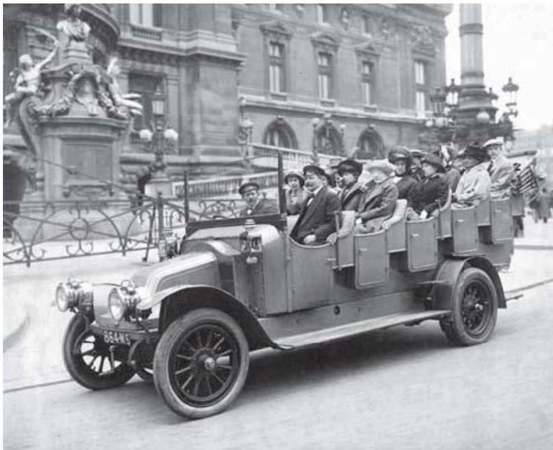
Туристы в прогулочных костюмах в открытом шарабане, Париж, 1910-е гг.