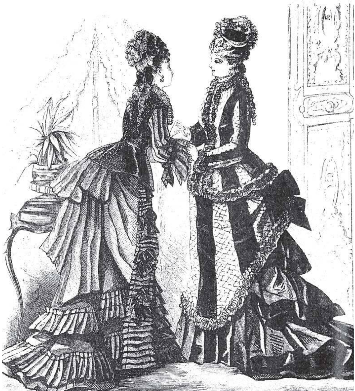
Две модели с турнюрами, 1874

Разве женщины не вправе носить все что угодно, и разве они не владеют секретом, который делает их красивыми.