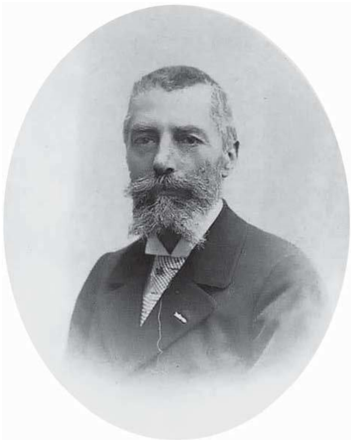
Отец, 1870-е годы

Отец был добрым человеком, хотя с виду казался сухим и нелюбезным, а мать — очаровательная женщина, полная кротости и нежности, и по воспитанию и образованию она была гораздо выше людей ее круга. Я был свидетелем, как росло благосостояние моих родителей, как они радовались, покупая новую обстановку и украшая свое жилище. Все вещи, впоследствии составившее наше имущество, приобретались на выставках 1878, 1889 и 1900 годов.