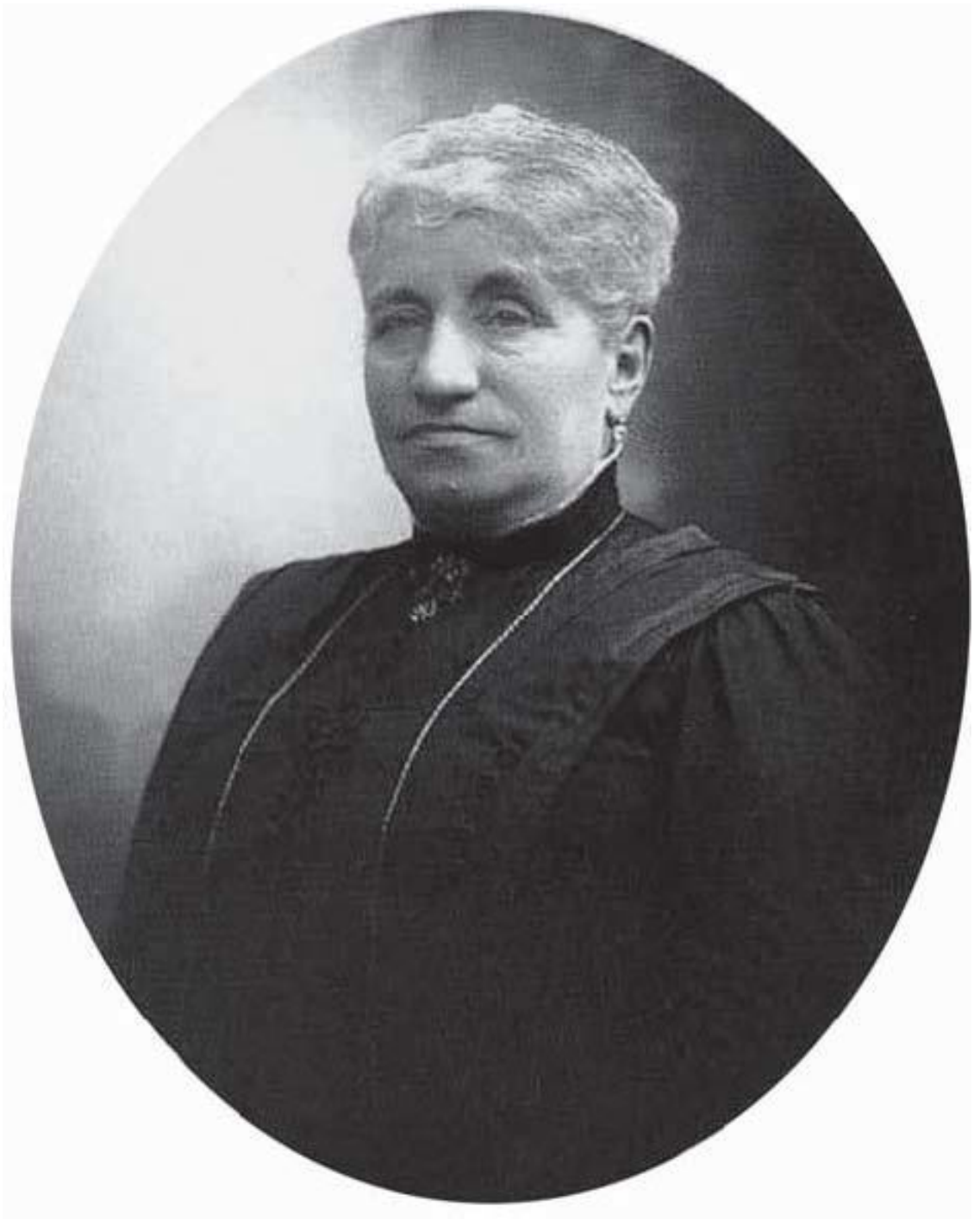
Мать, 1890-е годы