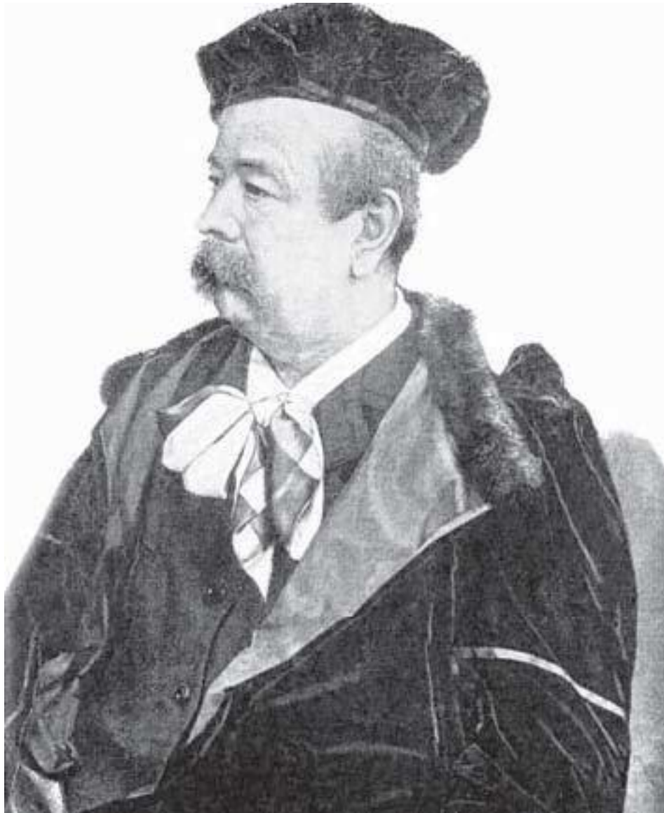
Чарльз-Фредерик Ворт в 1890 г.

Однажды (это было в 1896 году) месье Дусе предложил мне работать только на него, а не пристраивать свои эскизы куда придется. Он взял меня в свой Дом моды и стал покупать все мои работы. Когда я сообщил об этом отцу, он сказал, что этого не может быть: до какой степени он не понимал моего призвания и не верил в мой успех! Отец захотел сопровождать меня к месье Дусе, согласно тогдашней традиции, которая требовала, чтобы работника представляли нанимателю его родители. Хорошо помню, как мы с отцом явились к Дусе, в его изысканно обставленный дом на улице Виль-л'Эвек. Какое ошеломляющее впечатление произвел на меня мой будущий хозяин!