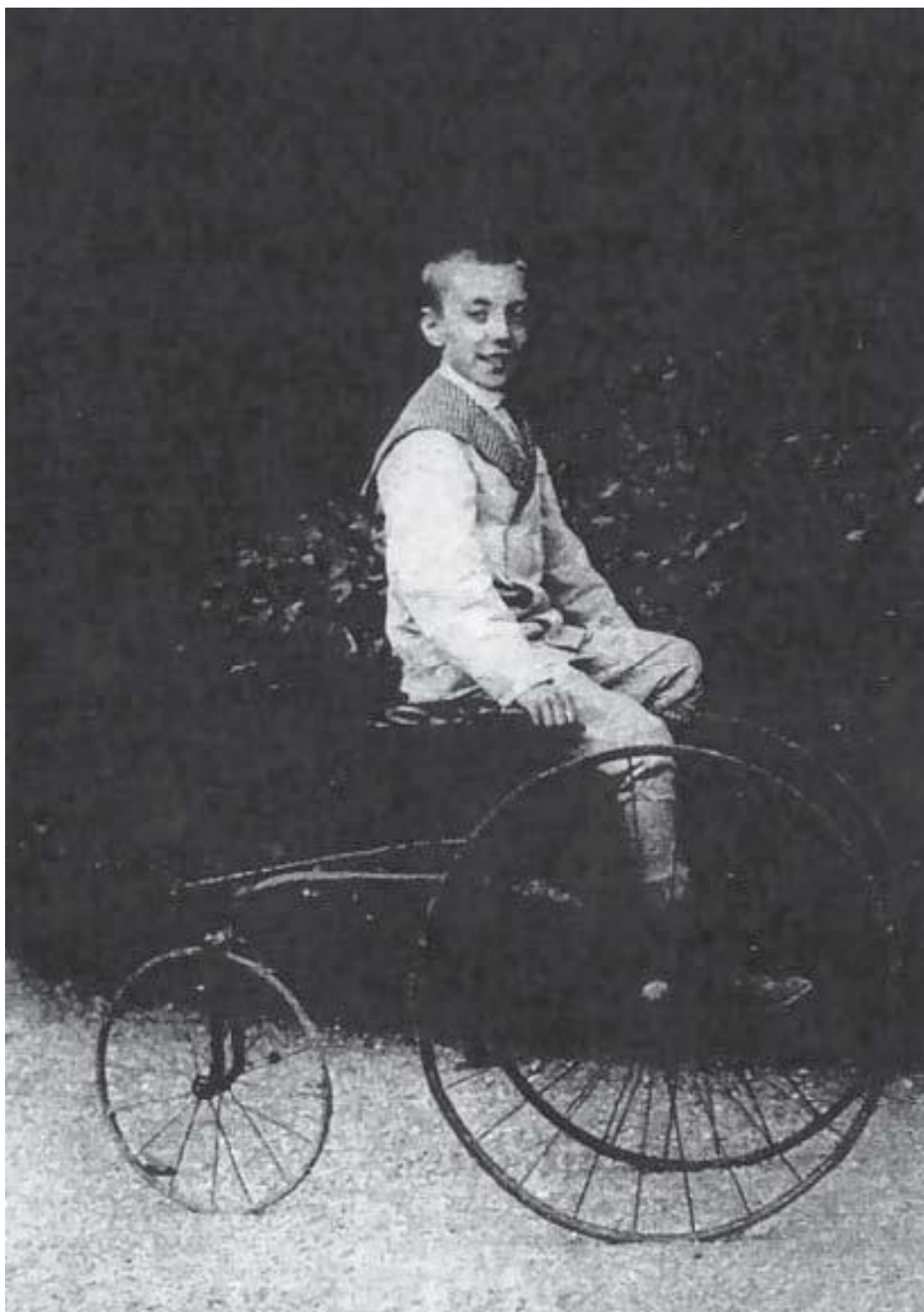
Поль Пуаре в Бийанкуре, 9 лет

На выставке я увидел и другие чудеса: различные области применения электричества, фонограф и так далее... Я хотел лично познакомиться с Эдисоном 9 или написать ему письмо, чтобы от себя поздравить и поблагодарить за то, что он сделал для человечества. Переносная