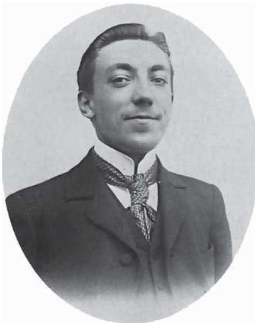
Поль Пуаре в молодости, 1900-е годы

Разумеется, я только и думал, как бы мне отвертеться от этого занятия. Впрочем, мне давали такую возможность: посылали отнести готовые зонты в магазины «Бон Марше», «Лувр» и «Труа Картье». Я шел через весь город, одетый в спецодежду, с тяжелым свертком зонтов на плече.