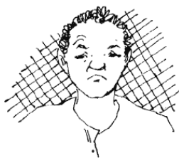
Ментальная напряженность вызвана чрезмерной сосредоточенностью