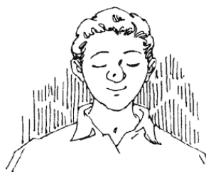
Ментальная стабильность достигается путем отстраненности

Помните: мир – это гигантская школа. Роль вещей и событий заключается в том, чтобы преподать нам урок. Все материальное по сути своей не имеет значения. Мы должны всего лишь использовать предметы и события для обучения и роста, не привязываясь к ним и не сосредоточиваясь на них. Усвоив урок, нужно забыть о предметах и событиях и двигаться дальше. Концентрации и отстраненности нужно учиться одновременно. Об этом постоянно говорил Свами Вивекананда. Умение забывать и отстраняться от прошлого жизненно важно для достижения успеха. Сказано же было: «Хотя иногда имеет смысл помнить, но чаще мудрее будет забыть» 1