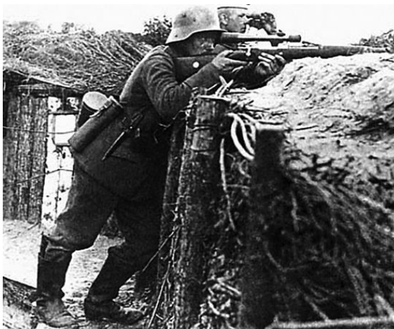
Германский снайпер в передовой траншее. Западный фронт, 1915 г.

Тем не менее подобное стрелковое мастерство пехоты стало практически бесполезным, когда в 1915 году расчет Германии на разгром и вывод Франции из войны потерпел провал (во многом благодаря наступлению русских войск в Восточной Пруссии и Галиции) и на Западном фронте стороны перешли к стратегической обороне. Активные боевые действия сменила позиционная борьба на стабильном сплошном фронте с вялыми и малорезультативными попытками сторон изменить положение.