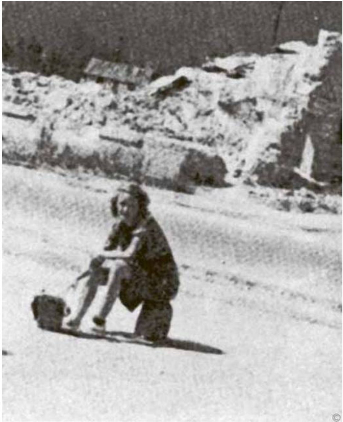
Исход в Коррез