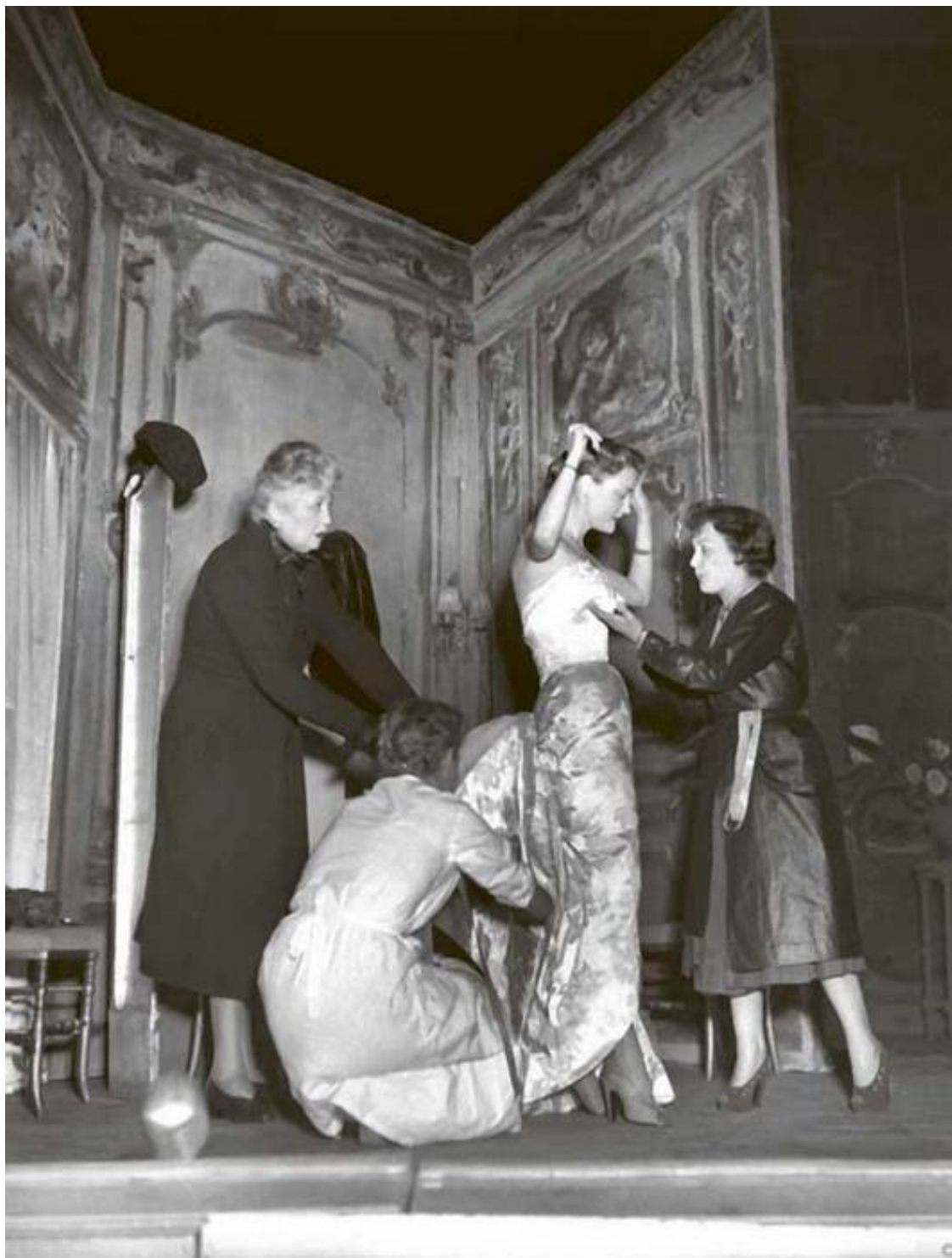
Примерка платья от Бальмена для пьесы Марселя Ашара «Малышка Лили» на музыку Маргерит Монно. Манекенщица Пралин и Эдит Пиаф, театр ABC, Париж, март 1951 г.

талантом! Подобная швея быстро выделяется среди остальных своим вкусом, умелой отделкой работы, неким личным шиком!.. Случается, если повезет, стать первой мастерицей в двадцать пять лет.