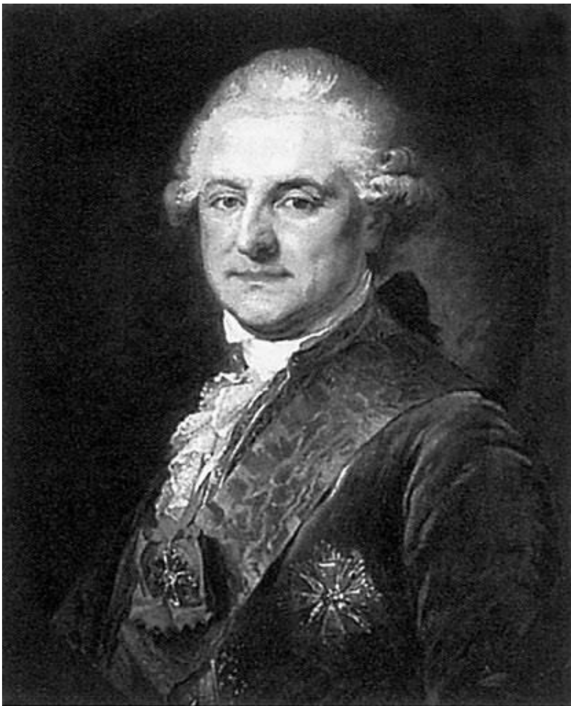
Станислав II Август Понятовский, король Польши. Художник Дж. Б. Лампи

Блестящая дипломатическая победа, однако, вызвала слишком сильное недовольство польских католиков. В марте 1768 года в небольшом городке на юге Польши собрались те, кто желал с оружием в руках отстаивать свою веру и свободу. Расположились они на самой границе с Австрией и Турцией, и любая попытка направить туда войска вызвала бы недовольство в Константинополе. Конфедераты (как их называли) притесняли православных, принуждали переходить в унию и учиняли всяческие насилия. В ответ на это украинские крестьяне подняли восстание, известное как восстание гайдамаков. Однажды гайдамаки разграбили город, принадлежавший крымскому хану. Турецкие власти не стали вникать в подробности и потребовали немедленно вывести из Польши русские войска, фактически объявив войну России. Это стало роковой ошибкой – Россия приняла вызов, и даже направила в Средиземное море