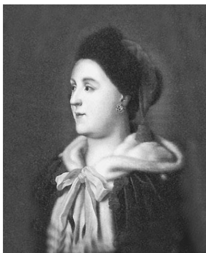
Екатерина II. Неизвестный художник. XVIII в.

Вечером 28 июня 1762 года Екатерина верхом, в гвардейском мундире Преображенского полка, в шляпе, украшенной дубовыми ветвями, выступила с войском из Петербурга. Это была демонстрация: ведь первое, что сделали гвардейцы, – сбросили прусские мундиры, введенные Петром НЕ Екатерина направлялась в Петергоф, куда утром должен был прибыть император. О перевороте там стало известно лишь в три часа дня. В течение нескольких следующих часов Петр III безуспешно пытался что-то предпринять, но в конце концов вступил с Екатериной в переговоры, предложив ей разделить с ним власть. Однако его заставили подписать отречение, после чего бывший император был препровожден во дворец в Ропше. 30 июня Екатерина торжественно возвратилась в Петербург. Фридрих II, узнав о перевороте, заметил, что Петр III «позволил свергнуть себя с престола, как ребенок, которого отсылают спать».