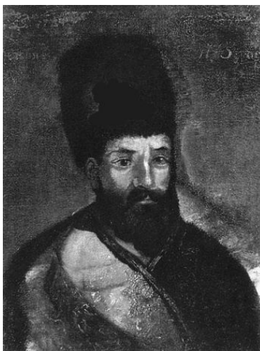
Портрет Е. И. Пугачева, написанный на портрете Екатерины II. Неизвестный художник. XVIII в.

Указы эти и в самом деле нарушили хрупкое равновесие в обществе. Своим манифестом Петр III даровал дворянам освобождение от службы – теперь того же ждали и крестьяне. Ведь крепостная зависимость крестьян в некотором смысле издревле была их службой отечеству: дворянин по первому повелению государя обязан был явиться на военную службу с людьми и провиантом; его крестьяне обеспечивали этот провиант, вооружение и платили подати. Теперь равновесие рухнуло. Крестьяне больше не находили никакого смысла в своем крепостном состоянии.