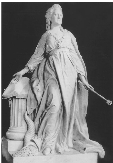
Екатерина II законодательница. Скульптор Ф. Шубин. 1783-1790 гг.

нув им имения, но это вызвало еще большее возмущение крестьян. В 1762 году «в явном возмущении» было около 150 тысяч монастырских и помещичьих крестьян, тогда же бунтовало около 50 тысяч крестьян горнозаводских. Опять понадобилось вмешательство военных отрядов и даже артиллерии. Поэтому через год Екатерина вновь учредила комиссию по церковным имениям. Против нее резко выступил митрополит ростовский Арсений Мацеевич, пользовавшийся в свое время покровительством Елизаветы, – человек неуживчивый и жестокий. Он потребовал у Синода немедленно возвратить отобранные церковные владения. Послание его было настолько резким, что Синод, восприняв его как оскорбление ее величества, передал дело на рассмотрение Екатерине. Она не проявила обычного снисхождения, и Арсения лишили сана и сослали в отдаленный монастырь. Церковные владения перевели в ведение Коллегии экономики, которая должна была теперь вести все церковное хозяйство. Это же ведомство содержало инвалидные дома. Президентом коллегии был назначен совершенно светский человек, князь Борис Куракин.