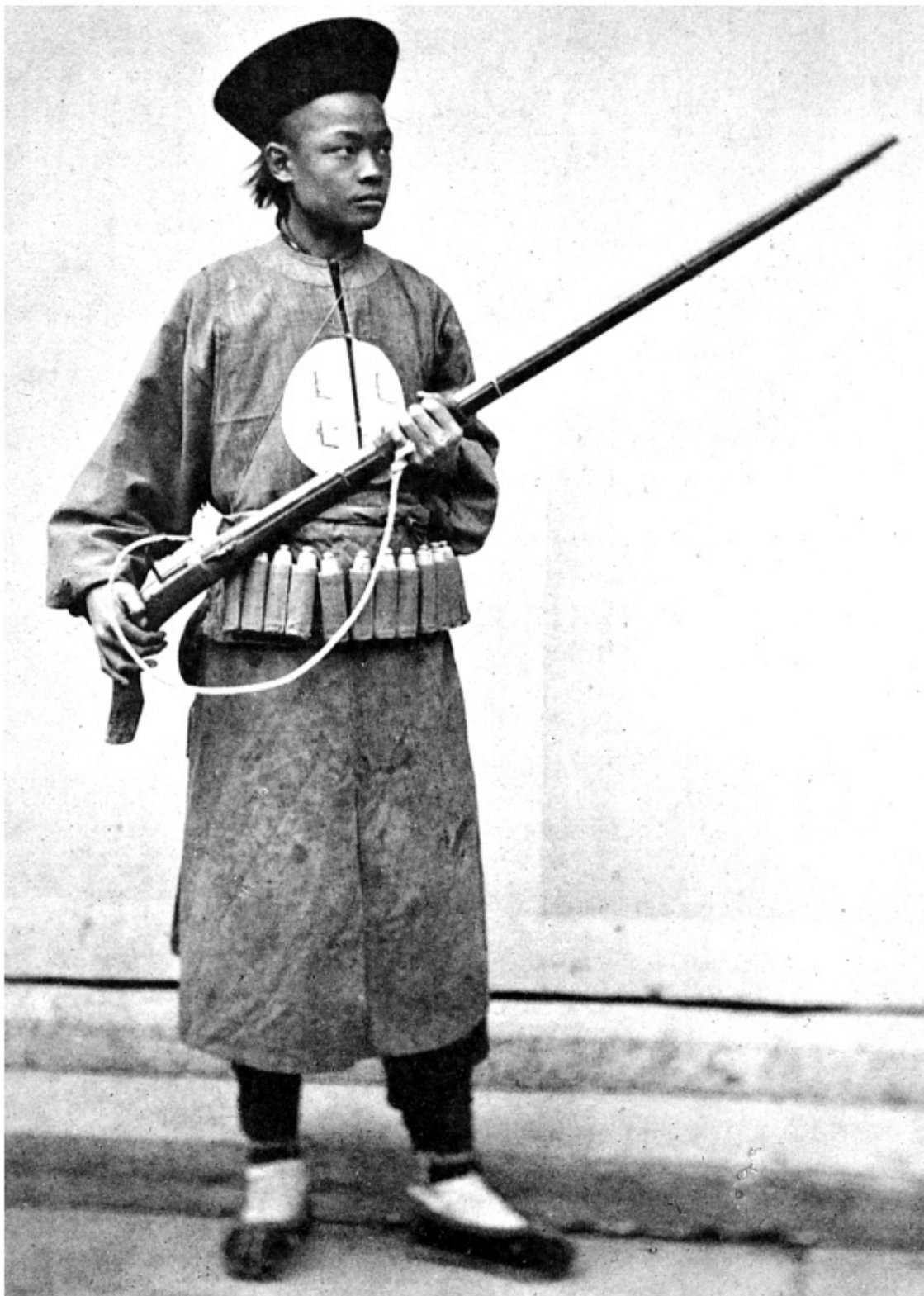
Китайский солдат из «войск зелёного знамени» с фитильным ружьём, фотография XIX века

Здесь необходимо добавить, что китайцы представляются монолитным народом только стороннему наблюдателю, в действительности это конгломерат родственных этносов, зачастую не понимающих друг друга – например, провинциальные диалекты северного Пекина и южного Гауандуна отличаются больше чем русский и польский языки. Так что в ту эпоху для многих