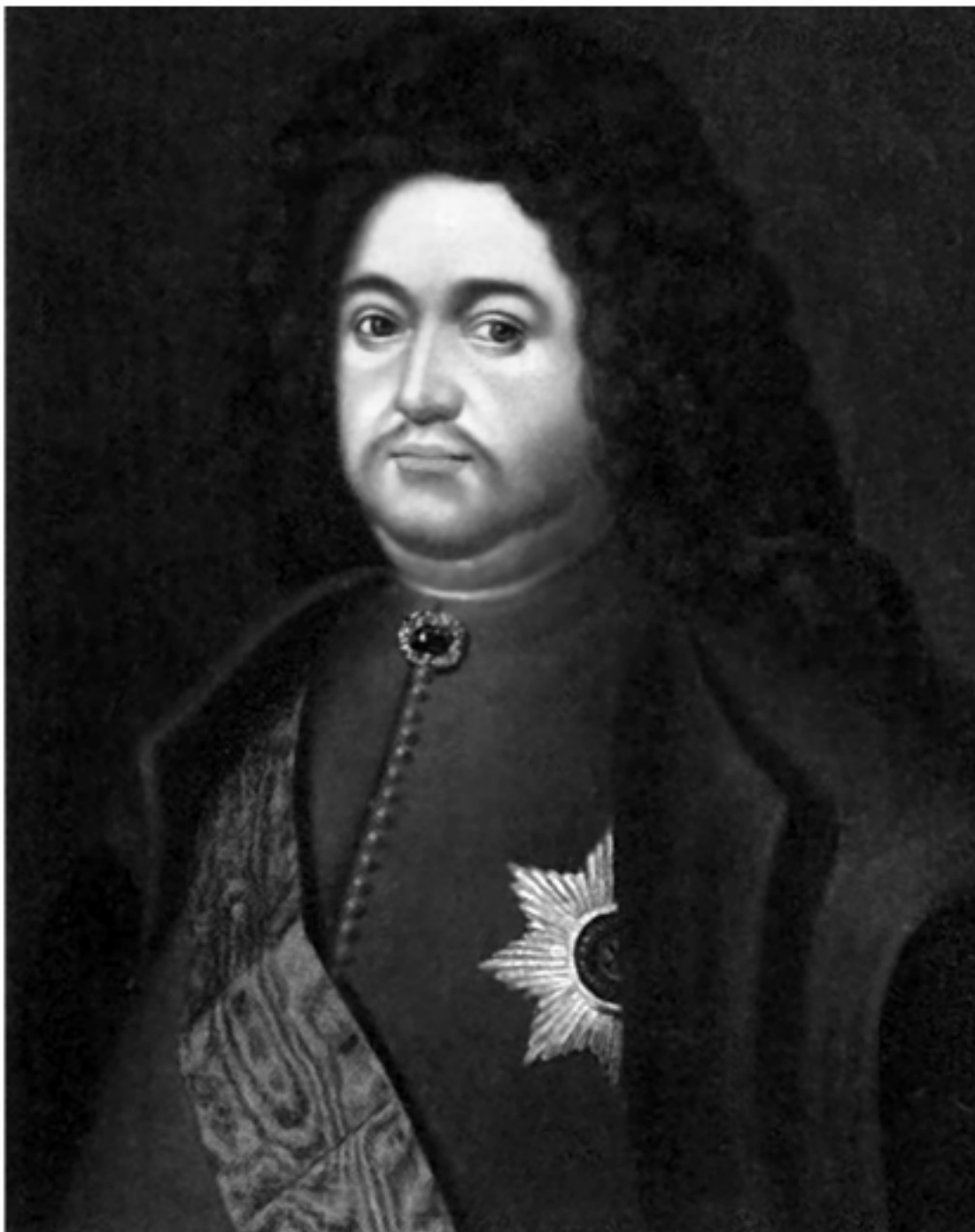
Боярин Фёдор Алексеевич Головин

Но маньчжурские послы требовали куда большего – в Пекине хотели, чтобы граница прошла по реке Селенге и озеру Байкал. Император Сюань всё ещё хотел отодвинуть русских далеко на северо-запад, «вернуть в Якутск». Маньчжуры никогда не владели землями у Байкала, но, как пересказывал их доводы в докладах московскому начальству посол Головин, логика требований из Пекина была простой – «что все те земли от Байкала-моря были владения хана монгольского, а монгольцы все издавна подданные их китайского хана».