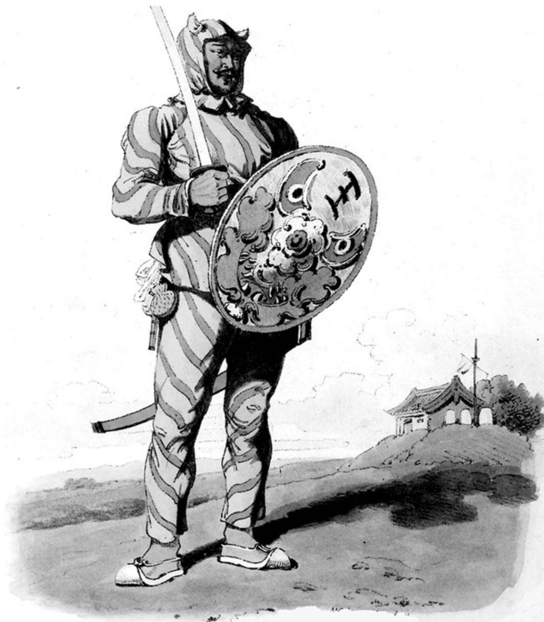
«Тигровый» воин из пекинского гарнизона, гравюра XIX века

Императорском канале, основной транспортной артерии центрального Китая, по которой шло снабжение продовольствием Пекина и северных провинций.