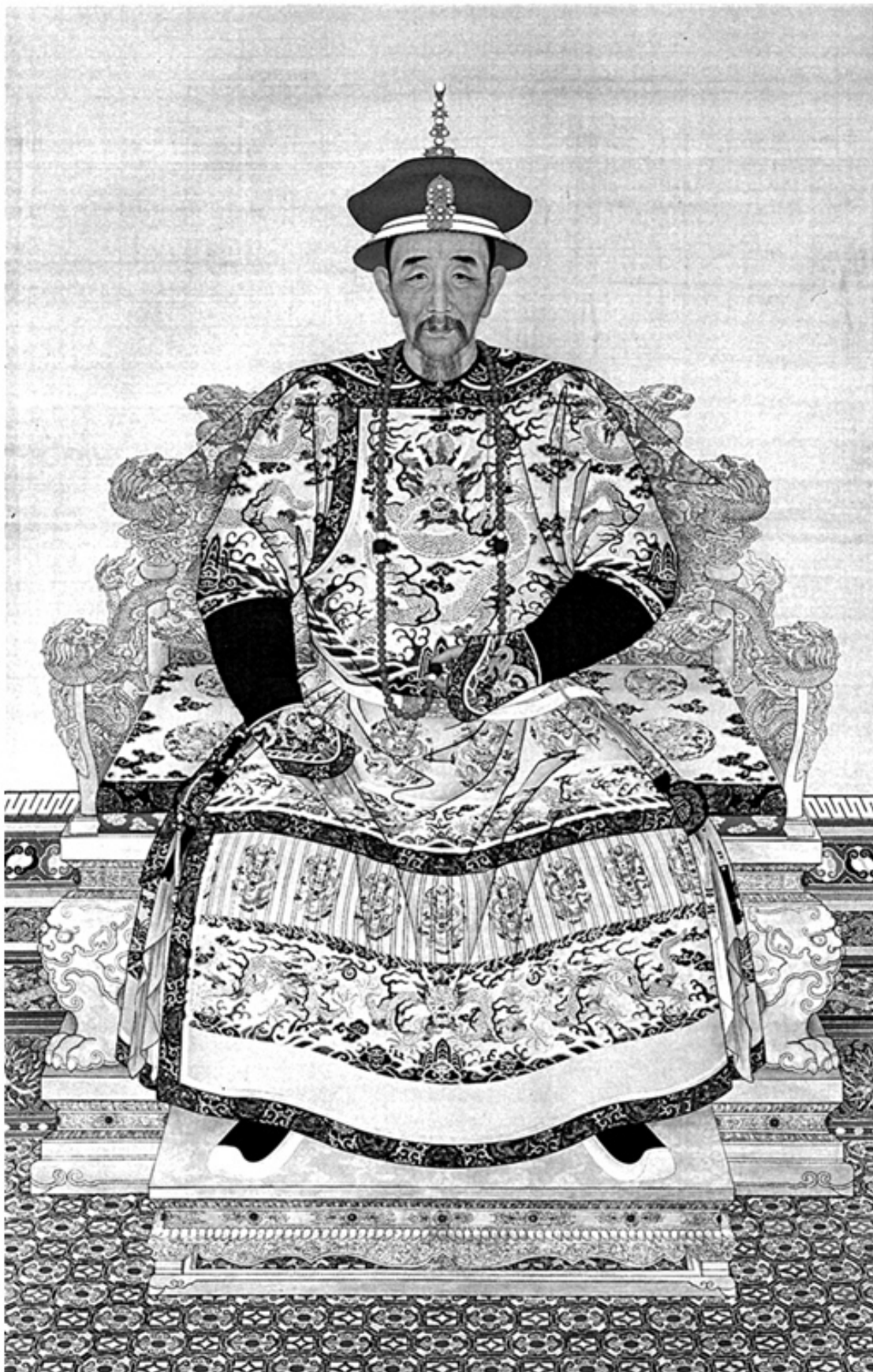
Маньчжурский император Сюанье (Канси). Китайский рисунок начала XVIII века