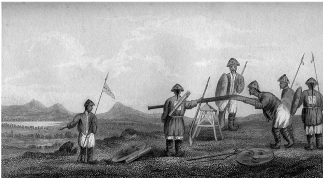
Китайский «гингальс», гравюра 1843 года

При стрельбе такое тяжёлое ружьё обслуживалось двумя бойцами, один клал ствол на плечо и плотно фиксировал его при помощи жгута материи, другой стрелял. По свидетельствам очевидцев, из-за примитивности фитильного устройства и большого количества некачественного пороха, применяемого для выстрела из такого «гингальса», лица многих стрелков носили следы пороховых ожогов.