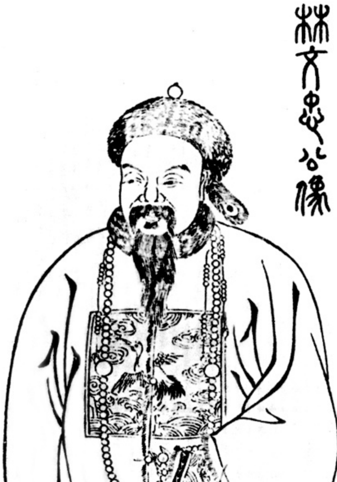
Императорский наместник Линь Цзэсюй

нявший южные берега китайской империи Цин. К тому времени нелегальный ввоз опиума английскими купцами беспокоил даже надменных и костных царедворцев Пекина.