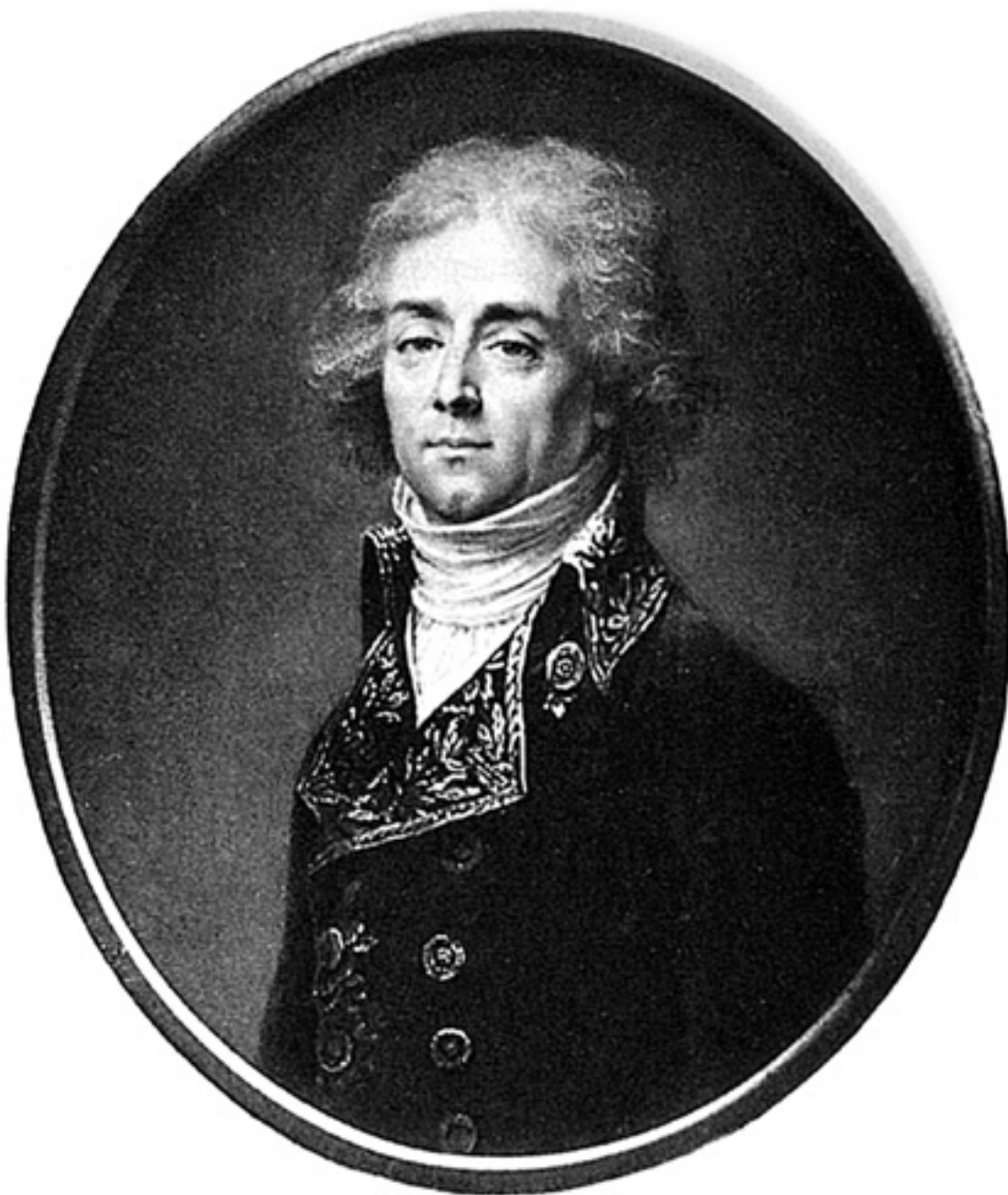
Граф Юрий Александрович Головкин