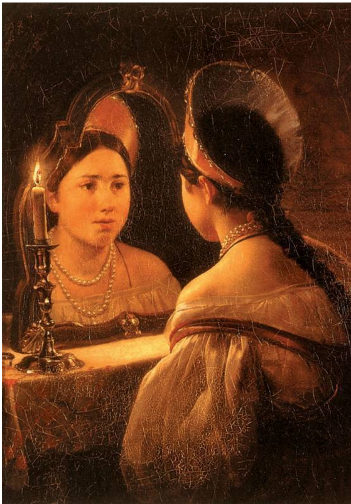
Гадающая Светлана. Брюллов К. П.