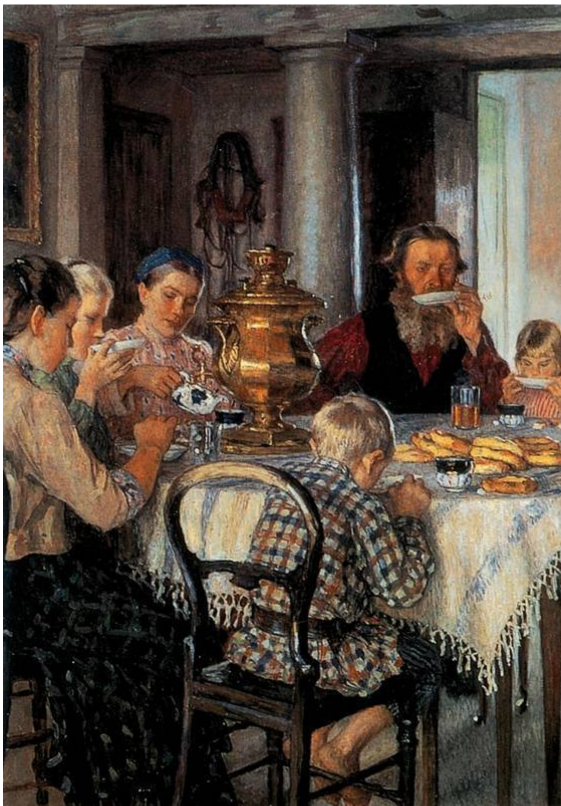
Новые хозяева (фрагмент). Богданов-Бельский Н. П.