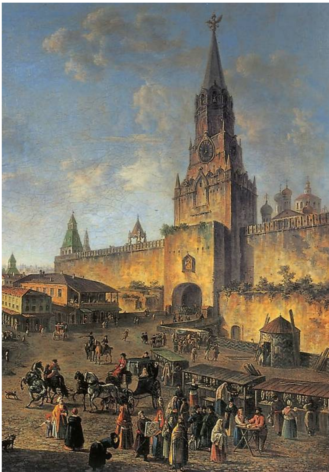
Красная площадь в Москве (фрагмент). Алексеев Ф. Я.