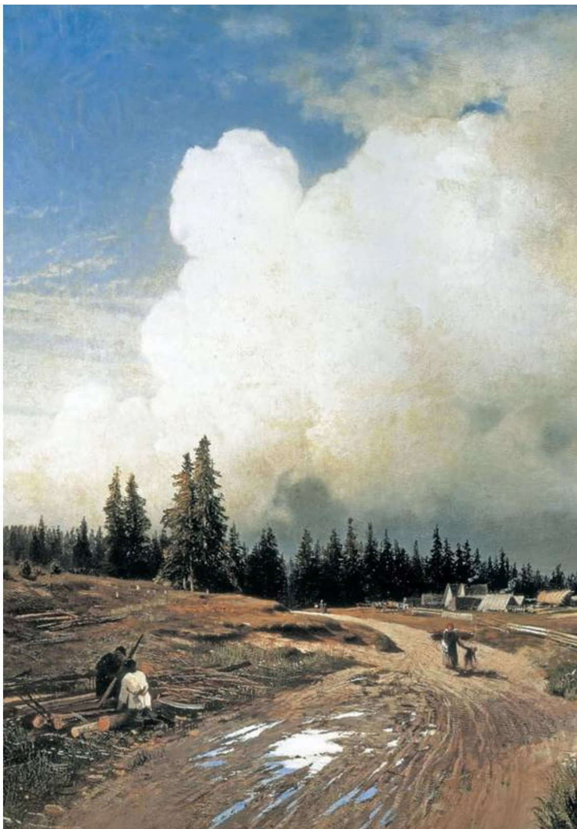
После грозы. Васильев Ф. А.

Россия без дураков теряет свою интеллектуальную привлекательность. А. И. Брежнев