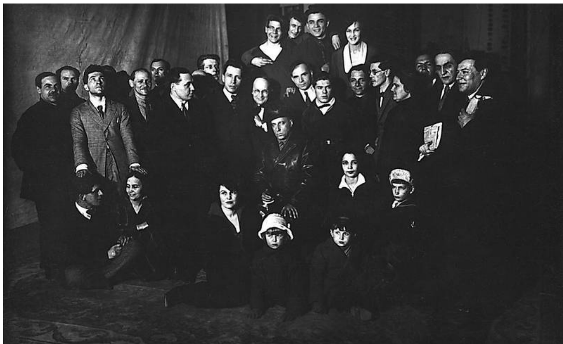
С труппой театра. 1926