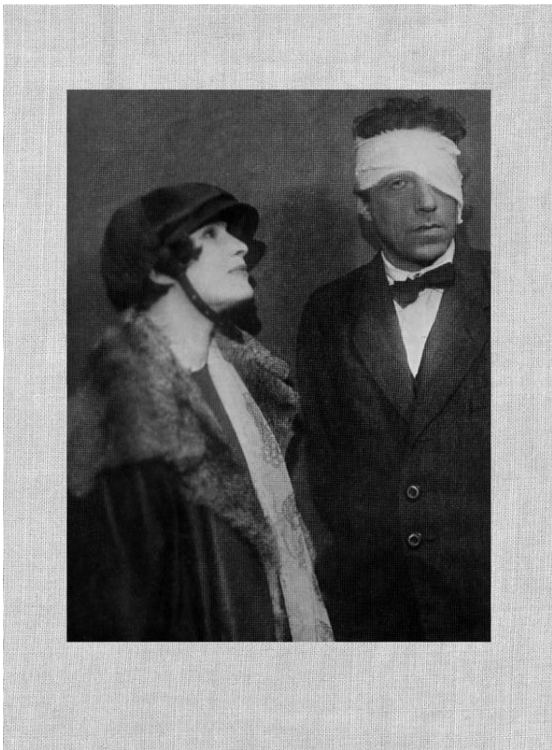
З.Н.Райх и В.Э.Мейерхольд. 1924. (Мейерхольд после обрушения конструкции «Леса»)