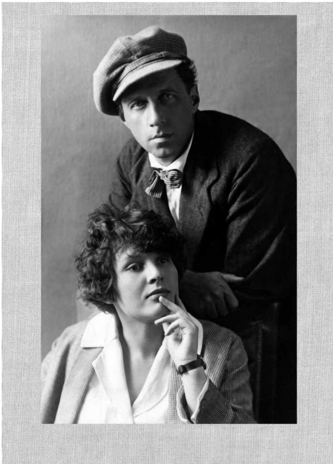
З.Н.Райх и В.Э.Мейерхольд. 1923