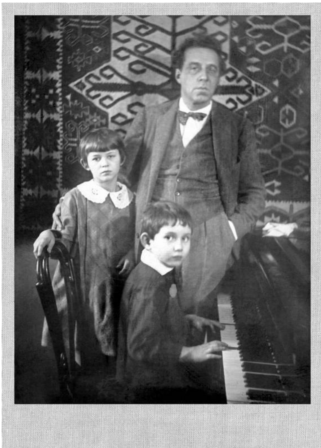
В.Э.Мейерхольд с Таней и Костей. Новинский бульвар, январь 1928 г.