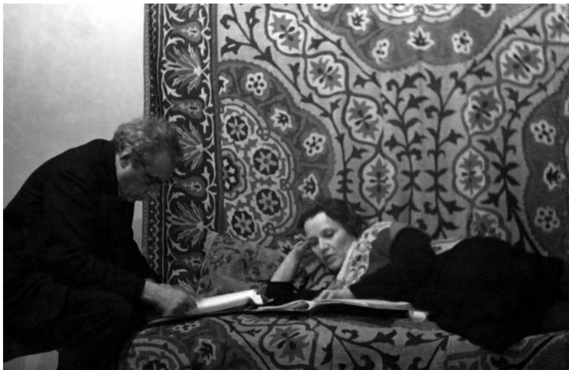
З.Н.Райх и В.Э.Мейерхольд. 1937