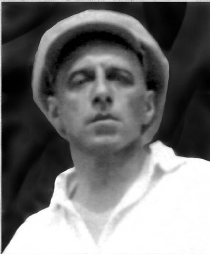
В.Э.Мейерхольд. 1924 (?)