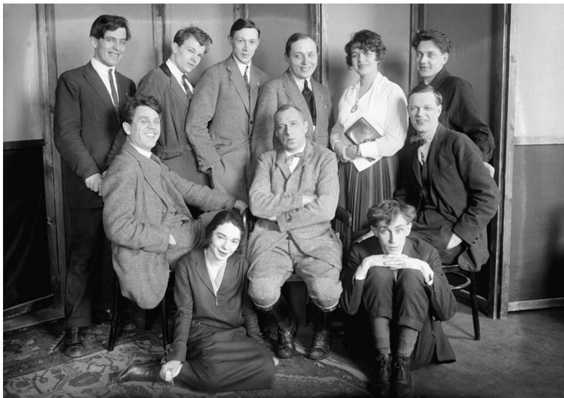
В.Э.Мейерхольд с первым выпуском ГЭКТЕМАСа. 1926