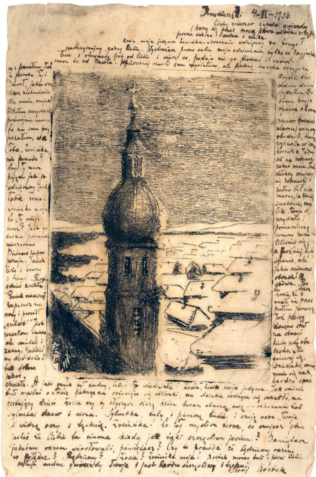
Коллаж по мотивам работ М. Чюрлениса