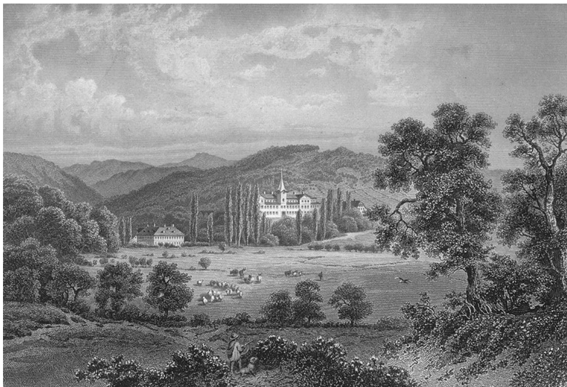
Учебно-воспитательное заведение Зальцманна в Шнепфентале, гравюра, 1810 г.

Карл Риттер, до 1796 года воспитывавшийся в Ш., начиная с 1817 года опубликовал 21-томный труд «География в отношении к природе и истории человека»; наряду с Гумбольдтом Риттер считается основателем научной географии.