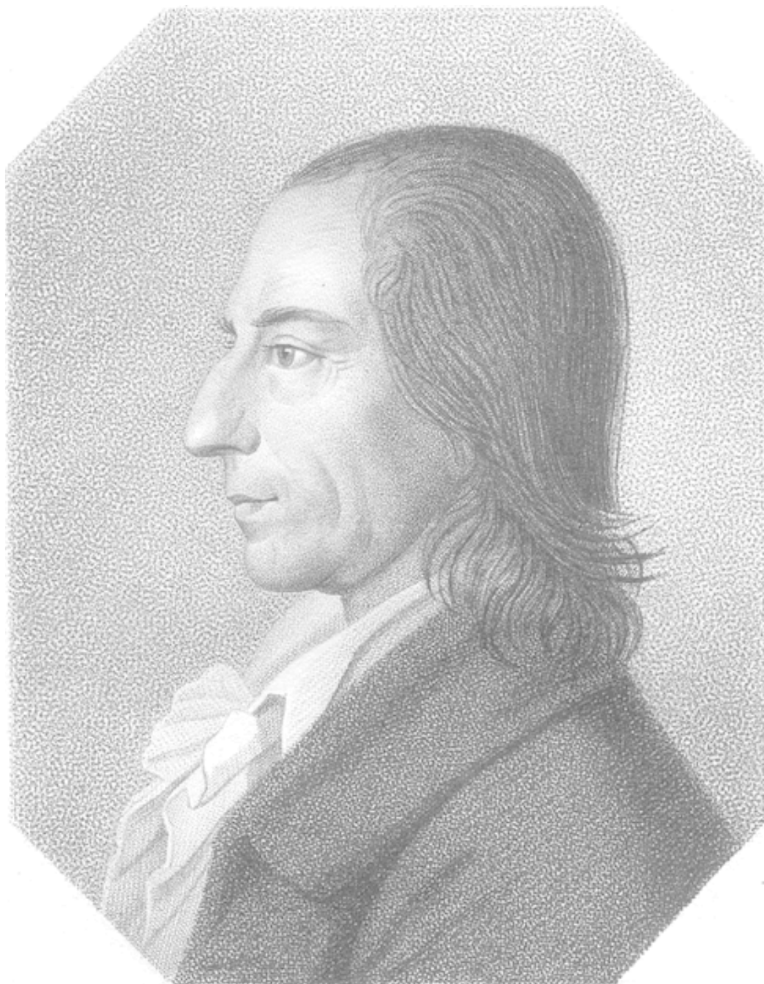
CHRIST: GOTTHILF SALZMANN.