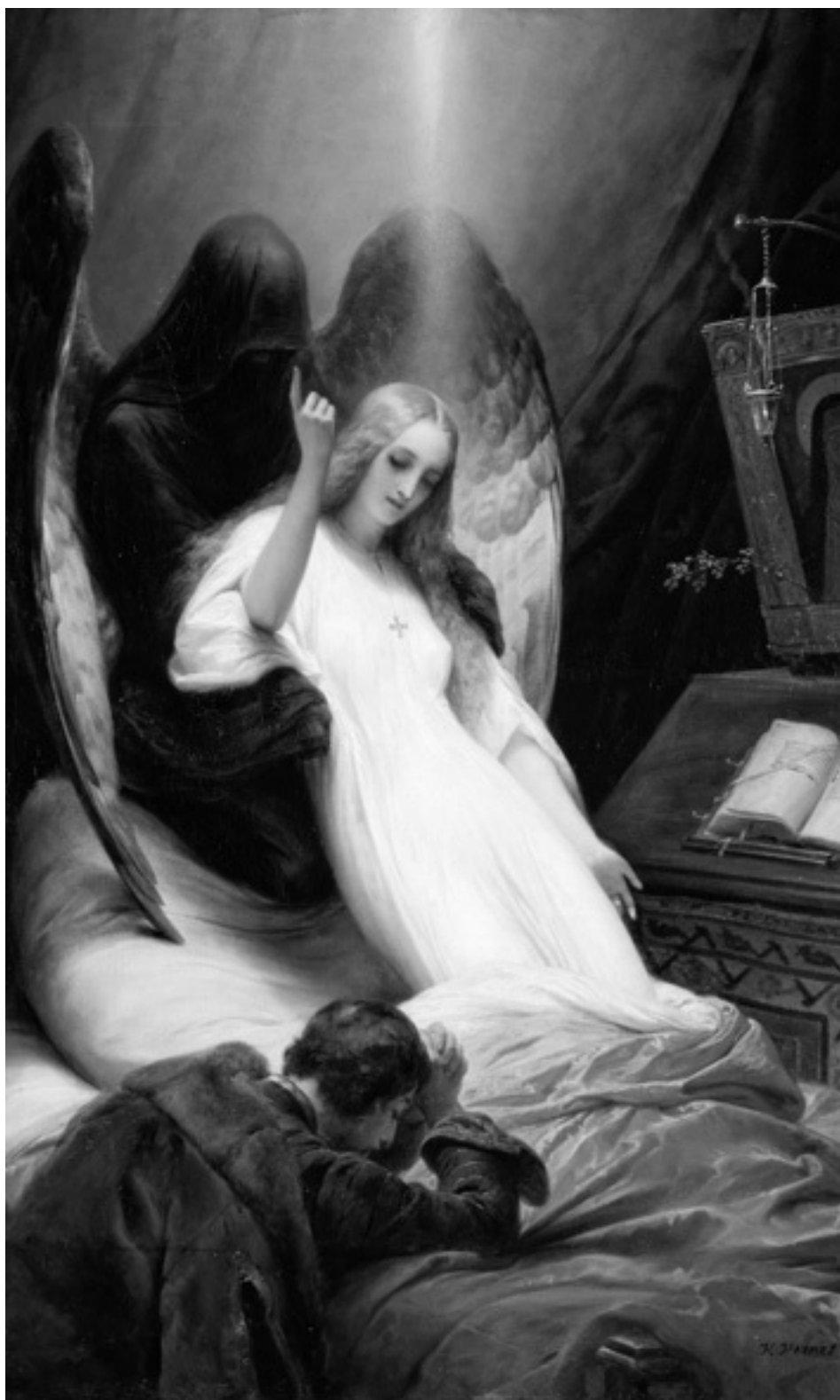
Орас Верне. Ангел смерти