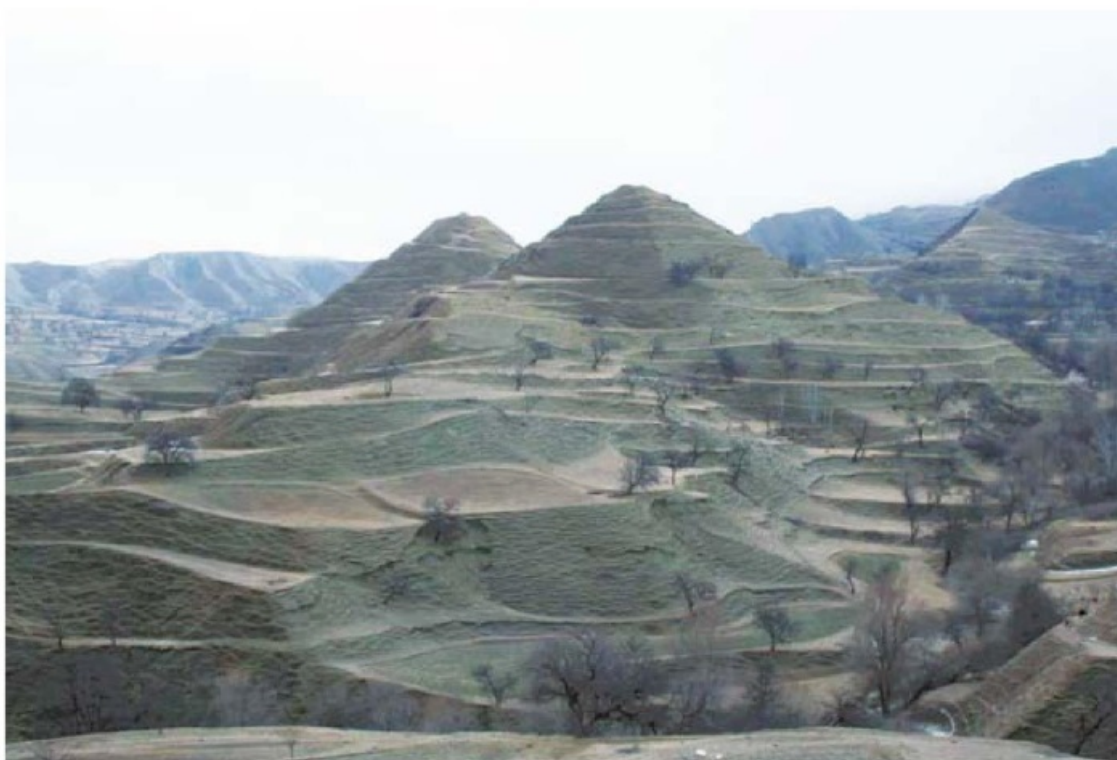
Кудалинские «пирамиды». 2010 г.