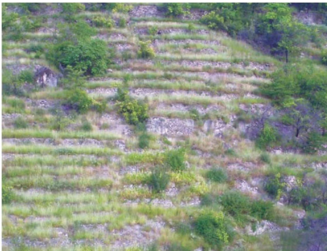
Виноградные террасы Читля. Ныне заброшены

Другой подвид узкополосных террас – это такие поля, когда поверхность поля очень узка (не более одного-двух шагов в ширину) и значительно уступает высоте подпирающей эту поверхность стены. Их араканцы называют «ч̑иваял» (значение слова близко к понятию «налепить», «прислонить»).