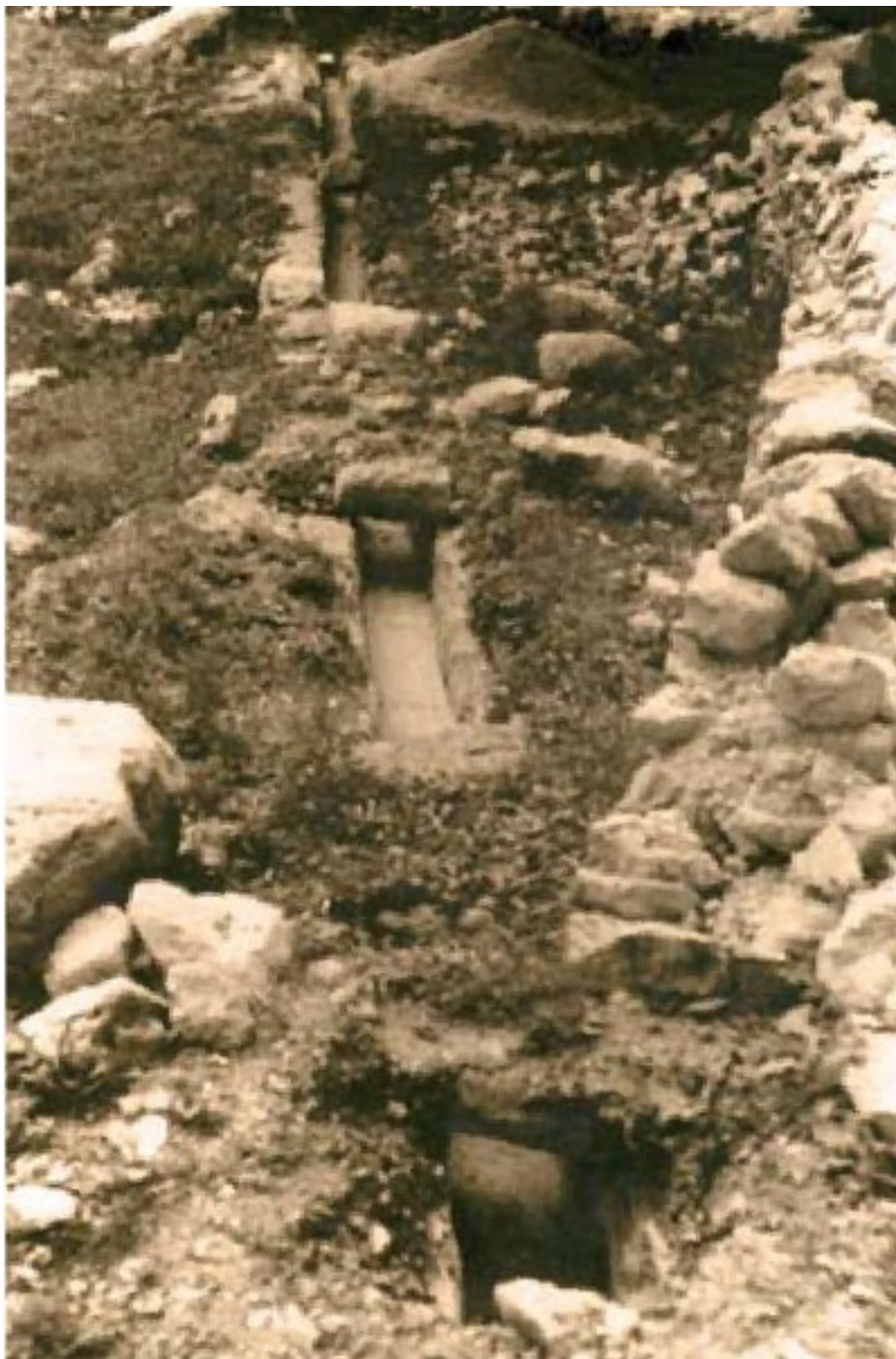
Облицованный крытый канал в игалинских садах. Фото 1965 г.