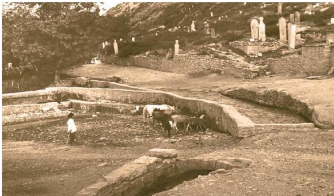
Акведуки Старого Чиркея. 1965 г.

Д.Н Анучин, видевший акведуки в с. Хаджалмахи, отмечает: «Около аула достоин внимания водопровод, доставляющий воду по трубам и желобам с другой стороны реки на довольно значительное расстояние с гор.