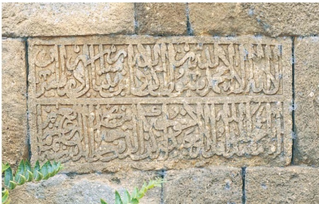
Рис. 2. Дербент. Культовое место Баб ал-Кийама. Надпись 814 г.х./1412 г. о строительстве «благословенного здания»