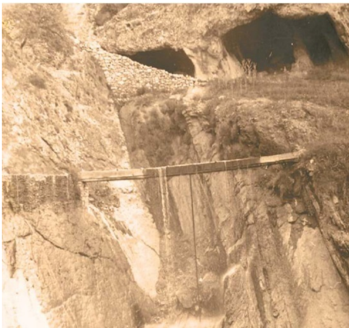
Переброска воды через ущелье. Наверху тоннели-каналы. Гергебиль. 1967 г.

Уровень воды в канале обычно определялся сравнительными пометками на стенах каналов – общее количество воды измерялось временем, вычисленным относительно понятия единицы водоизмещения – «борозда» – «канал». Одна «борозда» вмещала воду, достаточную для работы водяной мельницы. Например, «головной» канал Гергебильских садов вмещает 15 «борозд» воды. У разных обществ или народов встречались и другие единицы измерения. В Хаджалмахи, например, употребляли термин «иркла», которым обозначали рукав от главного канала. В общем же по Дагестану понятие «канал» – «борозда» было наиболее распространенной величиной.