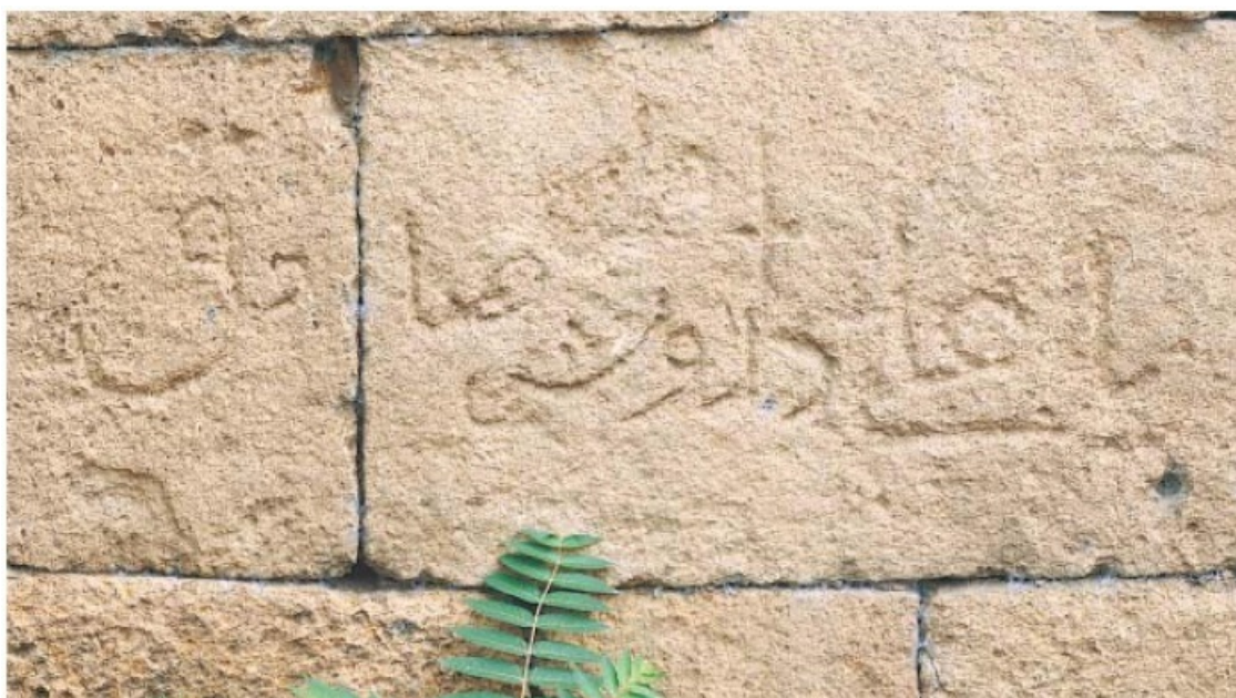
Рис. 3. Дербент. Культурное место Баб ал-Кийама. Надпись дервиша Сади́ка

южной городской стены). Сама стена вокруг арки в оборонительной стене рядом с башней буквально «усеяна» сотнями, вбитыми в нее до конца, железными гвоздями, как коваными средневековыми ремесленного производства, так и фабричными XIX – начала XX вв. Здесь же, на куртине и башне, мной были выявлены три арабские надписи XI–XIII вв.: одна из них состоит из одного слова, выведенного почерком куфи – масджид «мечеть», вторая – написана курсивным насхом и представляет собой фразу человека-суфия – «Йа, 'Али, дервиш Сади́к» (рис. 3), третья – плохо сохранилась и не разобрана. Надписи датируются по палеографическим особенностям XI–XIII вв. Начальная фраза второй надписи («Йа, 'Али...») является характерным восклицанием, обращением к имени 'Али б. Аби Талиба – двоюродного брата и зятя пророка Мухаммеда, четвертого «праведного» халифа, особо почитаемого и обожяемого шиитами как святого и героя, «идеального рыцаря ислама», по выражению И.П. Петрушевского.