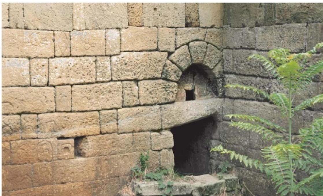
Рис. 1. Дербент. Культовое место Баб ал-Кийама

Но в данной статье речь пойдет о другом культовом памятнике, который являлся одним из наиболее почитаемых мусульманами объектов в средневековом городе и который был вновь выявлен только в наши дни. Еще в XVIII–XIX вв. он был известен под названиями араб. Баб ал-Кийама, тюрк. Кийамат-капы, перс. Дар-и Кийамат, что в переводе значит «Ворота Судного дня» или «Во рота Воскресения». Местонахождение этого средневекового, ныне забытого и не функционирующего, мусульманского культового места не было известно. Его местоположение около башни № 50 северной городской оборонительной стены (с наружной стороны, за пределами средневекового обживаемого города- шахристана ) (рис. 1) было установлено на основании сопоставления сведений письменных источников и расположенных на данном участке стены и башни многочисленных вырезанных знаков и известной персидской надписи 814 г.х./1412 г. о строительстве здесь «благословенного здания».