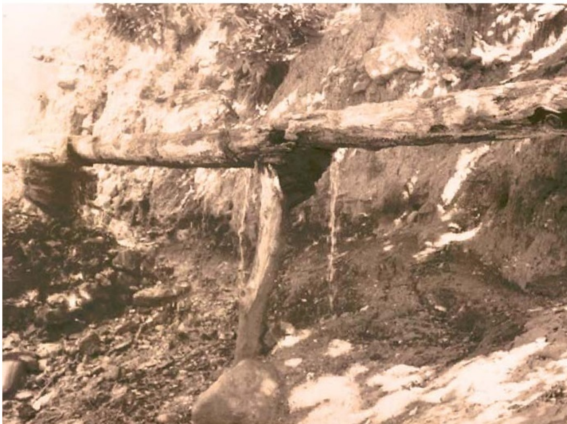
Деревянные акведуки в гимринских садах. 2005 г.