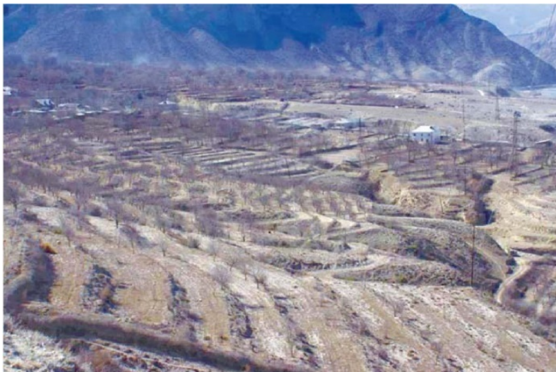
Игалинский садовый оазис зимой 2008 г.

Террасирование склонов происходило, как а) отдельное строительство террасы на подпорных стенах и б) создание горизонтального поля (полей) на склоне горы путем его пропашки.