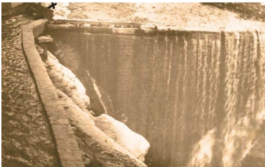
Плотина для подъема воды в ирригационные каналы в Старом Чиркее. Построена на средства генерала Пазулава (XIX в.). 1965 г.

Еще до затопления Чиркея в 1965 году мною сфотографирована последняя функционировавшая дамба-плотина, от которой отводилась вода в каналы. Чиркеевцы с помощью каскада дамб-плотин подняли из ущелья воду не менее чем на 30 м по вертикали, благодаря чему смогли разбить сотни гектаров орошаемых садов. Такая развитая каскадно-дамбовая система преграждения речки, кроме как в Чиркее, нигде не зафиксирована, хотя в более простых вариантах она спорадически встречалась по всей зоне Хиндалала.