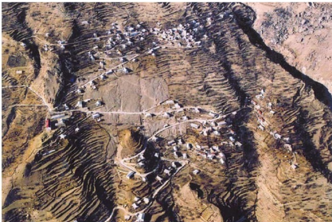
Малый Гоцатль (вид сверху). 2009 г.

террасное земледелие, расположенное применительно к рельефу, огромными амфитеатрами. Вряд ли можно лучше использовать землю, чем это делают в Дагестане» 4 .