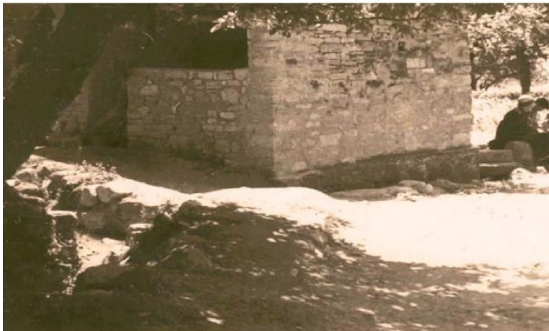
Магъил кІалтІу. Гергебиль. 1968 г.

Во время жеребьевки уравнивали людей по всем авалам так, чтобы каждый авал включал четверть населения. Затем в каждом авале люди делятся на еще более мелкие группы, примерно по 25 человек. Эти последние группы называются «рикьи» (от слова «рикьизе» – делить). Число «рикьи» равняется числу основных каналов (рахъал), расходящихся от главного канала у «магъил кІалтІу» («ворота пашен»).