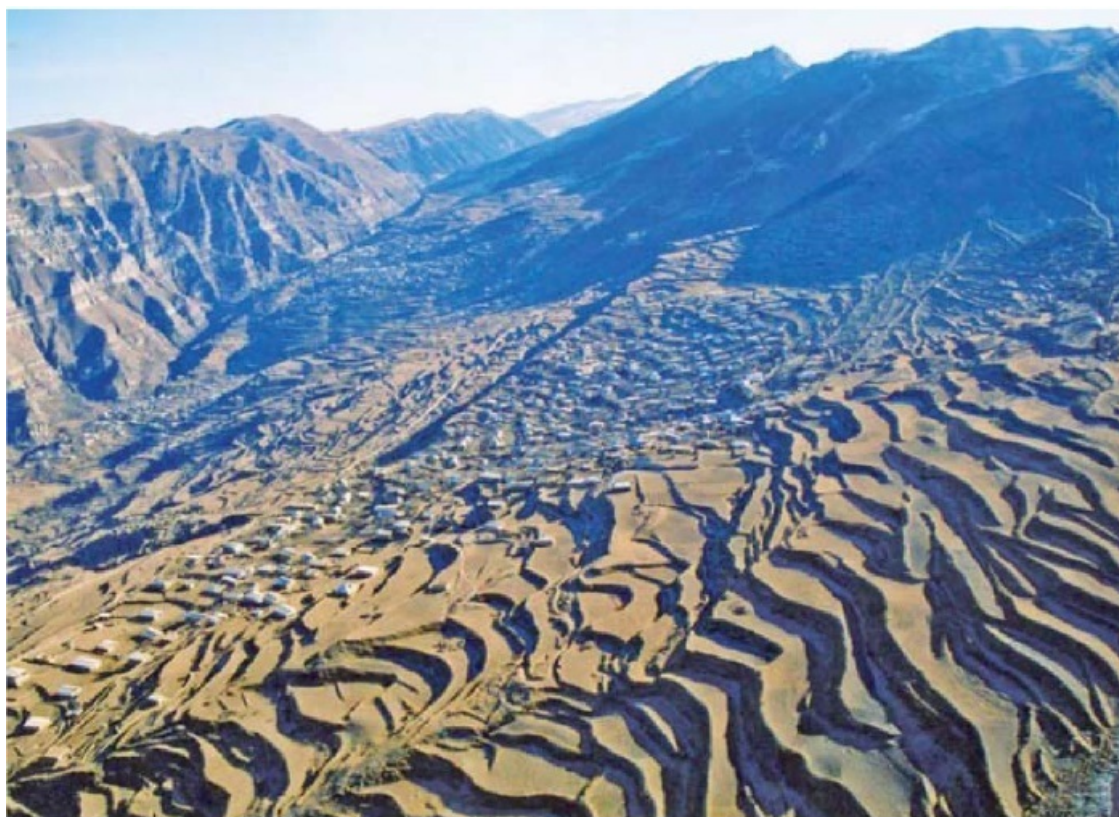
Террасные поля между Кахибом и Гоором. 2009 г.