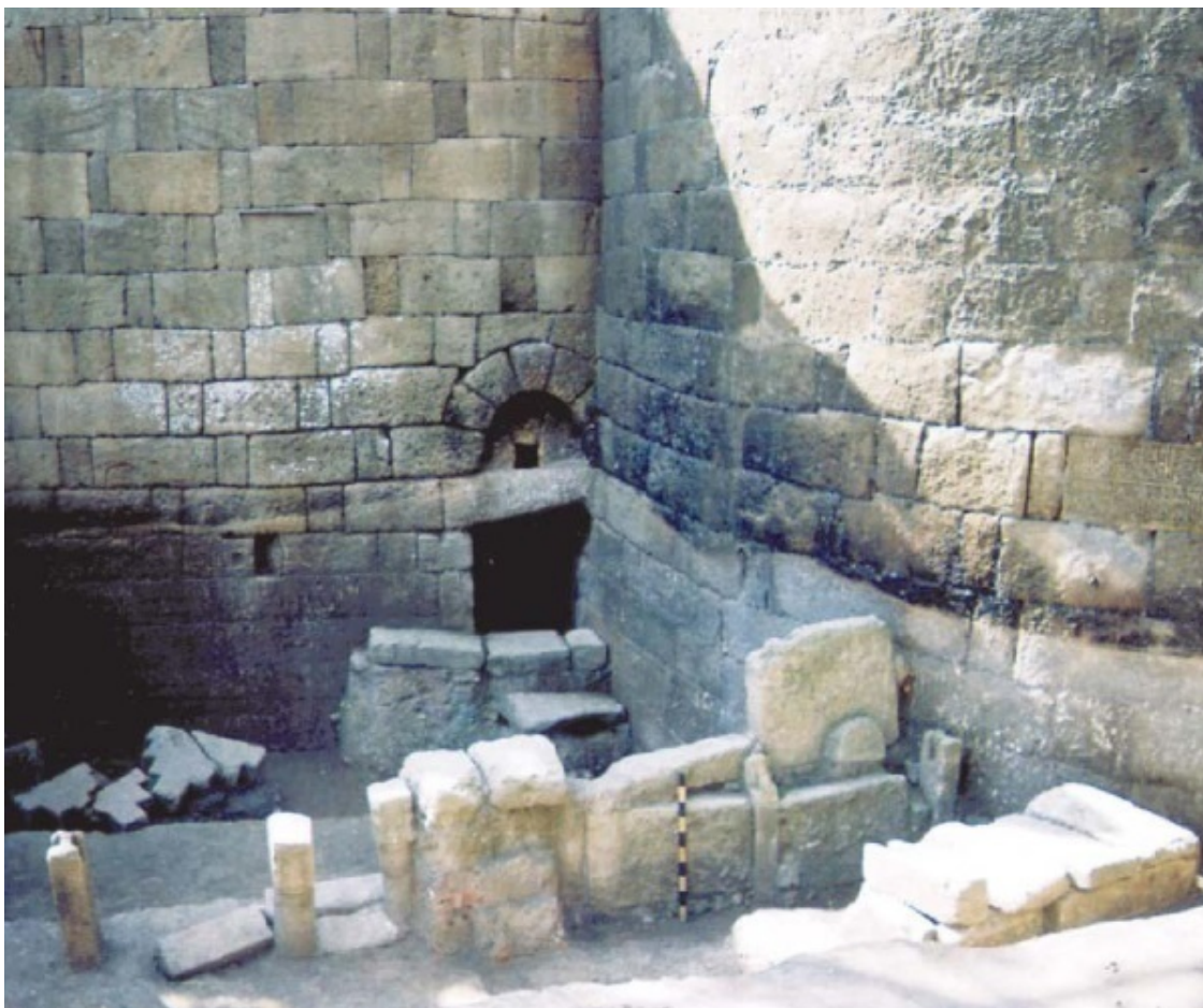
Рис. 4. Дербент. Раскоп XXII. Культовое место Баб ал-Кийама

Рядом с башней, за пределами ограды, непосредственно под надписью 1412 г., было расчищено мусульманское мужское погребение в каменном ящике XIV–XVI вв. (рис. 5). Еще одно мусульманское погребение зафиксировано у северного угла раскопа.