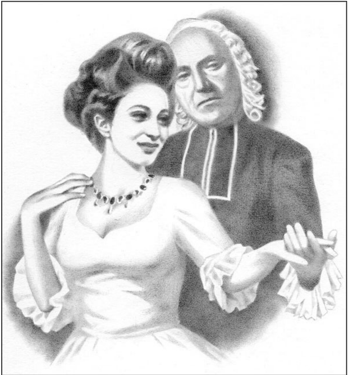
Аббат и княжна

В упадке сил я часто пребываю, Духовного целения моля.